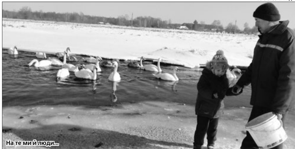
На те мий люди...