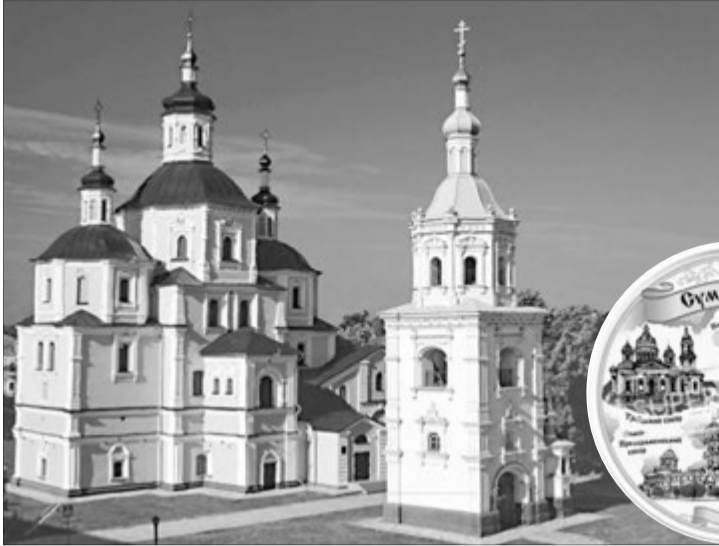
Воскресенський собор у Сумах початку XVIII століття. Козацькі церкви величні та елегантні водночас.