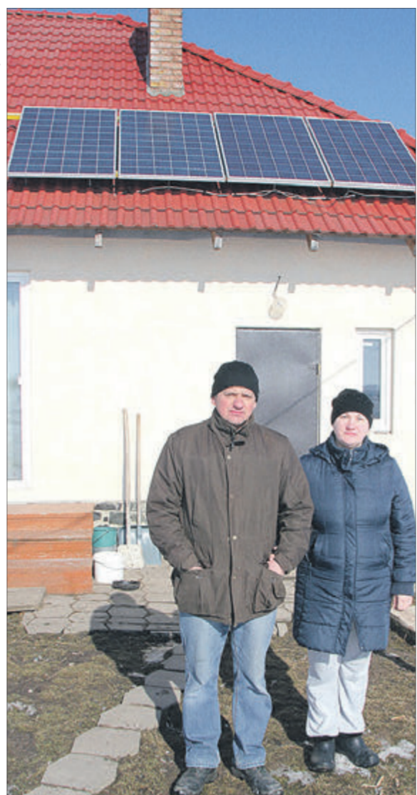
Багатодітне подружжя чимало коштів витрачає із сімейного бюджету, щоб все ж забезпечити освітлення житла.