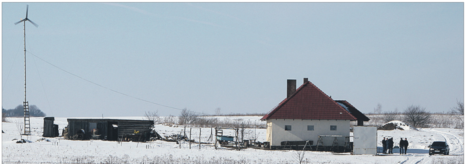
Обійстя Сахнюків має незвичайний орієнтир — вітрячок.