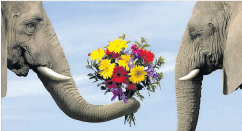
Зі святом, кохана!