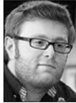
Богдан БУТКЕВИЧ, журналіст, блогер, ведучий на телеканалі «ЕСПРЕСО TV» (м. Київ):

вить увага чоловіка, синів, друзів: це так приємно і ніколи ще не було зайвим. Пам'ятаю з дитинства свій і мамин тюльпани від тата... Іноді саме суспільна традиція допомагає людині вчитися робити іншу щасливо!