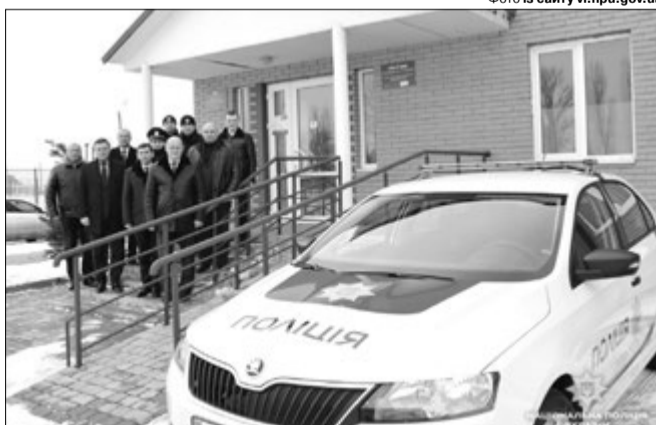
Таких поліцейських дільниць на Волині буде 38.

До Боратинської об'єднаної територіальної громади належить 12 населених пунктів. Вона охоплює територію площею понад 90 квадратних кілометрів, де мешкає 8,5 тисячі жителів. Поліцейську дільницю обладнали доступом до інтернет-мережі, бази даних МВС, передбачили кімнати для роботи працівників ювенальної превенції, дільничних офіцерів, співробітників груп швидкого реагування патрульної поліції, а також представників гро-