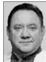
Богдан БЕНЮК, народний артист України (м. Київ):

— Я не проти, аби оголосити вихідним 9 березня, але це зовсім інші речі: Міжнародний день права жінок і миру та день народження Тараса Шевченка, якого ми шануємо, вивчаємо, прислухаємося до його пророчих слів. Справа в тому, що протягом багатьох десятиліть це було суто жіноче свято: матерів, дружин, доньок, дівчат. Сьогодні у суспільстві є багато думок із приводу так званих радянських свят, від яких відхрещемося. Хоча би раз у рік ми повинні з шанобливістю згадувати про жінок, які працюють нарівні з чоловіками. Бути жінкою надзвичайно важко, оскільки вони є берегинями домашнього затишку, і на роботі мають проявити професійні якості, до того ж, треба гарно виглядати і скрізь встигати. Вважаю, що жінки заслуговують подяки, пошанування і люблячого слова.