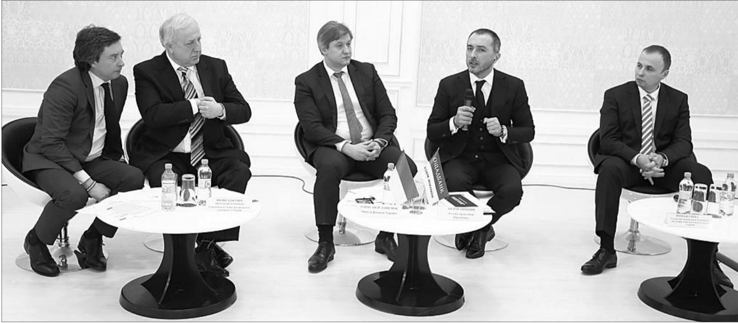
Плани на 2022-й рік — грандіозні!