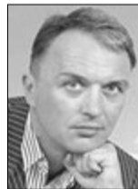
Ігор ЛАПІН, народний депутат України (м. Луцьк):

— Вважаю, що і 8, і 9 березня мають бути звичайними робочими днями. У нас в Україні достатньо вихідних. Саме жіноче свято я не відзначаю й закликаю інших від нього відмовитися. Щодо 9 березня, то Тараса Шевченка потрібно читати й знати, а не святкувати його день народження. У мене є власна пропозиція — давайте зробимо офіційним державним вихідним День матері. Це буде знак поваги та шани до жінок, котрі народжують і виховують дітей.