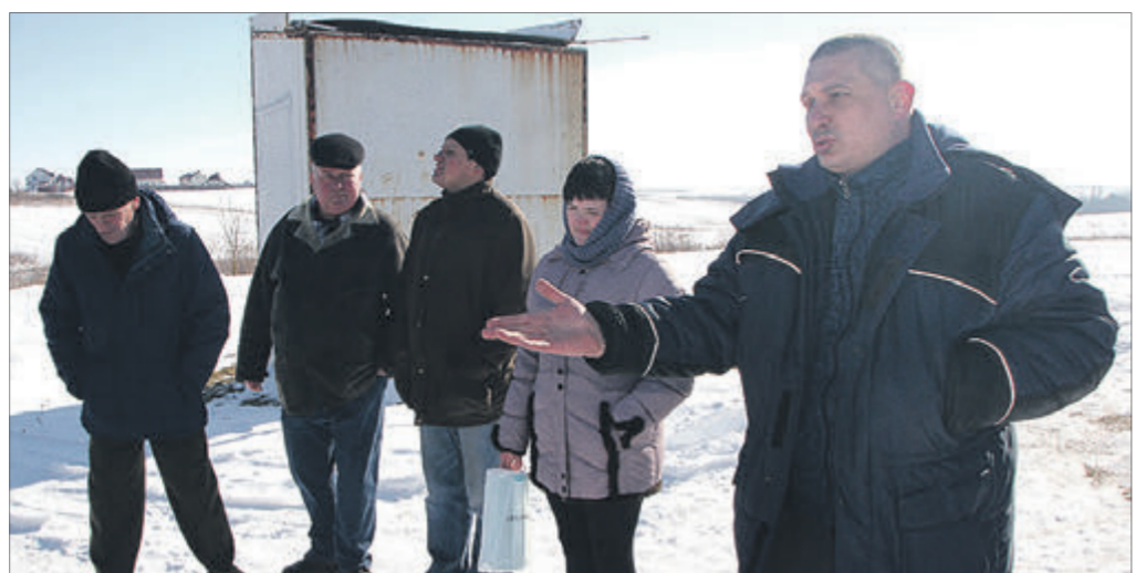
Люди хочуть почути від сільського голови (на фото зліва) якусь пораду, знайти в його особі підтримку.