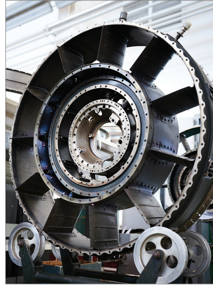
Щоб мати можливість сьогодні показувати такі вражаючі фото, «моторцям» довелося вкласти багато зусиль і коштів, аби самостійно опанувати виготовлення деталей для ремонту двигунів. Адже за радянських часів їх бачити було проблем купувати в Росії.

мікроплазмову наплавку? А про зміцнення деталей за допомогою «бомбардування поверхні мікрокульками»? А електронний мікроскоп бачили? А ми і почули, і побачили. Нам показали просторі унікальні (і дивовижно чисті та охайні) цехи з розбирання й збирання двигунів та агрегатів, дільниці, де привітні симпатичні жінки у білих халатах та білих бавовняних рукавичках у лупу оглядають кожний міліметр деталей, щоб пересвідчитися у відсутності найменших дефектів. Ми захопили у грандіозні за розмірами бокси випробувальної станції авіаційних двигунів, де кожен відремонтований двигун повинен відпрацювати тестову програму в умовах набагато складніших, ніж на реальному літаку. Усе задля того, щоб лучський «Мотор» радував своїм гудінням, нечутним для міста, звичним для колективу у дуже важливим для держави. Запитую, чи така ж картина й на інших авіазаводах. Мої гіді усміхаються, а тоді кажуть: — Складно порівнювати! Яка