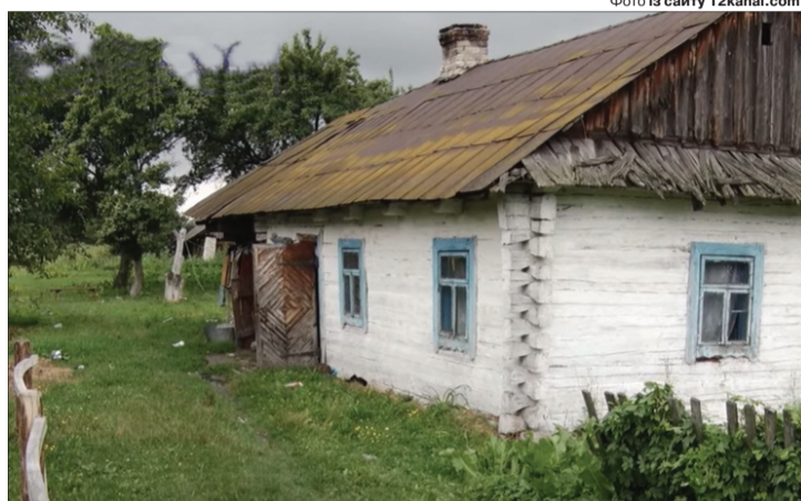
У хаті, де живе сім'я з малолітньою донькою, — ні світла, ні підлоги.