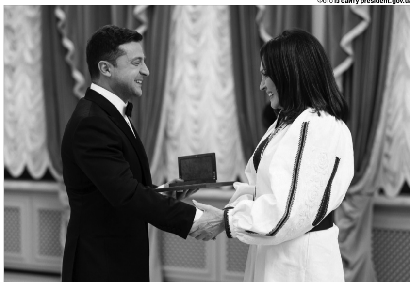
Зеленський нагороджує Ротару, яка під час війни з Росією спокійно собі виступає в країні-агресорі. Бо вони живуть за принципом «какая разница».

Плюс гігантоманія. Усі ці найвищі флагштоки. Або не потрібний — на думку авторитетних діячів — Великий герб. Усе яскраве і «велике», навколо якого можна створювати багато шуму. Десь, певно, виправдане, десь — ні. Але в сухому залишку це лише піар, у якому пред-