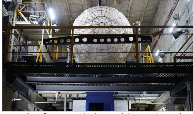
Випробувальна станція авіадвигуна імітує реальні умови літака.