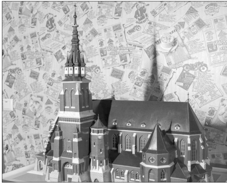
Таким був костел, який будували за пожертвування громади.