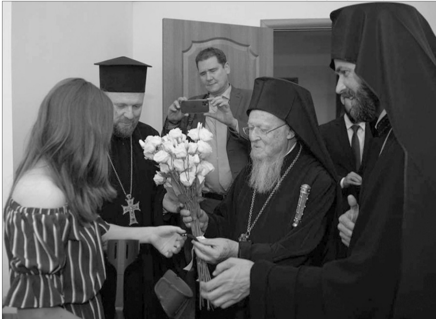
13-літня українка отримала благословення від Його Всесвятості Варфоломія I.