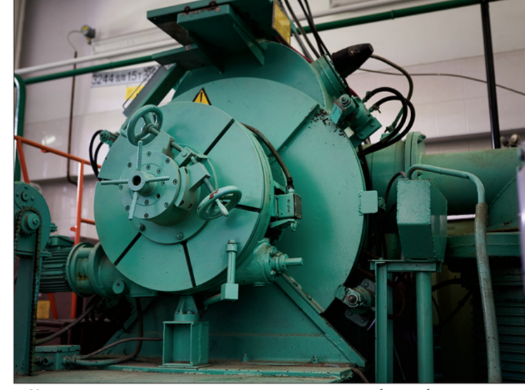
Устаткування на кшталт отакого є результатом співпраці з науковцями українських інститутів!