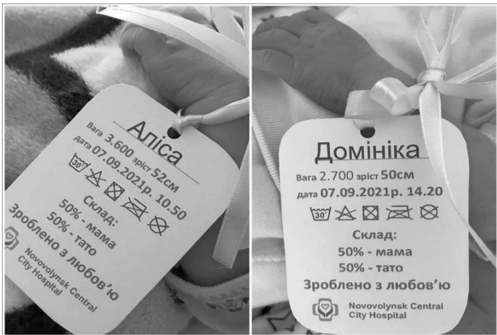
Фото з фейсбук-сторінки Нововолинської міської лікарні.