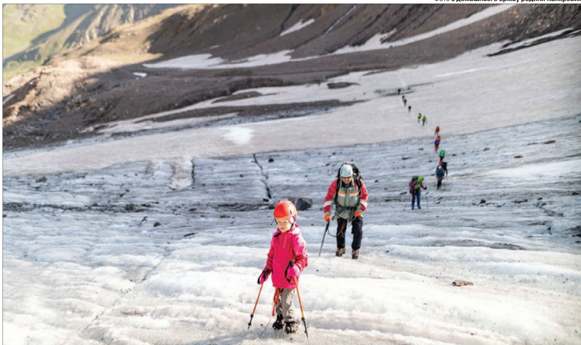
Фото з домашнього архіву родини Канкрових.

Похід у високі гори не всі дорослі витримують.