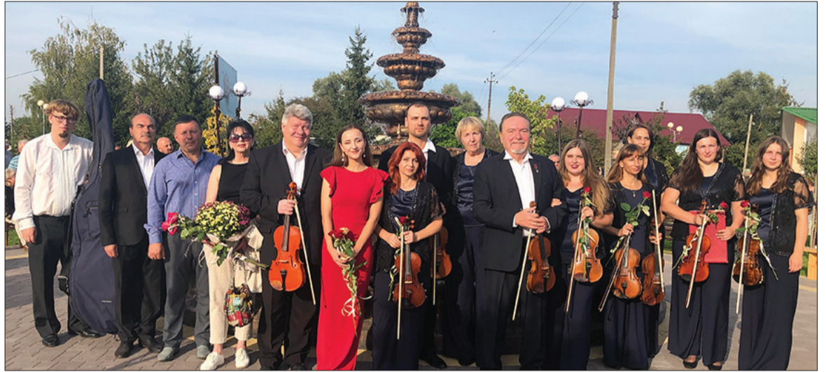
Про свято музики біля місцевого водограю ще довго будуть згадувати горохівчани.