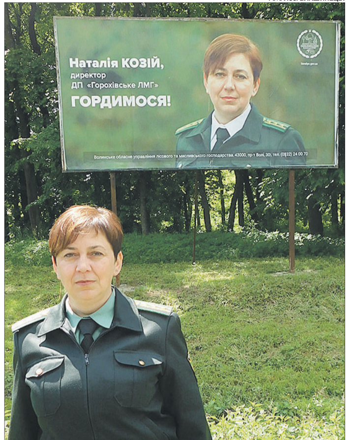
Білборд біля терешківського лісу повідомляє, що у ДП «Горохівське ЛМГ» господарює вродлива і дбайлива жінка.