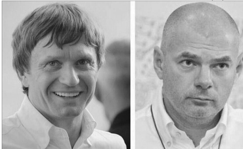
Обоє прогульників входять до депутатської групи «Партія «За майбутнє».

«Частина народних обранців безвідповідально ставляться до своїх депутатських обов'язків, ігноруючи абсолютну більшість голосувань Верховної Ради. Відмова від голосувань також стала формою саботажу роботи ВР з боку окремих парламентських фракцій. По-