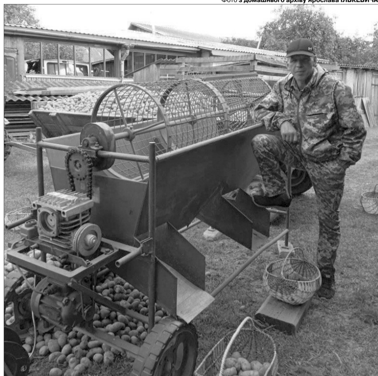
Чоловік придбав сортувальню з найпростіших, однак її потужності вистачає.

Ідеєю остаточно полегшити процес збору й упорядкування