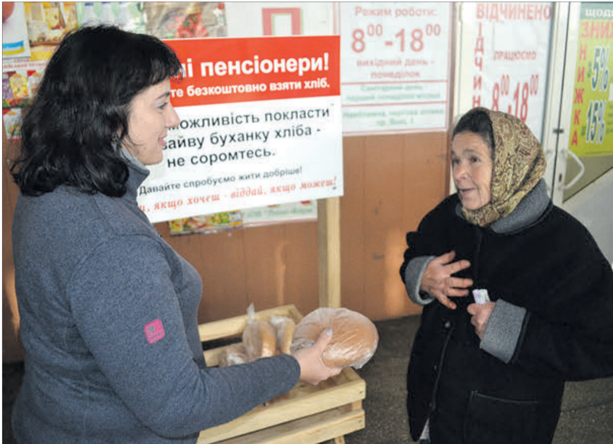
«Я вам щиро дякую за вашу доброту...»