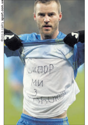
Так Андрій Ярмоленко підтримав травмованого Сергія Сидорчука. Зауважте — українською.

Україна: Андрій П'ятов (Максим Коваль, 46 хв.), Едуард Соболь, Євген Хачеріді (Артем Шабанов, 81 хв.), Іван Ордець, Марлос (Олександр Андрієвський, 77 хв.), Руслан Ротань, Євген Коноплянка (Сергій Мякушко, 89 хв.), Олександр Караваєв (Богдан Бутко, 63 хв.), Руслан Малиновський (Євген Шахов, 81 хв.), Андрій Ярмоленко, Юрій Коломоєць. Головний тренер Андрій Шевченко.