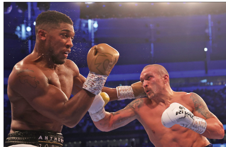
Удар — і ціла купа боксерських поясів їде в Україну!

Нагадаємо, Саша робив неоднозначні політичні заяви та відомий своєю близькістю до Російської православної церкви. Це активно використовує кремлівська пропаганда. Будемо сподіватися, що надалі наш боксер даватиме набагато