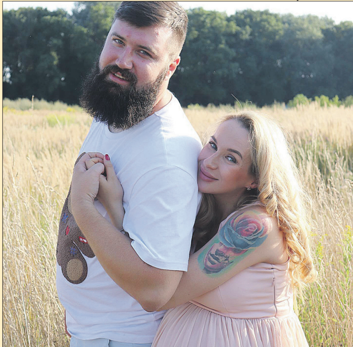
Багатодітного батька можуть позбавити шансу на щасливе життя із дружиною і дітьми.