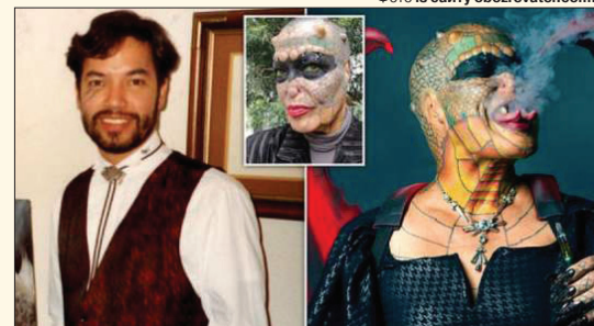
Був же нормальною людиною, і що стало...

(щоб бути «першим та єдиним безстатевим драконом у світі») і зубів, які у нього ще залишилися. Також він планує імплантувати собі роги й розраховує після всього цього зустріти своє кохання, проживши 12 років на самоті.