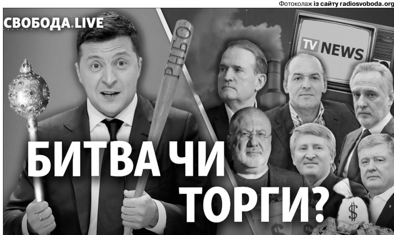
Тепер головним олігархом буде Володимир Олександрович. А хто не згоден — того розглянуть на засіданні ЦК, ой, — РНБО.

Падлюки. І чи то тільки в Житомирі так промишляють?