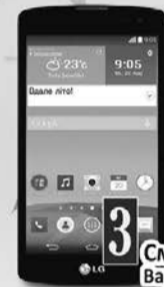
Смартфон LG Вартість – 5 000 грн