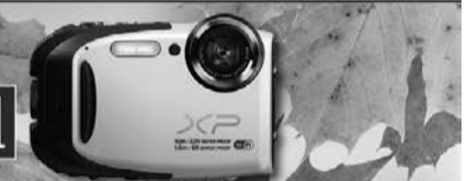
Фотоапарат Fujifilm Вартість – 3 000 грн

*Маркетингова акція проводиться з 17.12.2020 р. по 28.12.2021 р. на всій території України, окрім тимчасово окупованих територій. Результат маркетингової акції буде визначений 28.12.2021 р. Детально про умови маркетингової акції та місце її проведення Ви дізнаєтеся з окремого листа. Призовий фонд маркетингової акції складає 277 000 гривень (у даному макеті представлений у вигляді телевізора, смартфона, планшета, організатор залишає за собою право вибору між врученням грошового і речового приза). Дана маркетингова акція не є розіграшем, лотереєю, грою (в тому числі азартною або іншим заходом, заснованим на ризикі), конкурсом або публічною обіркою винагороди без оголошення конкурсу у розумінні Глави 78 Цивільного кодексу України. Зателефонувавши клієнт дає згоду на подальше використання компанією та партнерами його персональної інформації, таку згоду можливо відкликати будь-якої миті. Телефон для довідок: (044) 299-55-83 (вартість послуги згідно з тарифами Вашого оператора). ТІЛЬКИ ДЛЯ ПОВНОЛІТНІХ. **Мається на увазі реєстрація участі в маркетинговій акції.