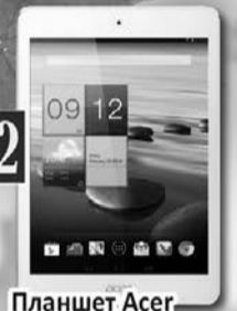
Планшет Acer Вартість – 3 500 грн