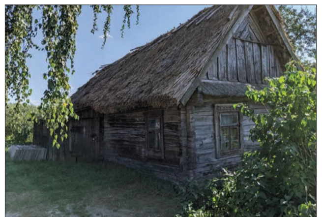
У хаті з таким дахом взимку тепло, а влітку прохолодно.

«Я ж для вас навіть одягнувся красиво, бо думав тут будете жити. У нас хоч велика різниця у віці, але я ж і юшку вмю зварити, і живність тримаю».