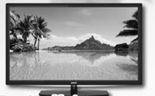
Телевізор Mystery Вартість – 7 500 грн