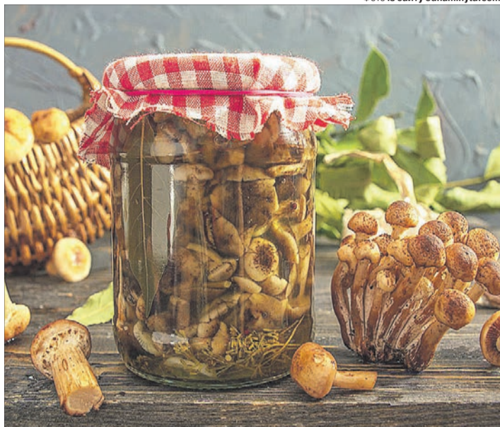
Добре вродили опеньки — буде врожай жита наступного року.

Приготування. Опеньки перебрані, помиті, відварити, охолодити і нарізати