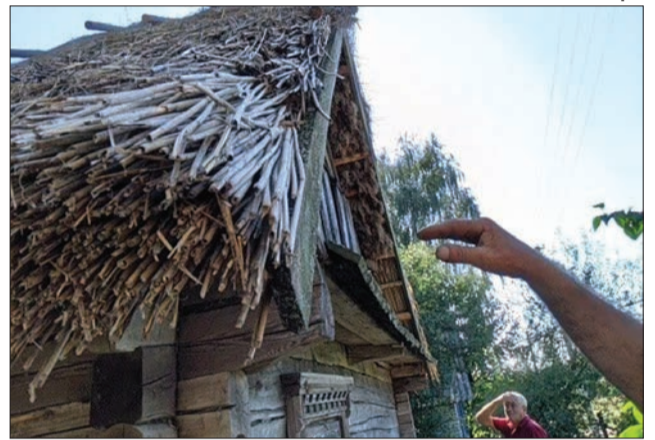
Щоб очерет не псувався, його треба добре просушити.