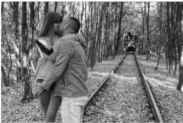
Закохані кажуть, що таким чином борються з кризою в стосунках.

Чоловік вирішив оригінально вийти із ситуації після сварки з обраницею й влаштував романтичний сюрприз. У Тунелі кохання він орендував потяг, аби покататися із судженою й зробити на пам'ять фото. А щоб насолодитися побаченням, дітей залишили на бабусю.