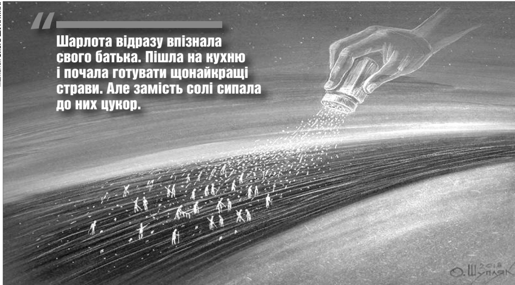
Картина «Сіль землі» (2018) тернопільського художника Олега Шупляка.

Шарлота відразу впізнала свого батька. Пішла на кухню і почала готувати щонайкращі страви. Але замість солі сипала до них цукор.