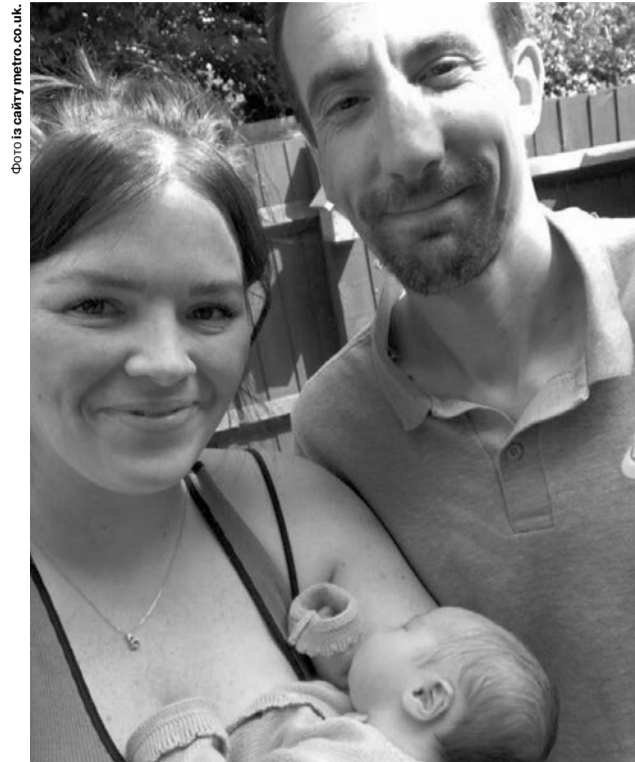
«Ось такий несподіваний подарунок нам піднесла вечірка!»

— Пробач, мамочко! Я тільки там зрозуміла, що мала все для щастя. Як довго я шукала свій рід, свою родину. А воно ж у мене все було. Було, мамо. Лиш я не розуміла.