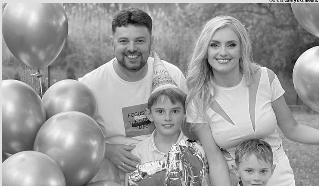
«Друге весілля зіграли. Тепер народимо третю дитину?!»

«По-перше, це дійсно кохання, тому що воно все стерпить, все витримає. Звичайно, вміння пробачати, вміння інколи стерпіти. Відчути той момент, коли краще змовчати, а коли вже ти розумієш, що все гаразд, — тоді вже можна поспілкуватися спокійно. У будь-якому випадку мінімум порахувати до 10, коли ти відчуваєш, що закипаєш», — поділилася зірка.