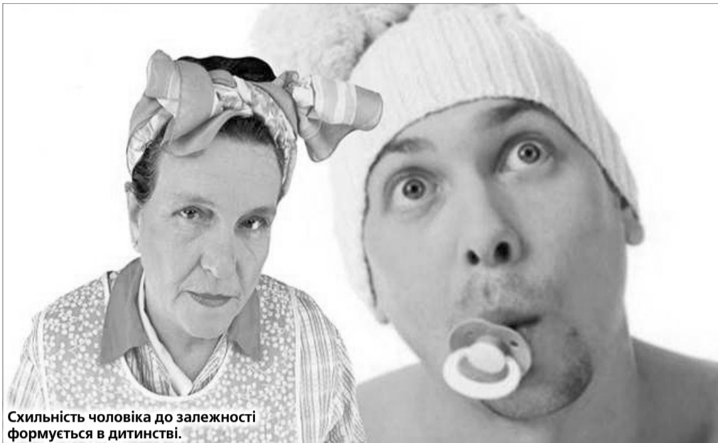
Схильність чоловіка до залежності формується в дитинстві.

Порада матусям хлопчиків: схильність чоловіка до залежності формується в дитинстві. Найчастіше через те, що занижували його самооцінку, не підтримували в починаннях і, найважливіше, не довіряли та повністю контролювали. Уникайте цього і ваш син виросте справжнім чоловіком.