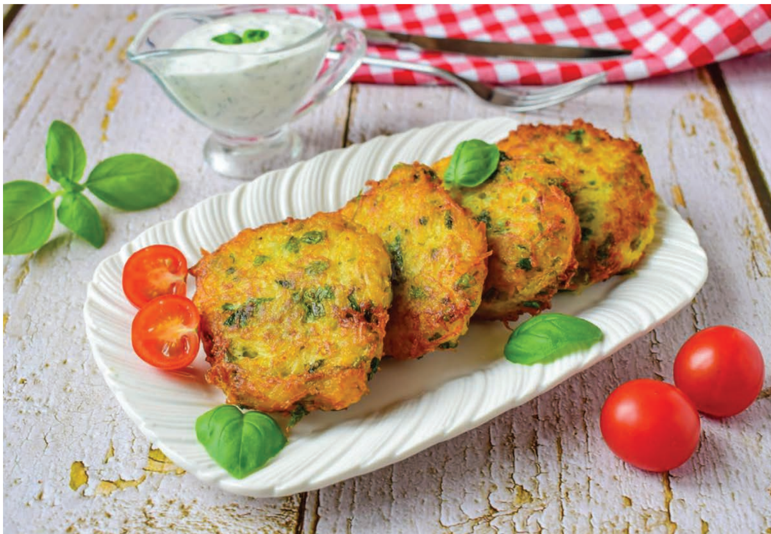
Як же апетитно виглядає!