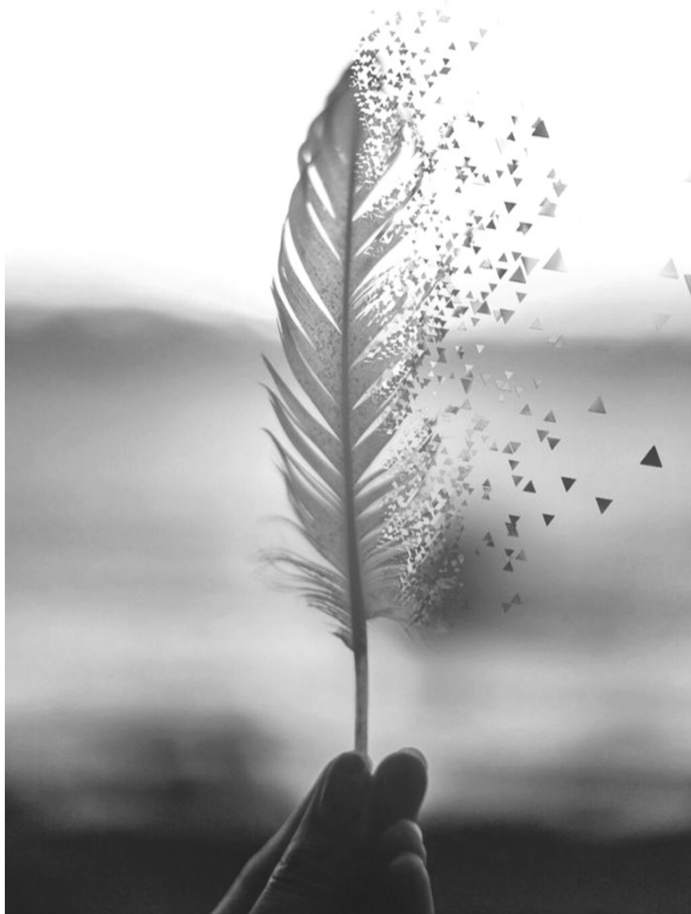
«Дякую за подарунок, любий ангелику...»

Тож гуляла парком і подумки писала історію. Найдовша алея була майже порожня. Затінку тут не було. І раптом... маленька пір'інка кружляла в гарячому