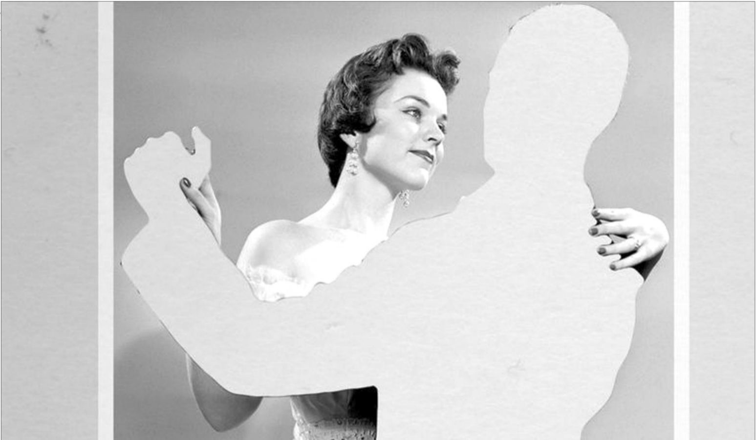
Намагаючись розірвати стосунки, люди іноді поводяться не дуже гарно: вони можуть почати ігнорувати партнера, не пояснивши йому, що відбувається.