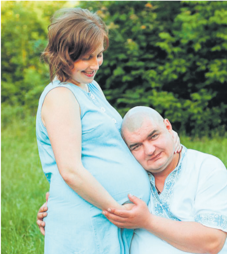
Щасливі миті в очікуванні донечок.