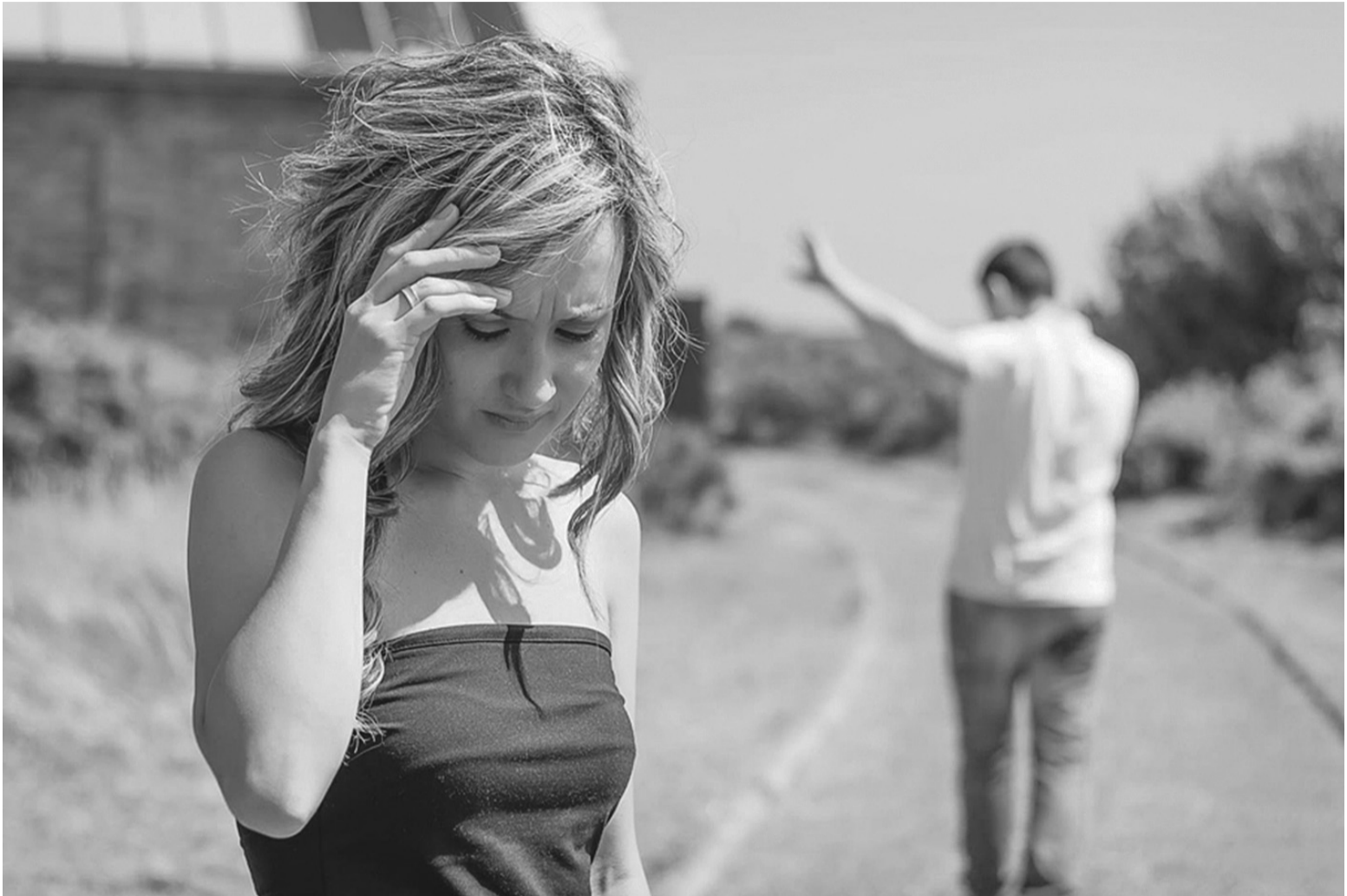
Чому чоловіки люблять топтати дівочий цвіт, але шукають цнотливих наречених?