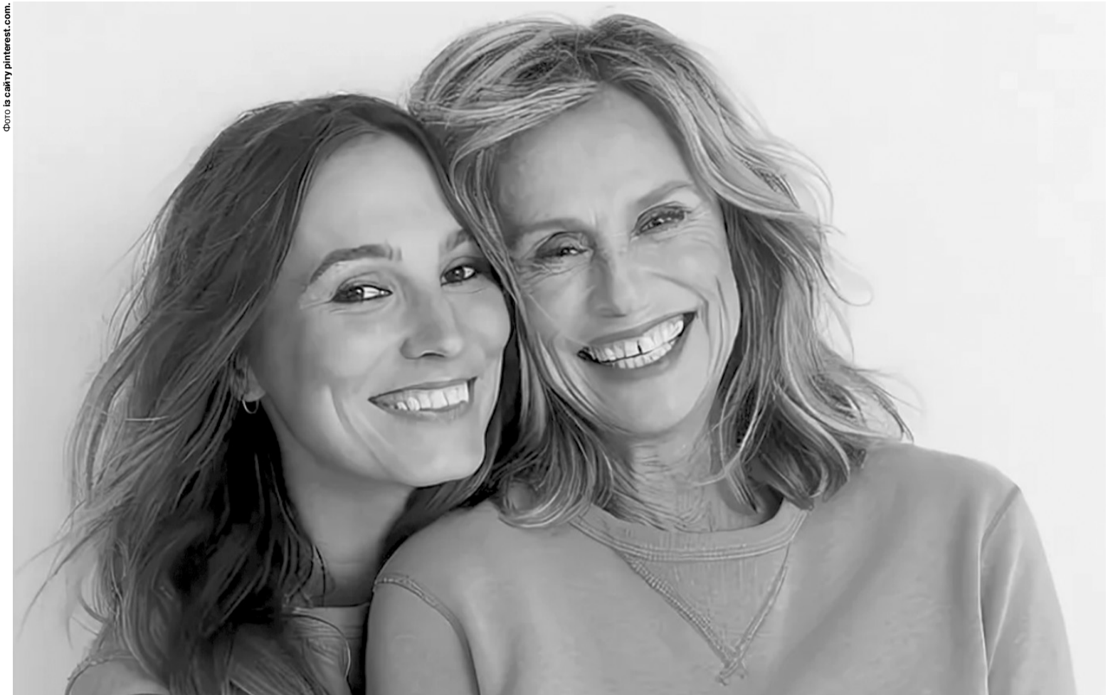
«Як довго я шукала свій рід, свою родину. А воно ж у мене все було...»