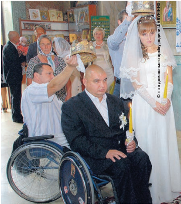
День, коли подружжя дало обітницю бути разом у радості й горі до кінця днів своїх.