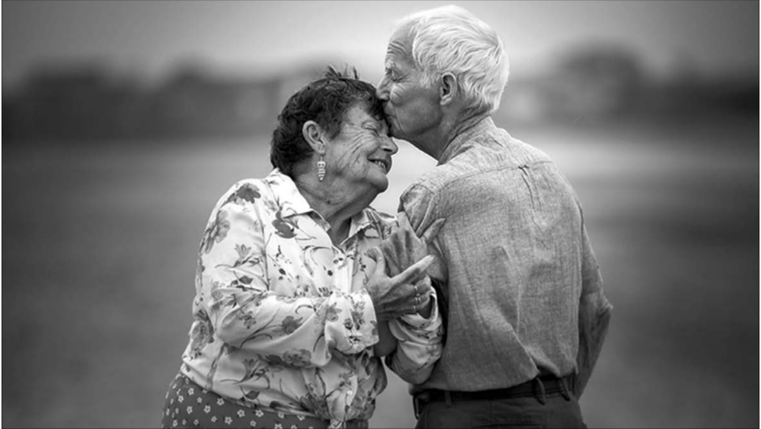
«Ич, закортіло старому азарту, Ви ж подивіться – потилиця лиса!».