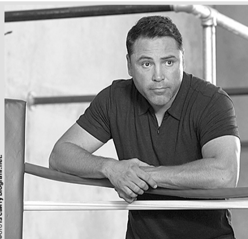
«Людина здатна приховувати багато що. Але ця штука досі болить...»

Зазначимо, що 11 вересня Де Ла Хоя вперше з 2008 року вийде на ринг. «Золотий хлопчик» зустрінеться у бою з экс-