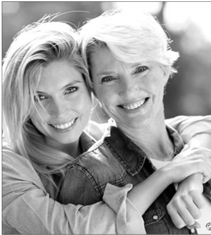
Як дві краплі води...

— А тоді, — Тала по-змовницьки підморгнула мені, — нарешті настає протрете, і це найважливіше. Твоя мати стане матір'ю твоєї дитини, а ти будеш їй сестрою.