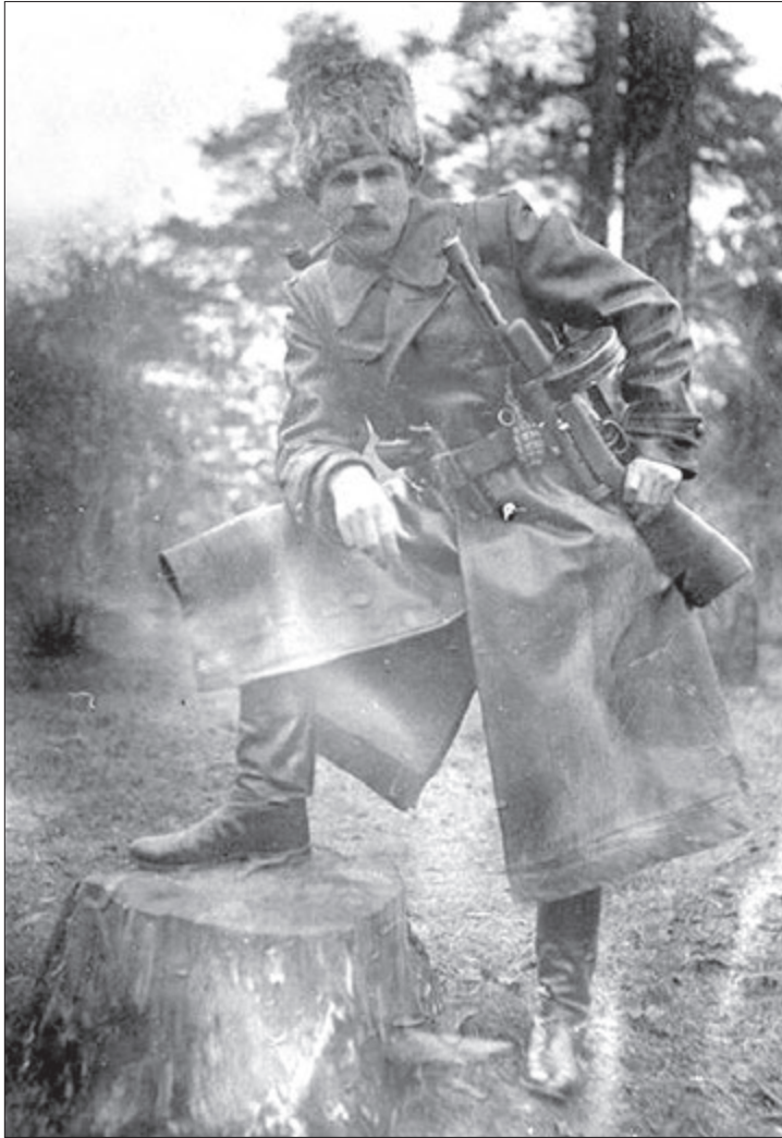
Так виглядав лісовий отаман у 1942 році.

Серед бійців «Поліської Січі», вочевидь, знайшлися