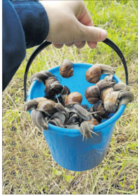
Правда, вражаюче?! І займатися цією справою ви можете у себе вдома.