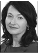
Ірина КОНСТАНКЕВИЧ, народний депутат України (м. Луцьк):

Що ж до згаданих поправок, то ними також передбачається, що з 15 березня будь-які судові експертизи у кримінальному процесі можуть призначатися тільки судом. Чинне законодавство справді говорить, що за фактом смерті в кожному випадку призначається експертиза, і так сталося, що тепер такі експертизи — за клопотанням слідчого — може призначити лише суд. На це він має 72 години. Цілком можливо, що вистачить і 5 хвилин. А може бути таке, що, наприклад, о сьомій вечора надійшло клопотання від слідчого, а судді нема, — чергові судді є не в кожному суді. Тому це створює потенційну загрозу. Чи буде вона такою, як її змальовують у деяких ЗМІ? Не доведи, Господи... У ситуацію має втрутитися Верховна Рада і скасувати зміни про обов'язкове призначення експертизи тільки судом. Якщо це станеться сьогодні, у четвер, то, гадаю, Президент одразу ж їх має підписати.