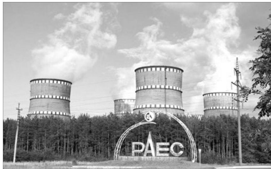
Називається Рівненська, хоча розташована на самому кордоні з Волинською областю.

Зазначимо, що на Рівненській АЕС — чотири енергоблоки. Останній, четвертий, запрацював у 2004 році, три інші діють з радянських часів. Загалом в Україні працюють чотири атомні електростанції: окрім Рівненської АЕС у Вараші, ще є Хмельницька у Нетішині, Запорізька в Енергодарі та Південноукраїнська у місті Южноукраїнськ Миколаївської області. З 2014-го, коли виробництво електроенергії теплоелектростанціями різко впало через окупацію вугільних районів Донецької та Луганської областей, відсоток електроенергії, виробленої на АЕС, значно зріс. Чотири АЕС останніми