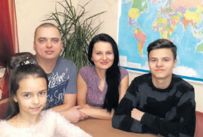
Подружжя дуже дорожить митями, коли вони усі разом.

реження сім'ї (з одними зустрічаються, як відомо, а з іншими одружуються).