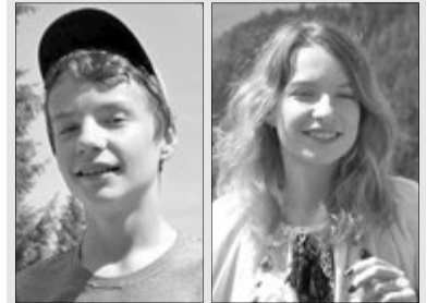
Подвійна гордість сім'ї Торчили.