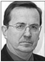
Володимир КАРПУК, народний депутат України V та VI скликань (м. Луцьк):

суального кодексу. Моргі патологоанатомічного бюро розраховані лише на тих, хто перебував у державних лікувальних закладах. Тільки у 8 районах на Волині є лікарі-патологоанатоми, відповідний персонал. Не знаю, що можна порадити жителям області. Можливо,десь у великих містах є якісь приватні ритуальні служби зі спеціальними холодильними камерами, але в Луцьку я про таке не чув. Жодних роз'яснень із Міністерства щодо дій патологоанатомічної служби нам не надходило. Мені важко сказати, задля чого наш парламент приймає недолугі закони. Зрозуміло одне: ніхто не задумується, чим це обернеться для людей.