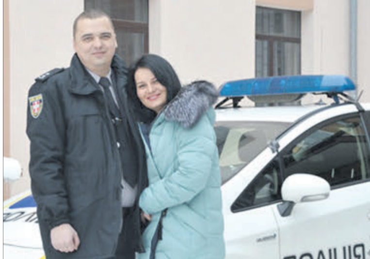
Закохані, як і 15 років тому.