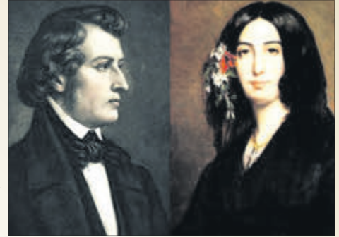
Період життя із Жорж Санд був найплідотворнішим для Шопена.

Він був поляком, романтиком, мрійником і композитором — автором вальсів, фортепіанних концертів