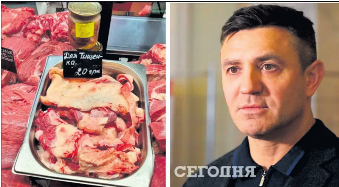
По 20 гривень депутату пропонують м'ясні обрізки з плівкою та жилами, які зазвичай купують тваринам.