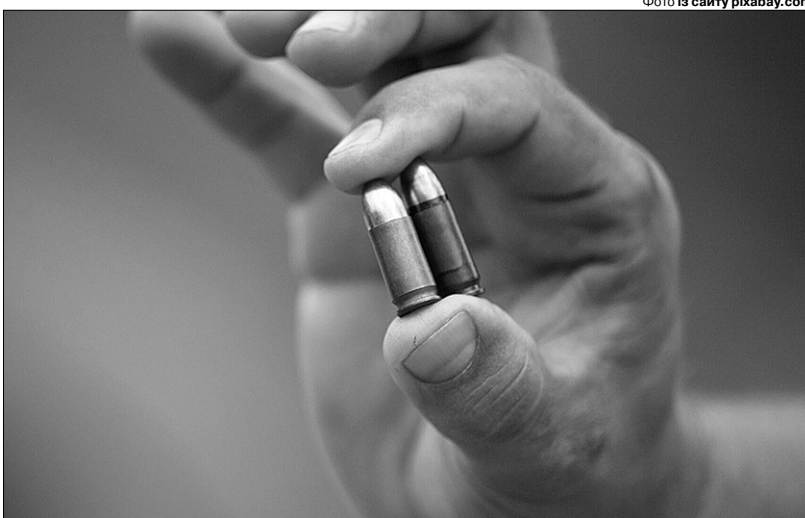
«Нападники запанікували і вистрелили в нього».