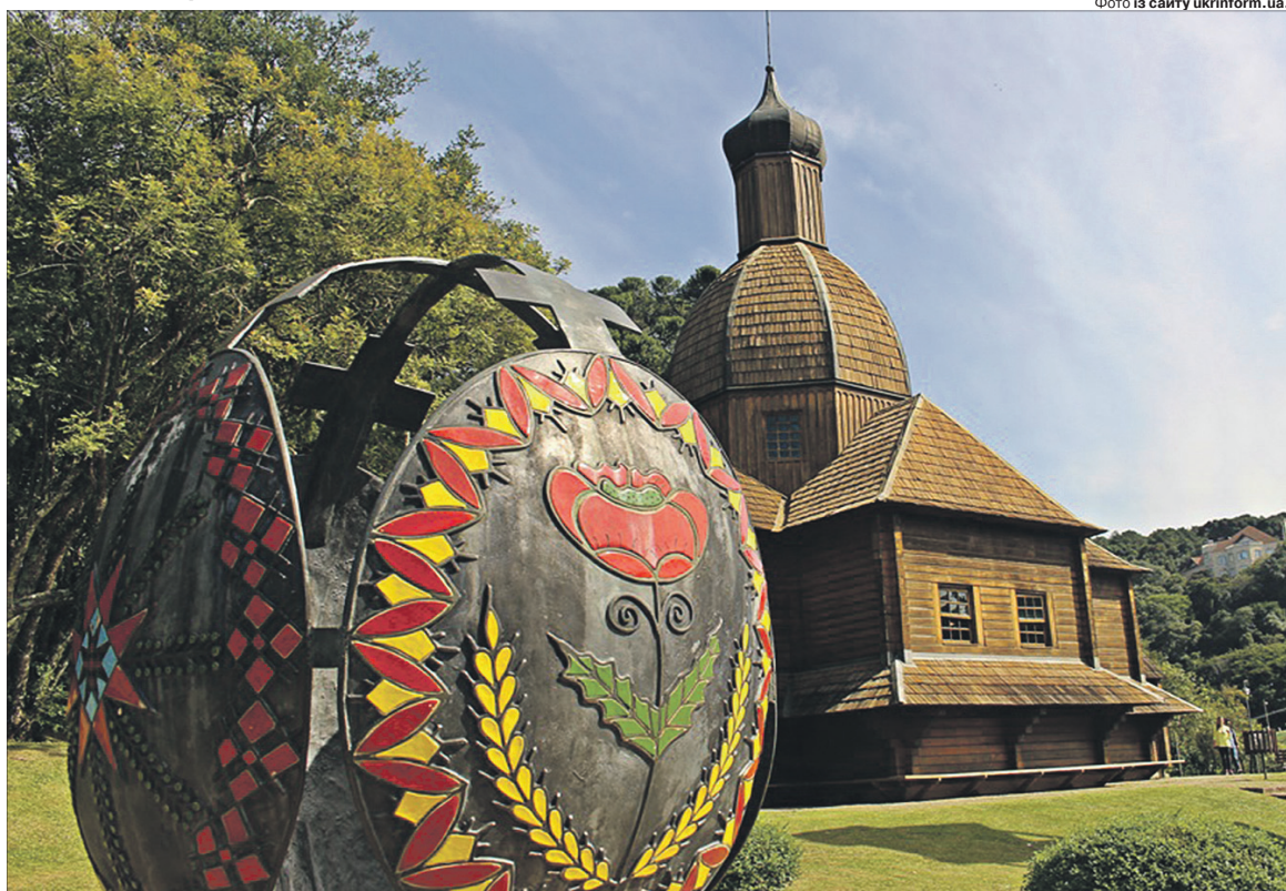
Пам'ятник писанці на Меморіалі української імміграції в місті Куритиба — столиці штату Парана.