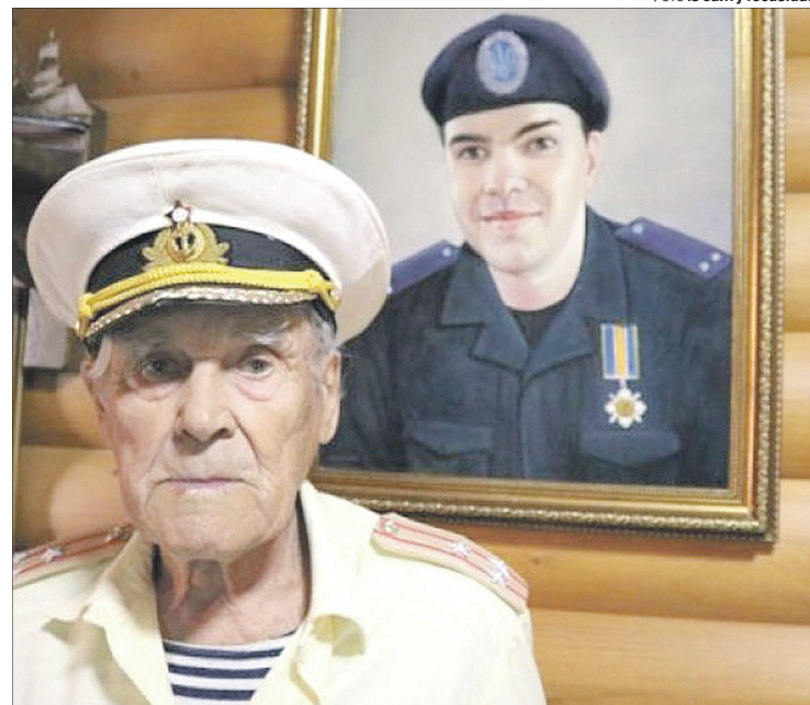
Дід захищав Україну в Другу світову, а онук — у війні з Росією.