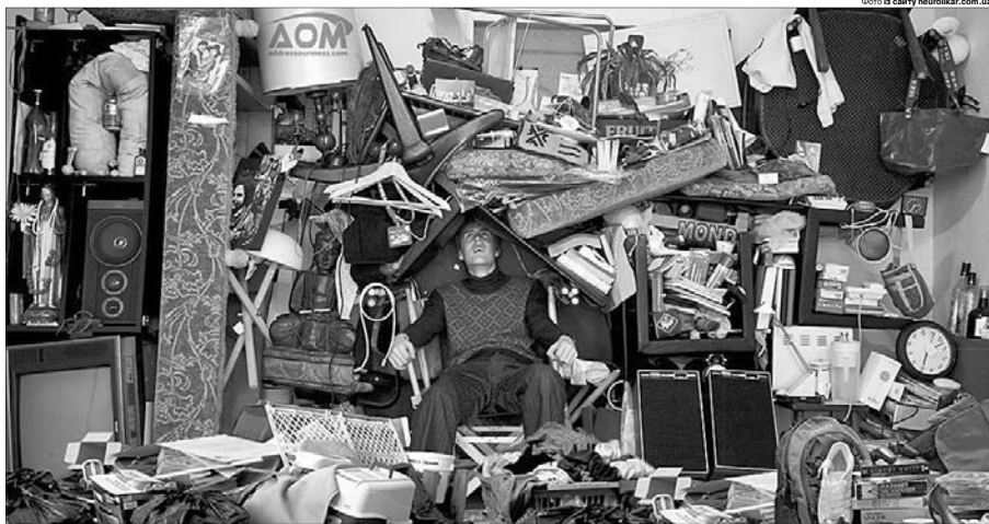
«А може, колись згодиться», — з цього починається патологічне накопичення речей — серйозний розлад, який називається синдромом Плюшкіна.

У групі ризику перебувають люди, родичі яких мали порушення психіки, фобії, біполярні розлади, депресію, різні форми психопатії. Даються взнаки й органічні захворювання центральної нервової системи, головного мозку, травми голови, хронічний алкоголізм, деменція або старече недоумство.