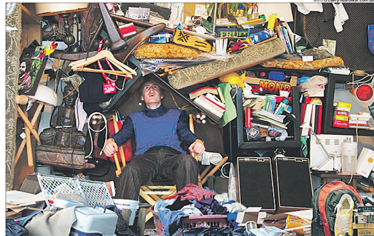
Звичка накопичувати непотрібні речі може перерости у залежність — серйозний розлад, з яким неможливо справитися самотужки.