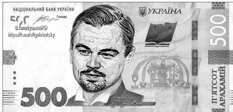
«Замінімо Сковороду на ді Капріо?» – «Легко!»