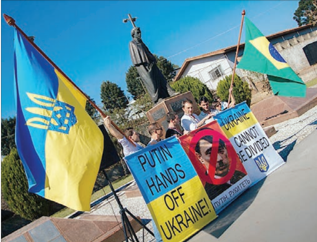
Акція протесту проти агресії Росії щодо України у 2014 році.