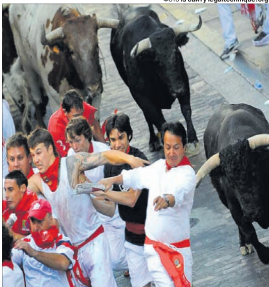
Ось так виглядає корида навпаки. Жесть!

Згідно із соціопитуваннями, за заборону цієї національної традиції виступають 46,7% іспанців.