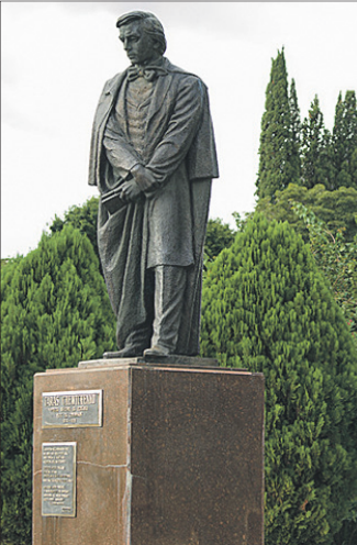
Пам'ятник Тарасу Шевченку в Прудентополісі авторства Лео Мола (Леоніда Молодожанина).