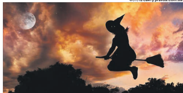
Цікаво, що знаки, які вказували на причетність жінки до «чаклунства» — мітли, котли, чорні коти й загострені чорні капелюшки — насправді були пов'язані... з пивоварінням. Мітли — сигнал для покупців, що є пиво; у котлі його, відповідно, варили; коти ловили мишей, які їли зерно; а капелюшки були товарним знаком продавчинь хмільного напою.