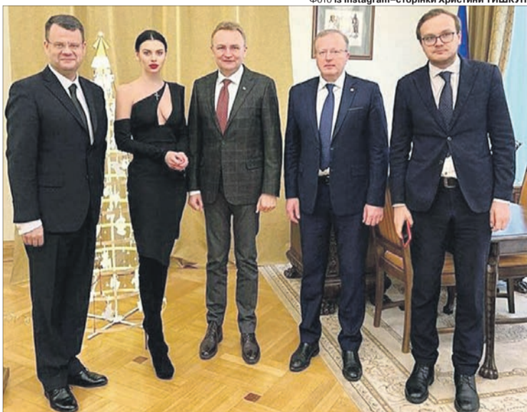
Напевне, це найкумедніше фото 2021 року. Якщо маєте кращий варіант, напишіть: tsikava.gazeta@gmail.com.