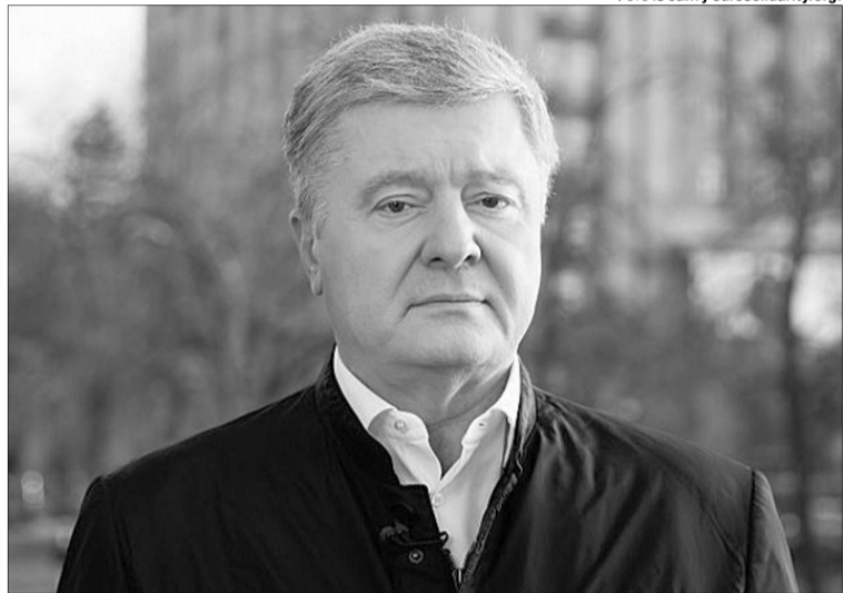
«Мені передають вітання з Офісу Президента про те, що вони з розумінням поставились би до того, якби я залишився у Європі. Хочу наголосити, що я не надам їм такого подарунку».

«Ми точно маємо сьогодні думати про державу, а не про власні рейтинги. Бо саме падінням рей-