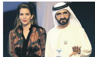
Вона довго змушена була усміхатись на камери разом із чоловіком-тираном.

Більшу частину суми буде використано на безпеку принцеси та її дітей від викрадення. Сюди також включені довічні витрати на утримання 14-річної дочки шейха Джалілі та дев'ятирічного сина Заєда. Йорданська принцеса Хайя, дочка покійного короля Йорданії Хуссейна та єдинокрівна сестра правлячого короля Абдалли II,