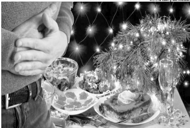
Магія новорічного свята не залежить від кількості страв і напоїв, вона — в атмосфері любові, тепла й радості у родині.

У багатьох людей відкладається в підсвідомості невдалий досвід попередніх святкувань: чи то вживання надмірної кількості спиртного, чи то сварка з родичами. Під впливом алкоголю зміню-