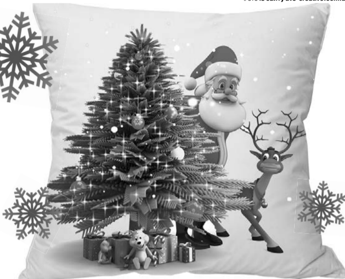
«У різдвяний час казки оживають».

— Як ти до такого додумалася?! — репетував. — Тій кривій качці мало місця в батьківській хаті? Думаєш, до неї принц прикульгає, якщо житиме окремо?