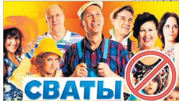
Російські танки заходять, як правило, після «Сватів».