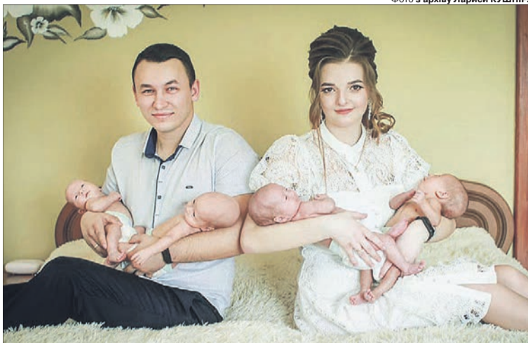
Трьох братиків і сестричку, які народились 5 січня, називають різдвяним дивом.