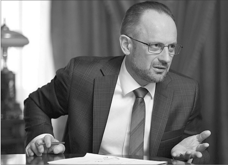
«Навколо Володимира Олександровича перебувають люди, які працюють в інтересах ворога».