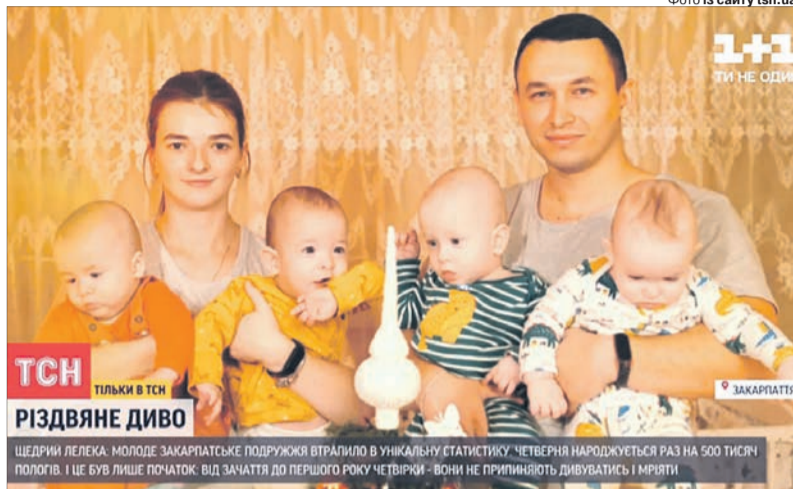
ЩЕДРИЙ ЛЕЛЕКА: МОЛОДЕ ЗАКАРПАТСЬКЕ ПОДРУЖЖЯ ВТРАПИЛО В УНІКАЛЬНУ СТАТИСТИКУ. ЧЕТВЕРНЯ НАРОДЖУЄТЬСЯ РІЗ НА 500 ТИСЯЧ ПОЛОГІВ. І ЦЕ БУВ ЛИШЕ ПОЧАТОК. ВІД ЗАЧАТТЯ ДО ПЕРШОГО РОКУ ЧЕТВІРКИ - ВОНИ НЕ ПРИЛИПАЮТЬ ДИВУВАТИСЬ І МРЯТИ