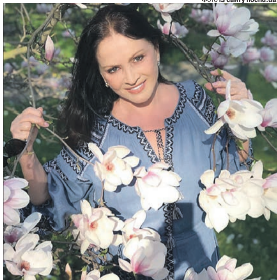
Дивлячись на це фото, важко повірити в реальний вік співачки, адже вона виглядає набагато молодшою.

За словами лікаря, у випадку з Ротару можна побачити «грамотний мікс», при якому «важка артилерія» пластики поєднується з більш делікатними