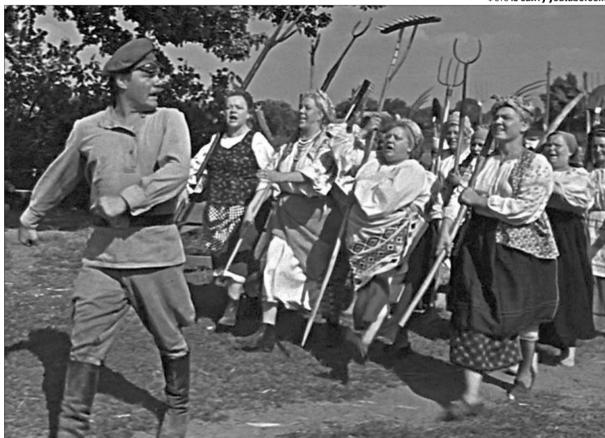
Ну як тут не згадати Яшку-артилериста з фільму «Весілля в Малинівці» (1967): «Ваші трьохдюдимові оченята шляхом прицільного попадання запалили вогнедихаючу пожежу в моєму серці. Словом, бац-бац — і в точку!»

«При зміні професії потрібно буде інформувати територіальний центр комп-