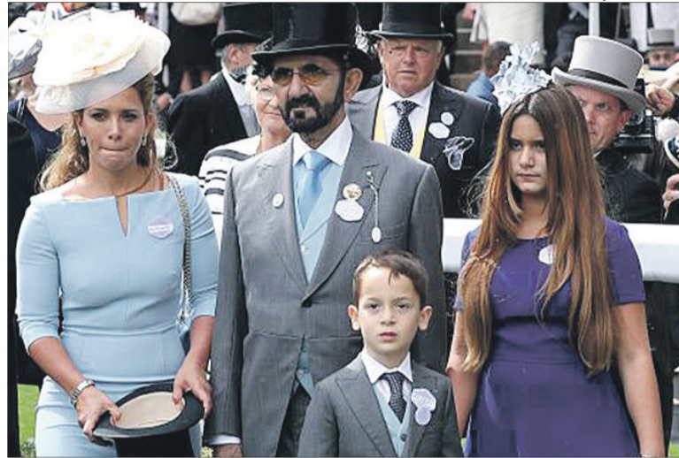
Принцеса Хайя і шейх Мохаммед з дітьми.