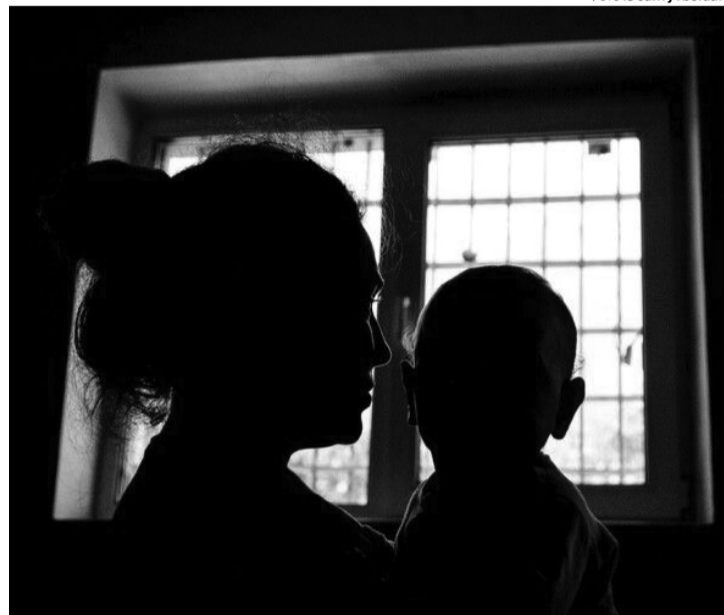
Дитина поряд з мамою, але язик не повернеться сказати, що початок життя в такій оселі — це добре.