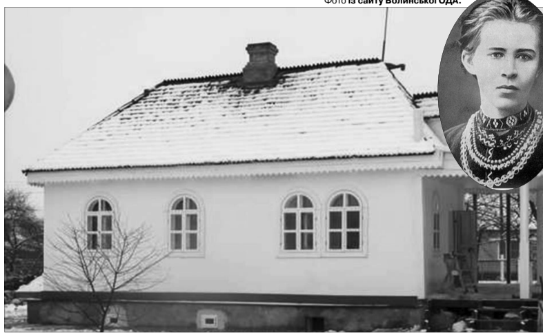
Нарешті багаторічні сподівання волинян здійснилися: родинне гніздо Лесі Українки відремонтовано, фахівці відновлюють інтер'єр «білого» і «сірого» будинків Косачів.