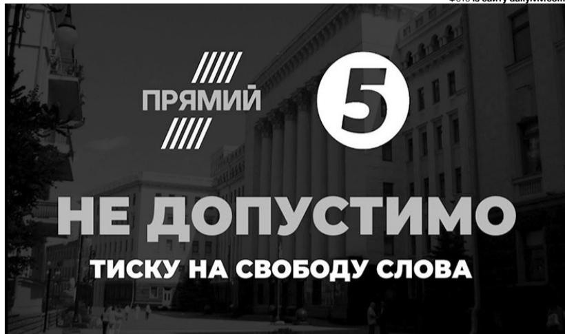
Таким рішенням нинішня влада хоче знищити опозиційні телеканали.