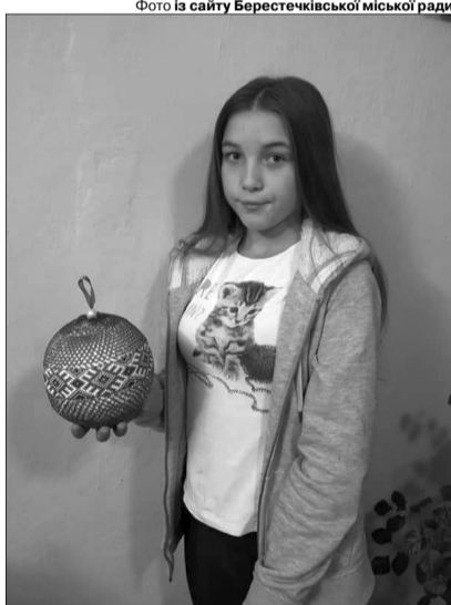
Фото із сайту Берестечківської міської ради.