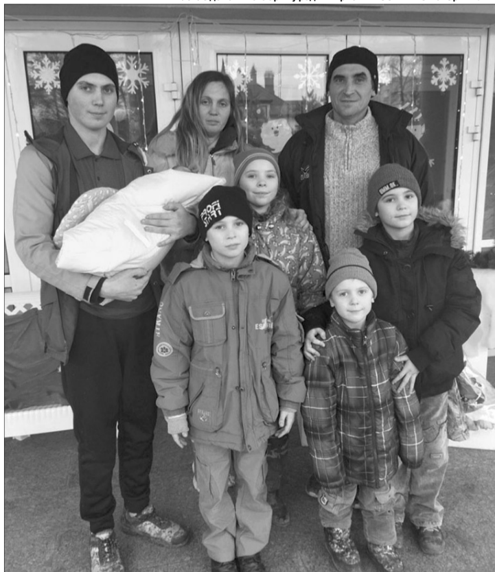
Різдвяні свята сімейство відзначає у повному складі.

логів, то заздалегідь одержала направлення у Волинський обласний перинатальний центр, де є відповідні спеціалісти, котрі надають допомогу у разі виникнення якогось ускладнення. Ось чому чоловік і повіз її в цей медичний заклад.