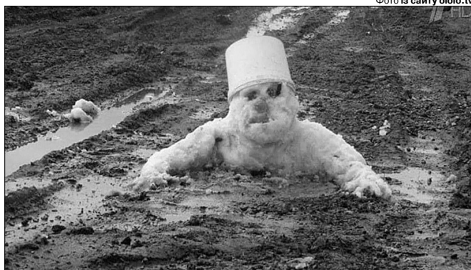
З такою погодою популяція сніговиків у нашому краї різко скоротиться.

січня також не варто очікувати сильних морозів. Щоправда, в середині цієї декади температура трохи знизиться. Невеликі опади посиляться на 1–2 дні.