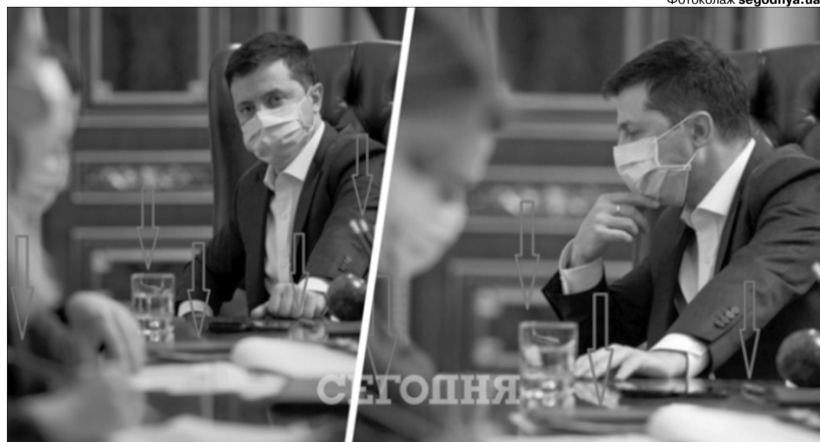
Світлини з розряду «Знайдіть 10 відмінностей».

Тобто Володимир Зеленський збрехав. Де він у той день був і що робив насправді — так і не ясно. У Facebook навіть з'явилися повідомлення, що Зеленський із дру-