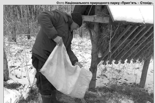
Фото Національного природного парку «Прип'ять – Стохід».

Зимової пори, коли настає морозна погода та утворюється сніговий покрив, дикі тварини потребують допомоги. Як і в попередні роки, працівники Ветлівського природоохоронного науково-дослідного відділення Національного природного парку «Прип'ять – Стохід» в урочищах Ковкиці, Пахове, Барщина організують підготовку лісових мешканців на спеціально створених майданчиках. Там вони розвішують заздалегідь підготовлені кормові віники, розкладають сіно та бадилля кукурудзи, розсипають зернові відходи.