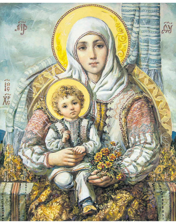
«Богородиця з Немовлям» – одна з ікон художника Олександра Охакіна, який зображає Богоматір, Ісуса, святих в українських костюмах. Це так звані неканонічні, «домашні ікони».