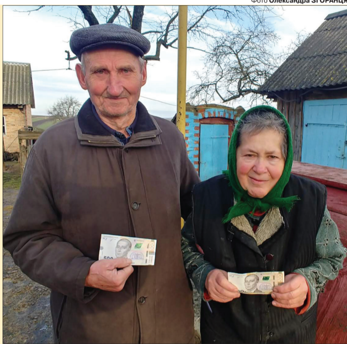
«Квитанцію ми посилали щороку, а виграли – вперше!»