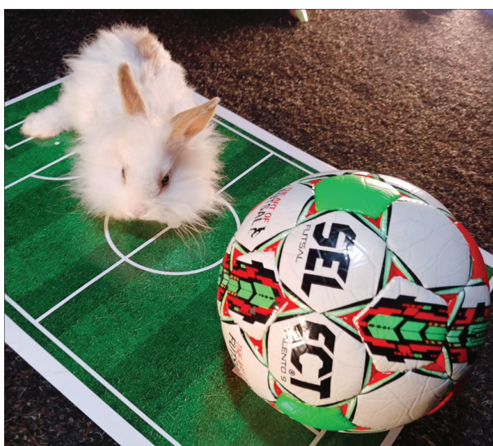
«Подаруйте мені менший м'ячик, а то «навішувати» важко!»