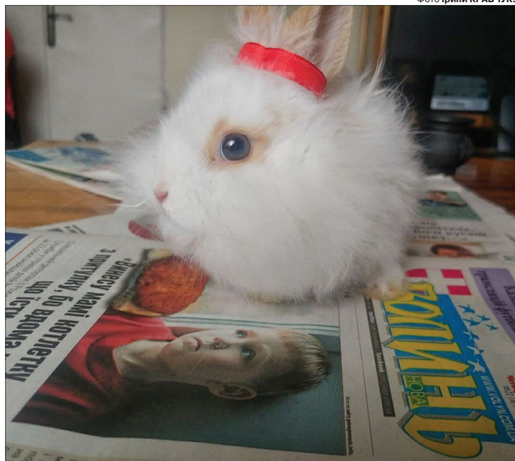
«Знову у номері сумні новини, хай би про мене написали!»