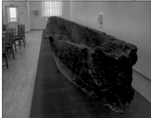
Археологічній знахідці створили належні умови для зберігання.

Відтепер цю незвичайну знахідку зможуть побачити всі охочі. Нещодавно в новозбудованому приміщенні відбулося відкриття експозиції та проведення круглого столу «Про стан та перспективи розвитку музею одного експоната «Маневичький човен-моноксил». З тим, аби відкрити експозицію, було розпочато реконструкцію Маневичького краєзнавчого музею. Згідно з проектно-кошторисною документацією вже виконано роботи більше як на мільйон гривень для подальшого збереження, музеєфікації пам'ятки та забезпечення належної презентації найбільшого та найдавнішого в Україні нововиявленого історико-культурного об'єкта підводної археології – середньовічного човна-довбанки. ■