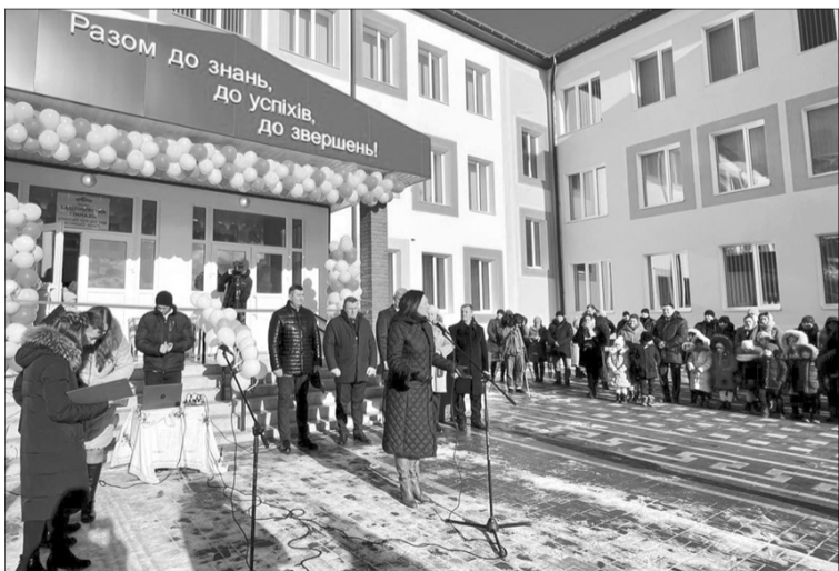
Відкриття школи у селі Башлики.

«Це сільська школа на 400 учнів. Зважаючи на високі демографічні показники завдяки багатодітним сім'ям, новий освітній заклад у Башликах був необхідний. Важливо, аби діти отримували знання у сучасних та комфортних умовах. Бажаю школярам навчатися якнайкраще, здобувати нові знання, розвивати нашу