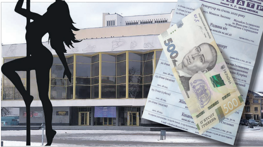
Театрالی змушені думати, як «оптимізуватися». Підвищувати ціну квитка, упевнені, – не вихід.