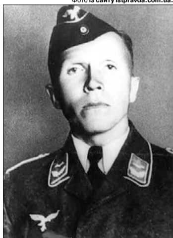
Через терористичні акти радянського розвідника Миколи Кузнецова (1911–1944) загинуло багато ні в чому не винних людей...

А в цей час православна віра зазнавала усіяких принижень. Із 1919 року Західна Волинь опи-