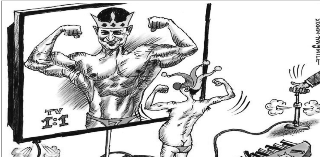
Фотожаба з нідерландського видання Cartoon Movement.

Думаю, тут не варто відразу торкатися теми прав ЛГБТ. Достатньо зупинитися на іншому, яскраво описаному в українській літературі соціальному явищі. Позашлюбна вагітність. Завжди для молодої дівчини така ситуація