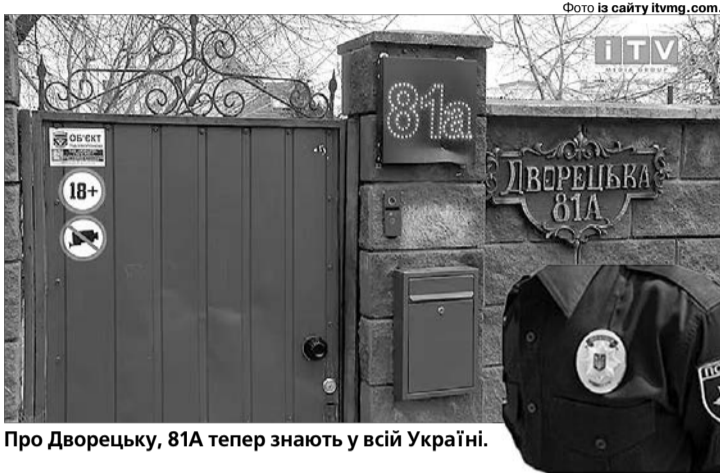
Про Дворецьку, 81А тепер знають у всій Україні.

Під час слідчих дій правоохоронці виявили різноманітні засоби для сексуального утіх: масажні олії, лубриканти, рольові костюми, зокрема форму поліцейського, багато