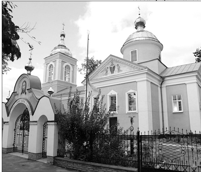
Навіть під час німецької окупації у Свято-Вознесенському храмі Горохова лунали патріотичні промови з уст священнослужителя.