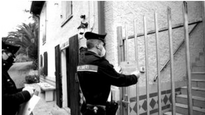
Ніхто й припустити не міг, що цей спокійний і небалакучий літній чоловік здатний на таку жорстокість.