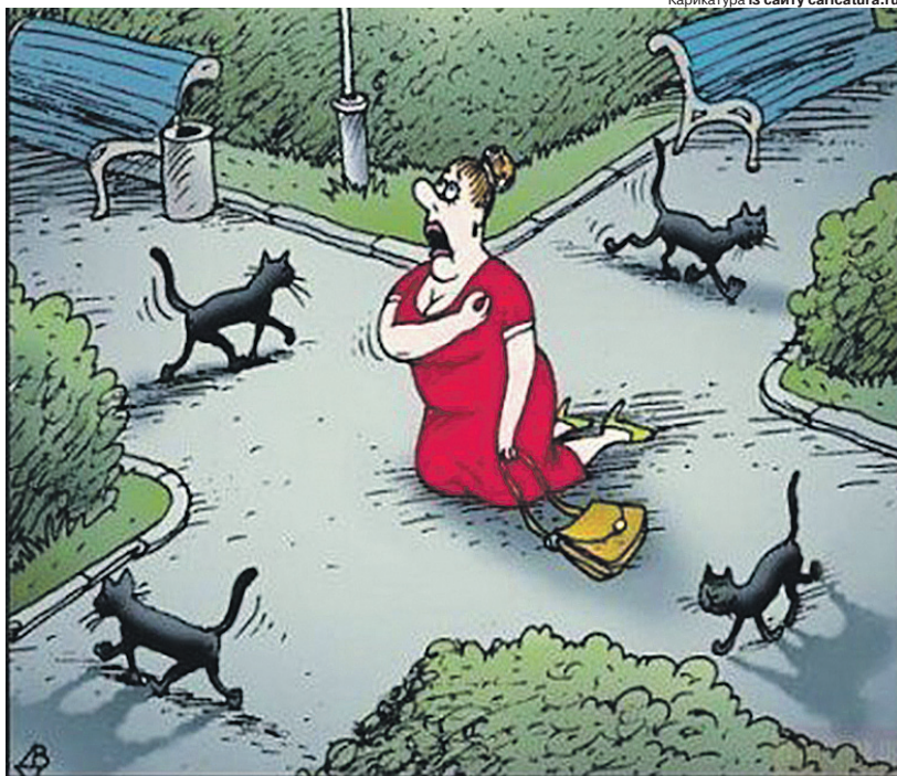
А коли не одна чорна китця перебігає дорогу?

Вони — наше спасіння? Прикмети — це своєрідна невідомо психологічна спроба підготуватись до неприємностей. Адже народна мудрість говорить: «Попереджений — значить, озброєний». Не секрет, що свої прикмети є у льотчиків, спортсменів і лікарів. Вважається, що сидіти на столі в лікарні — до небіжчика, а якщо в актора текст ролі впаде на підлогу, то він повинен обов'язково сісти на нього, а потім піднятися — інакше гра буде невдала. У льотчиків вважається недобрим знаком фотографуватися перед польотом. Для моряків погано