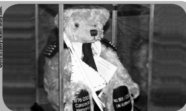
Його прикрасила героїчна історія, а не коштовності.