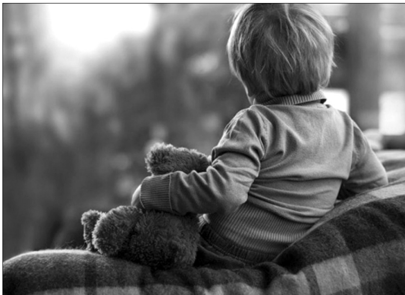
«Вона відчуває, як потрібна оцій маленькій людині».

Душею я була з ними — десь там, на небі, серед ангелів. Але тіло... Воно ж уперто мене не відпускало. Трималось за цей світ, а я не розуміла навіщо.