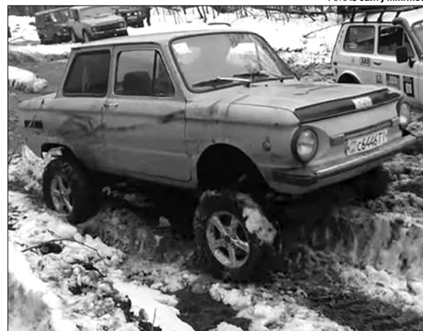
«От його б — і на ралі в Дакар!»