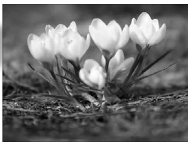
А ви вже зустрічали первоцвіти?