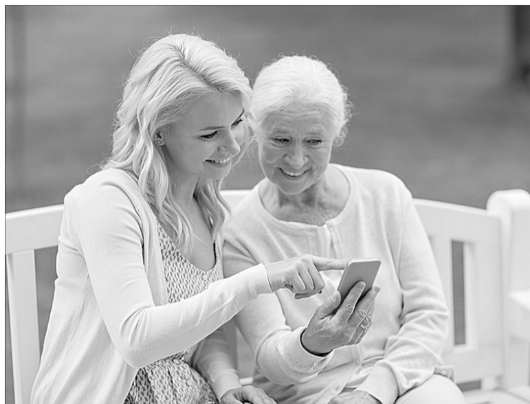
Сьогодні вже більш ніж 400 тисяч людей обрали для себе тарифи «для батьків».

Тому важливо зараз для старшого покоління швидко набуті основних навичок користування смартфоном. Не завжди в молоді є час або бажання пояснювати всі тонкощі сучасних технологій старшим. На допомогу їм приходять онлайн-школа мобільної грамотності, яку роз-