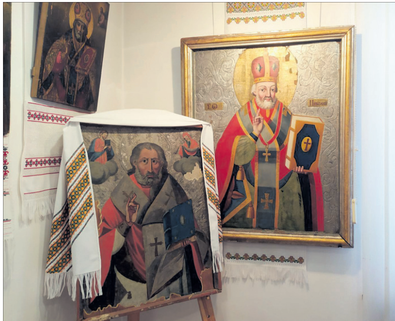
Доброго і суворого Святих Миколаїв, створених у XVIII столітті, навмисно розмістили поруч: щоб житити уяву гостей про багатозначний іконописний світ.

— Ікони могли просто валятися на підлозі, понівечені, у смітті. Наприклад, зараз у нас в експозиції є ікона «Розп'яття Ісуса Христа» — єдина, що вціліла у церкві, яку перетворили на склад міндобрів. Те, що ми привозили, було просто в жаливому стані. Бруд, шапиль, пліснява, оспиг фарбового шару. Ми обстежували і закриті, і діючі храми. Все фіксувалося. Зараз фактично маємо списки усіх давніх сакральних пам'яток, які зберігаються у храмах області. У 1984–1986 роках їздили вже другим етапом у церкви, в які не могли потрапити раніше. Якщо не ті експедиції, то про волинську