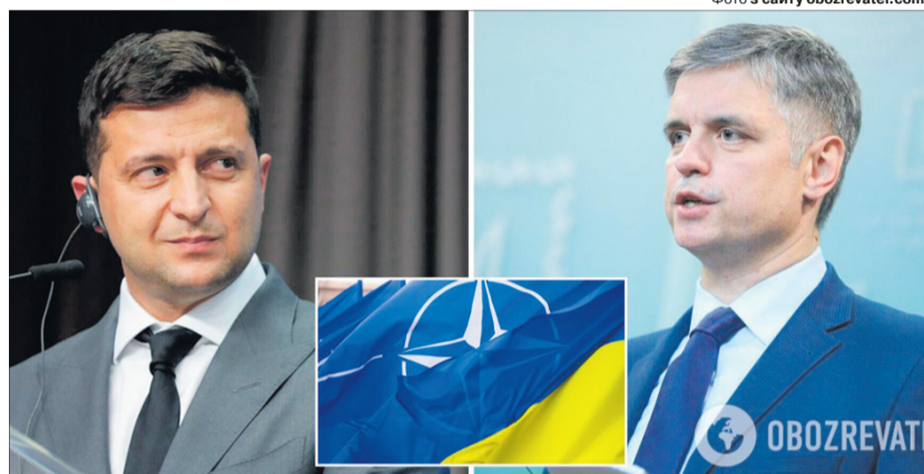
Невже Зеленський та Пристайко не розуміють, що якщо Україна піде на поступки у таких принципових питаннях, як НАТО, то це тільки заохочуватиме агресора до ще більшого шантажу?

Тим часом у найбільшій опозиційній партії України «Європейська Солідарність» обурені словами Пристайка. «Я хочу нагадати всім, що війна з Росією триває вже вісім років, і свого часу ніякий позаблоковий статус не вберіг Україну від нападу Ро-