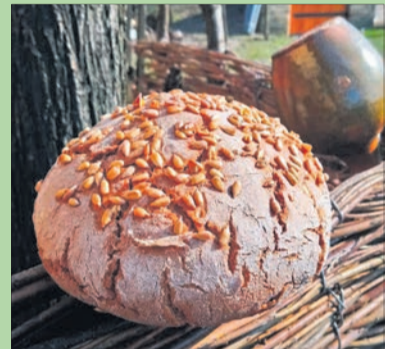
Що тут скажеш — шедеври!