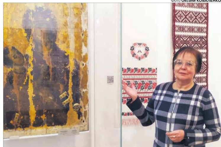
Сюди приходять побачити ікону з великою історією, а ще – помолитися.