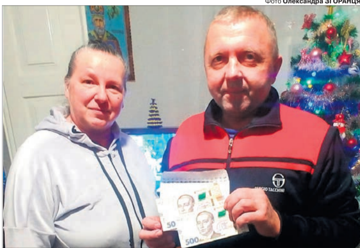
«А дружині Наталії, яка не вірила в мою перемогу, коли надсилав квитанцію на акцію, я нагадав анекдот про чоловіка, який так сильно просив Господа, аби той допоміг йому виграти в лотерею, що Бог не стримався й звернувся до нього: «Ти хоча б лотерейний квиток купив?»»

— О, аби так ще разів 50 виграти у вас по «тисячці», то скоро звелася б, — усміхається. — Якось потрошку і завершимо, аби тільки був мир. Я недавно їздив на військові збори, скажу, що Путін добре отримає