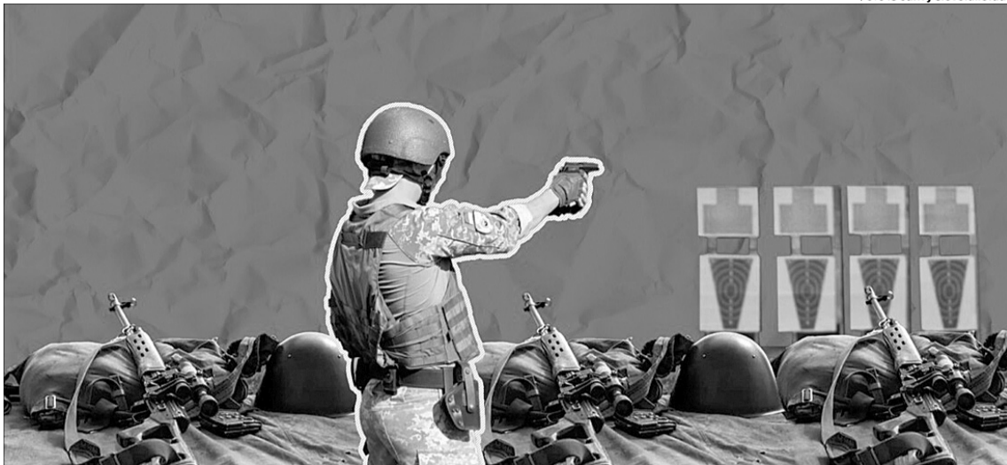
Перед реальною загрозою військової агресії кожен повинен вміти себе захистити.