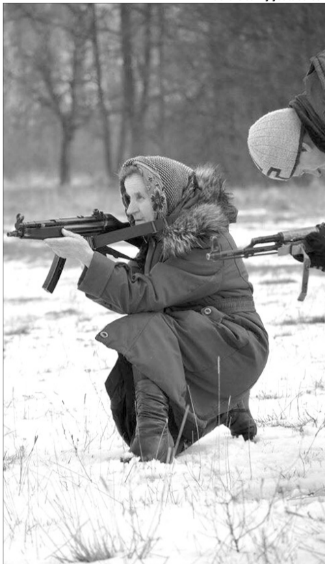
Навіть українські бабусі записуються в загони територіальної оборони.

*гробки (Проводи, Діди, Красна гірка, Радуніця) – другий тиждень після Велікоддя, коли поминають померлих. ■