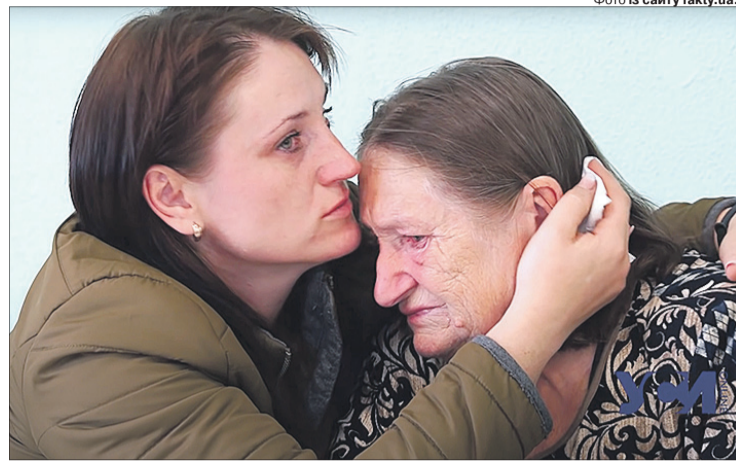
Для обох ця зустріч була несподіванкою, адже і мама, і донька майже втратили надію, що колись зможуть побачитись.