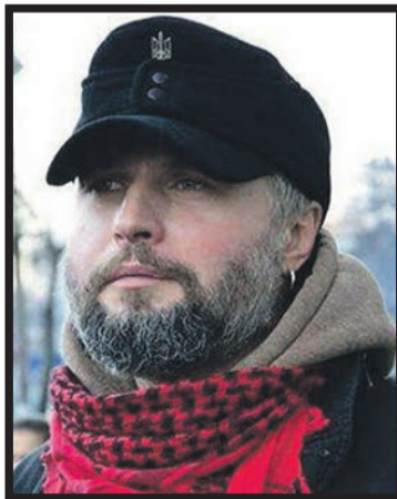
Про Ігоря Сердюка казали: «Поруч з ним відчуваш себе впевненим, є такі люди, які замінюють десятьох».