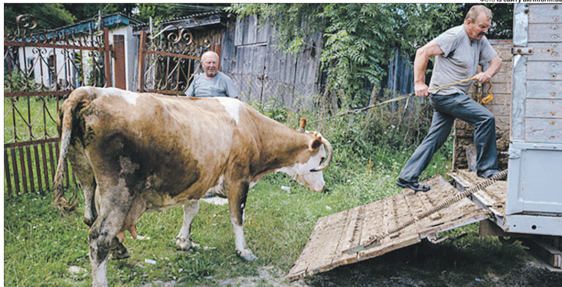
Із кожним роком усе більше селян не бачать сенсу в тому, щоби тримати на господарстві худобу.