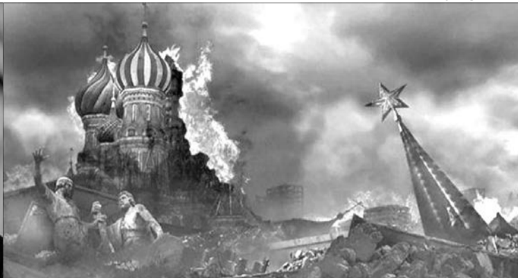
Згодні з Валенсою: доки Імперія зла не впаде, доти спокою світ не знатиме.