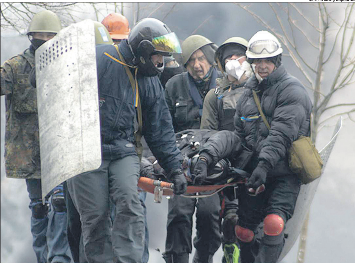
І через 8 років на фотографії з розстрілу учасників Революції Гідності не можна спокійно дивитись...

«На війні ми мали автомати, могли себе захистити, а на Майдані стояли із самими дрючками...»