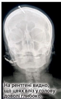
На рентгені видно, що цвях вліз у голову доволі глибоко.

Жителька міста Пешавар, що у Пакистані, так сильно хотіла сина, що звернулася по допомогу до цілителя. Той порадив їй забити цвях у лоба, щоб стать дитини точно була чоловічою. Жінка відважилася на це, оскільки четверте завагітніла дівчинкою, а чоловік пригрозив, що покине її, якщо цього разу не народиться хлопчик. Відтак у розпачі вагітна реалізувала небезпечну пораду «цілителя». Родичі знайшли її усю в крові. Вони намагалися самотужки вишукати цвях та зупинити кровотечу, але не вдалося. Довелось везти в лікарню. Там жінка розповіла, що перебуває на третьому місяці вагітності. УЗД-дослідження підтвердило, що народиться дівчинка... Вагітна наразі не зізнається, чи допомагав їй хтось вбивати цвях у лоба. Тим часом «цілителя», який дав їй пораду, вже шукає поліція.