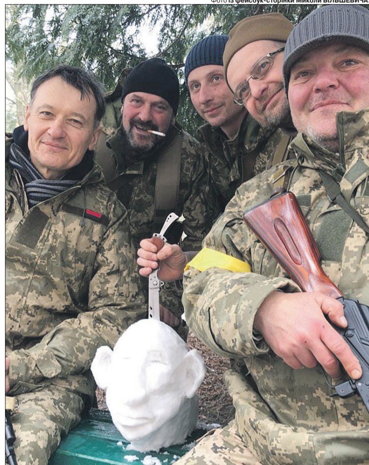
Простромлювати ножом голову Путіна — ще той антидепресант.