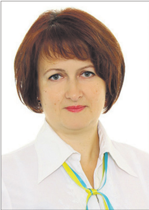
Диригентка: «Молимося за Україну».