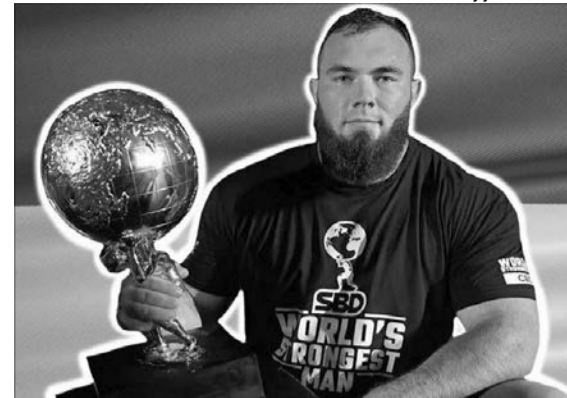
«Дякую, мамо, що прищепила любов до Батьківщини та високий рівень патріотизму».