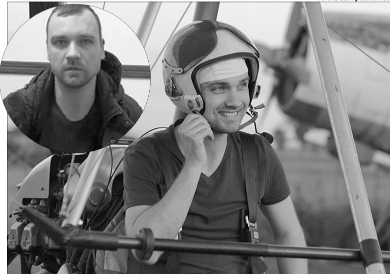
За нібито приємною посмішкою ховався цинічний ворог.