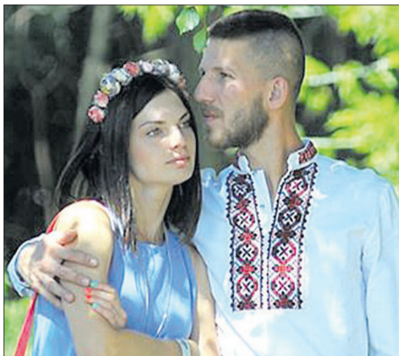
Головним для них є спільне бачення того, за що треба боротися.