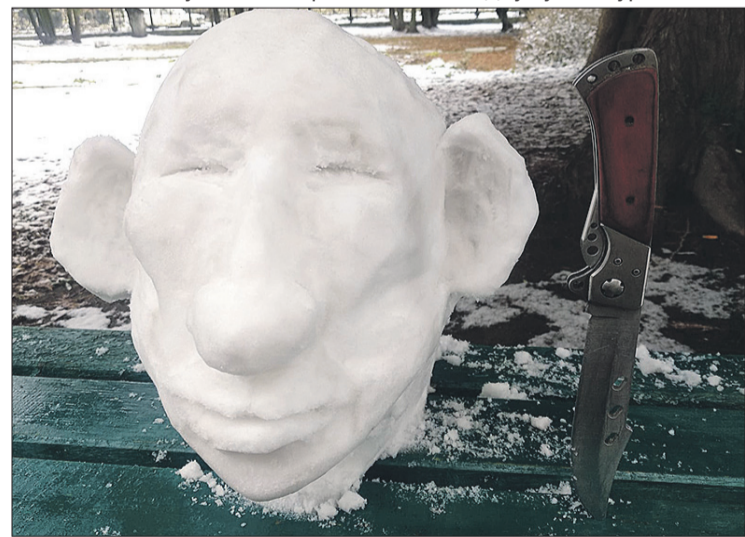
Прямо як справжня: і зовні схожа, і всередині без сірої речовини.