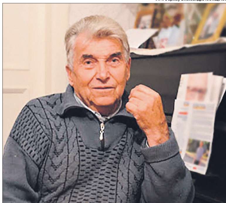
«Пустив у фейсбук дві пісні — хай піднімають людей!»

— Ви ж знаєте: я патріот з самого дитинства: з десятого класу був засуджений і відбував покарання у Пермському краї на лісопавалі... Вірю в перемогу. Яка вже вона буде... Однак Росія нас не візьме! Хоч завдає сильного болю отими вбивствами і руйнацією. Зараз мені часто згадується юність. Я дякую москалям, що мене засудили. Через те мусив багато чого здолати, але зате не потрапив в Радянську армію, не загинув разом з багатьма воїнами-«інтернаціоналістами», а дожив до незалежної України.