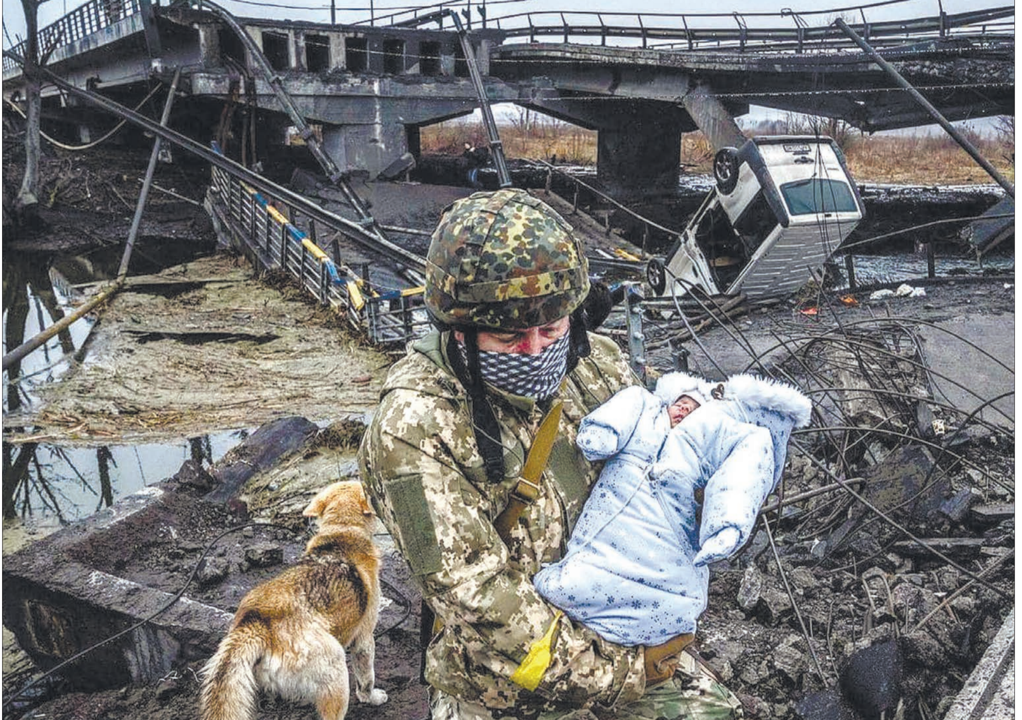
Український воїн біля зруйнованого мосту в Ірпені переносить немовля під час евакуації мирного населення, яке обстріляли російські загарбники.

«Малий (-а), запросиш на весілля в мирний час, а поки що я в бій піду, аби спасти для тебе Україну»