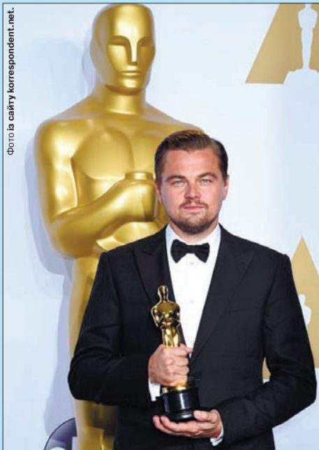
Леонардо знає про жахіття війни безпосередньо від бабусі та мами.

Голлівудські зірки Леонардо Ді Капріо, Міла Куніс, Ештон Кутчер переказують великі суми Україні, яка веде війну з російським агресором. На потреби української армії пожертвував $10 млн легендарний оскароносний актор Леонардо Ді Капріо («Одного разу в Голлівуді», «Не дивіться вгору»). Актор не раз заявляв, що має українське коріння. Його бабуся Олена Смирнова (1915–2008) колись жила в Одесі. Вона емігрувала до Німеччини з батьками після Жовтневої революції, де потім вийшла заміж