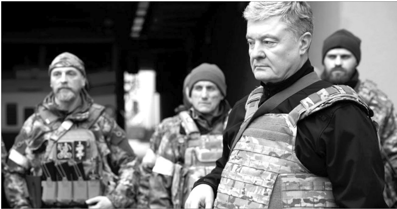
«Це – не війна лише проти України. Це війна проти колективного Заходу, війна проти США, війна проти НАТО, війна проти Європи, війна проти всього світу».