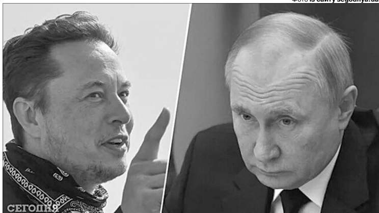
Але ж пуйло ще й сц*кло!