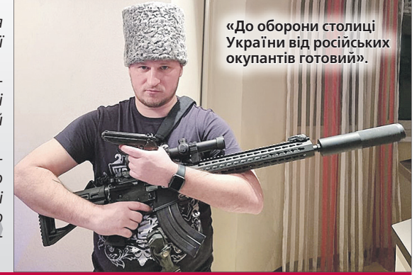
«До оборони столиці України від російських окупантів готовий».

Я народився в Росії. Але із 37 років свого життя 24 провів в Україні. Я вже українець. Тут народилися мої діти. У Росії я тільки народився, але я вже українець. Мені дуже боляче було дивитись на те, що відбувалося на Донбасі. А зараз побачив усе це на власні очі, бачити це й мої діти, що відбувається по всій Україні... І я — як чоловік — не міг стояти осторонь. Спершу зробив так, щоб мої діти звідси поїхали і цього не бачили. Було дуже прикро, коли вони плакали казали: «Тату, нам страшно». Моїм завданням було відправити дітей у безпечне місце та піти захищати Україну.