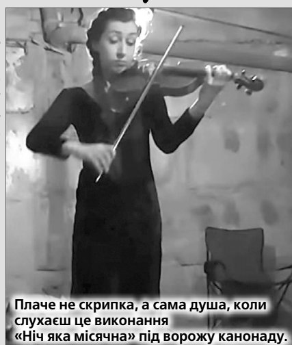
Плаче не скрипка, а сама душа, коли слухаєш це виконання «Ніч яка місячна» під ворожу канонаду.

«Було дуже важко грати на скрипці й думати про щось поза війною. Але я вирішила, що повинна зробити щось для цих людей. Ми стали однією сім'єю в цьому підвалі. Слухаючи музику, вони забували на мить про жахіття війни і мріяли про щось хороше», — розповіла артистка журналістам.