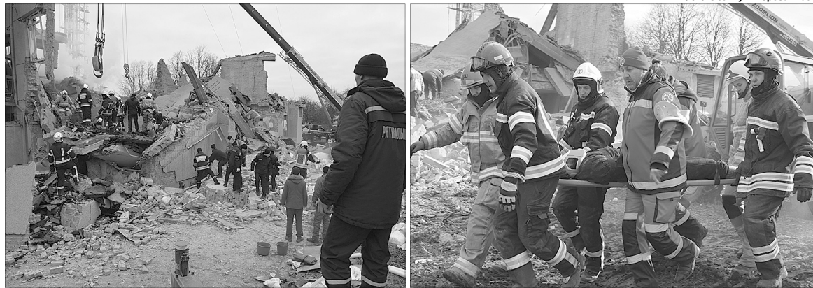
Ось так окупанти розбили ракетами мирний об'єкт на Рівненщині.