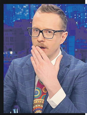
Сміливий у кадрі, а ще більше – на фронті!