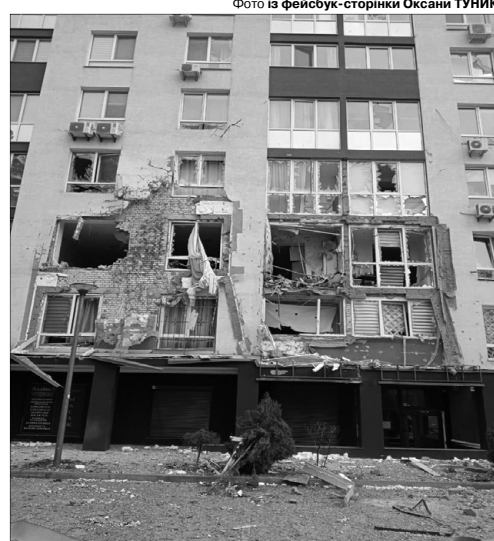
«Кому куди кричати, аби дали врятувати людей...»