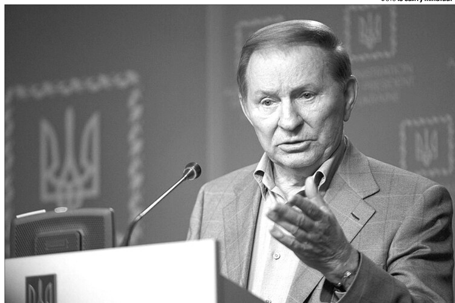
«Україна — не росія. І ніколи не стане росією. Не дочекаються».

«Українці! Рідні мої! Ми різного віку та статі, ми різної крові та віри, та усім нам сьогодні одне ім'я — Українці.