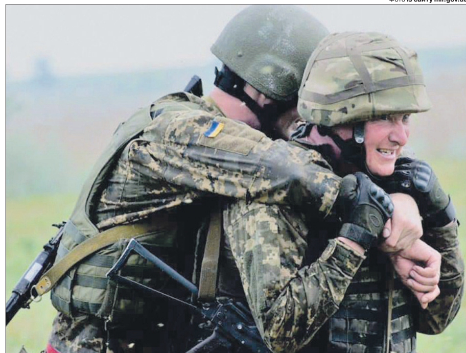
Якщо командир сміливо проходить смугу перешкод і першим іде в наступ під час бою, хлопці за нього будуть стояти горою.