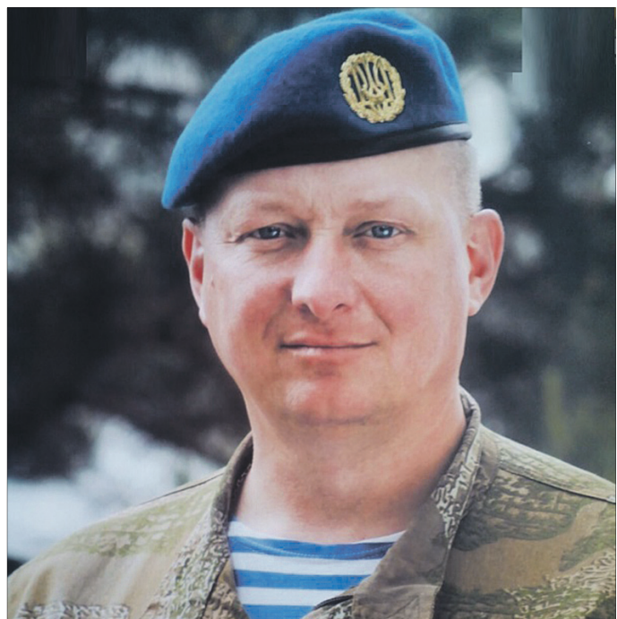
«У мене є амбітний план: створити із морської піхоти України нехай маленький, але аналог американської».