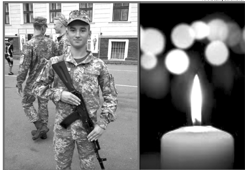
Віталій Сапило — Герой України, цвіт нації...