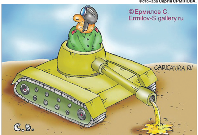
Ось такі вони — «непабедиме»...

Водне з тамтешніх сіл (називати з питань безпеки не будемо) заїхало 4 російські танки. Місцеві сидять по хатах, спостерігають з цікавістю за життям ссавців. Танки зупиняються, вилазить екіпаж, з двох зливають паливо в інших два і кудись їдуть. А два порожні залишаються стояти посеред села.