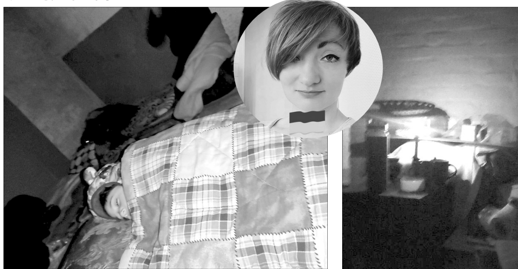
На фото — мій трирічний син солодко спить у холодному страшному укритті і та сама свічка, яка утримала мене свого часу від божевілля.