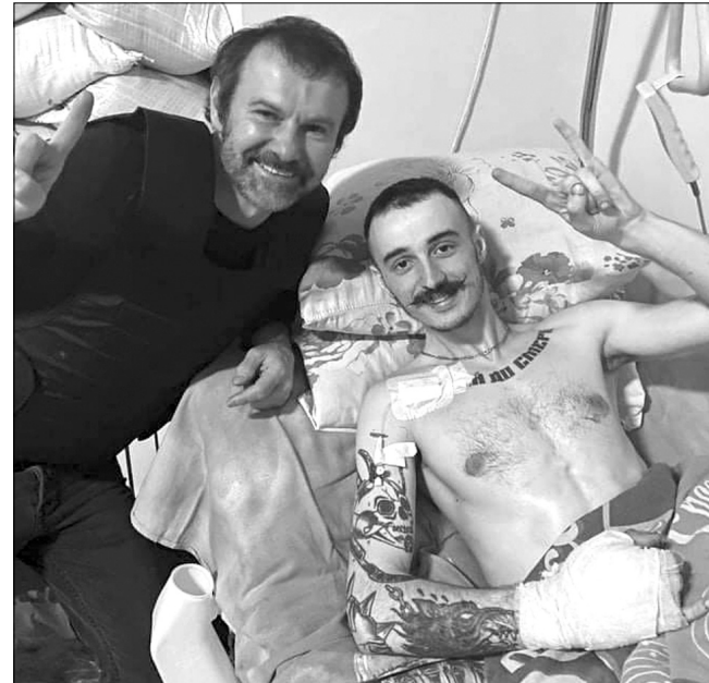
Після зустрічі в госпіталі зі знаменитим Славком Вакарчуком рани заживатимуть швидше. Повертайся у стрій, козаче!

Мужній захисник із Любешова одержав важке поранення, захищаючи Маріуполь, і зараз перебуває на лікуванні в одному із госпіталів