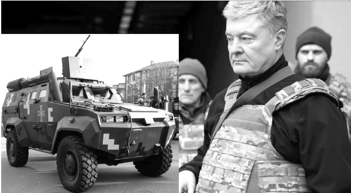
З такою технікою нашим воїнам легше буде бити москалів.