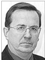
Володимир КАРПУК, народний депутат України V та VI скликань (м. Луцьк):

сім жили власними інтересами. Збивали капітал і, певно, мали завчасно «запасний аеродром», щоб втекти з України, коли її нищитиме ворог.