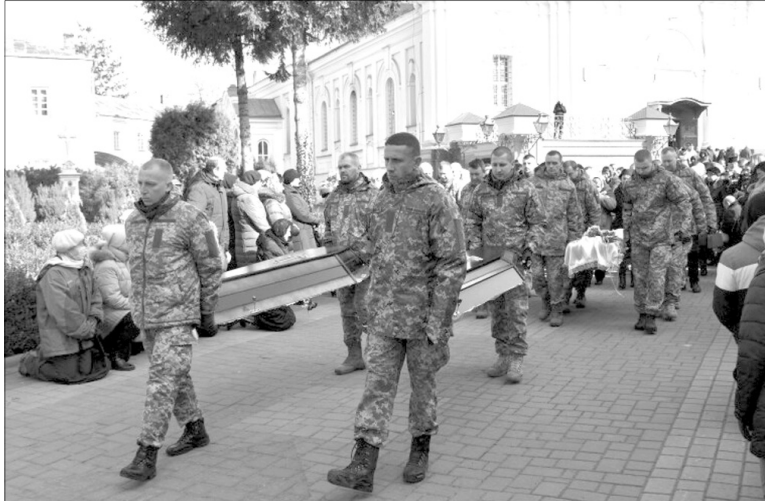
Злочини російських нелюдів на нашій землі запам'ятаємо навіки!

цієнтів ехобаротравма (тобто травма від ударної хвилі), закрита черепно-мозкова травма і струс головного мозку, в двох інших постраждалих теж струс головного мозку та уражені ноги, ще один отримав травми внаслідок завалів.