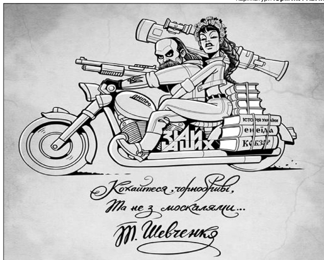
А до чорнобривих москалям краще не наближатися.