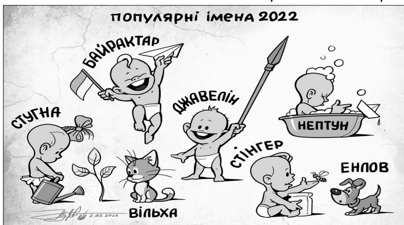
І в 2022-му, і через десятки літ Україну буде кому боронити!

їний. Їдкі зображення демонструють то шеренгу молодих росіянок, які слухняно підносять немовлят до крематорію, організованого московським сатаною, то того ж таки путіна, який радо вітає співвітчизницю зі святом 8-го Березня, обклавшись, наче дарами, трунами з їхніми убитими рідними. Ці герої усміхнені, бо ж відомо: у них майже немає загиблих, бо ж і війни немає – хіба що якийсь там конфлікт. Аполітичний фейсбук не витримав і заблокував нашого невтомного Журавля: начебто він розпалює міжнародну ворожнечу! Та людям Журавель-палій дуже подобається: нещадність до потвор у людській подобі, які налізли з рашки, сьогодні чеснота №1. Тим більше, усі знають, що до притомних людей карикатурист ставиться з добрим гумором. От