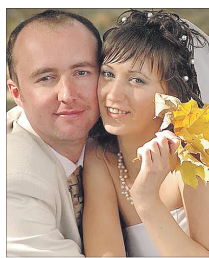
Пам'ятний день весілля.