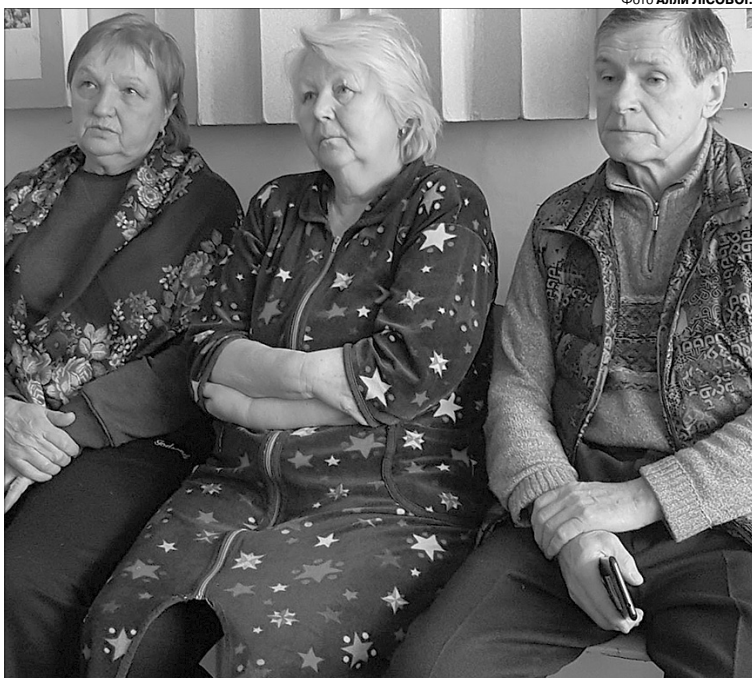
Харків'янам нелегко було ділитися враженнями від пережитого у перші дні війни.