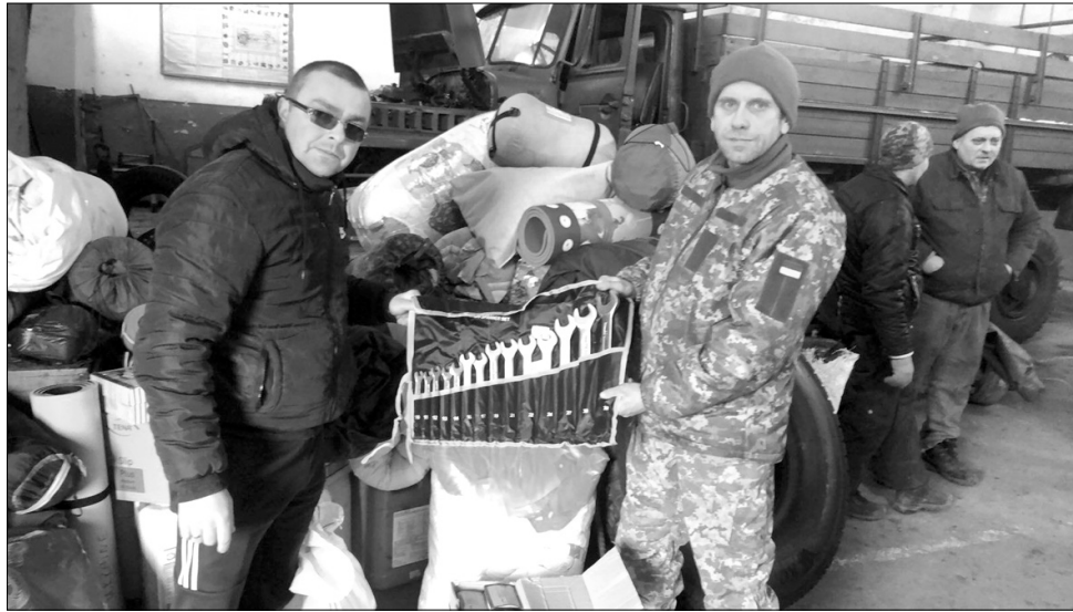
Ремонтні ключі для водіїв завжди на вагу золота.