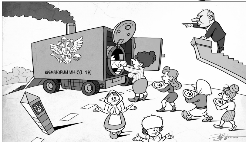
Російські матері виконують забаганку нелюда путіна і, по суті, відправляють своїх дітей у крематорії, які із собою возять російські війська, щоб приховати численні жертви.