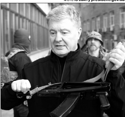
Гуртом путіна легше бити.

«Ми зробили путіну великий сюрприз. Ми мали декілька зустрічей з Президентом Зеленським, ми домовилися зараз, що будемо виступати єдиним фронтом. Я думаю, що це абсолютно адекватна і правильна поведінка, коли всі українці зараз є не президентом, міністром, лідером парламентської фракції чи партії, чи робітником, чи працівницею — ми всі зараз солдати, які мають захищати Україну. Ми всі рівні. І на плечах усіх лежить спільна відповідальність за Україну.