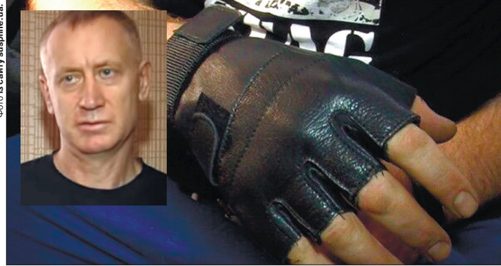
За день вдається пошити 15–20 пар.

Чоловік розповів, що разом з іншими майстрами та волонтерами працює над тим, аби збільшити масштаби їх пошиття