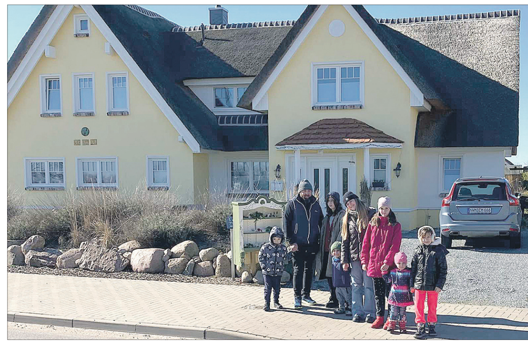
Прогулянка в містечку Вільдб'єрг досі невідомої Данії.