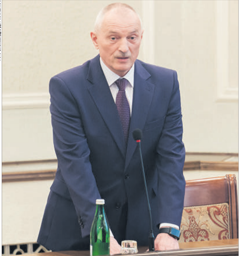
Про нового керівника відомо, що він вольовий та рішучий.