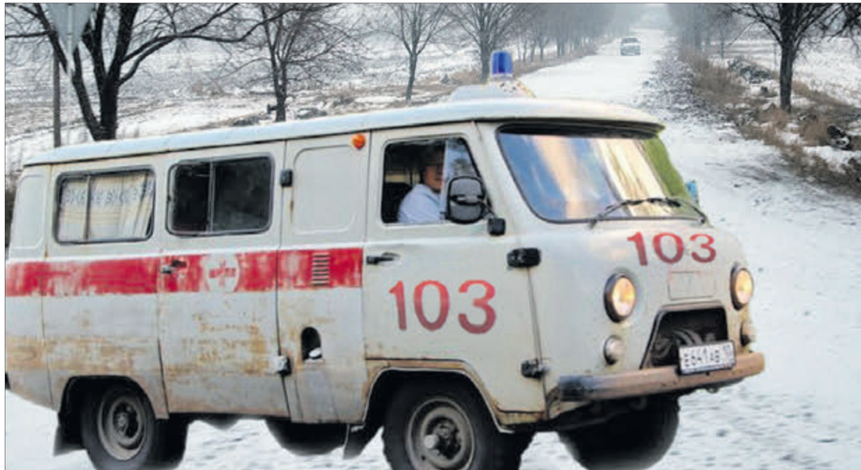
Найбільший ворог «швидких» — сплюдровані шляхи.