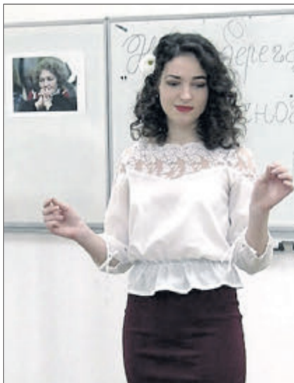
Театралізоване дійство у виконанні студентів.