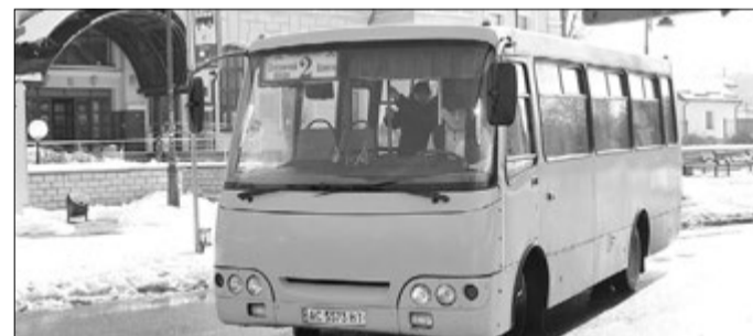
Щоб оновити цей автобус класу Євро-4, ПП «Санрайз» вклало у нього 350 тисяч грн. Таких автобусів є вже 11.