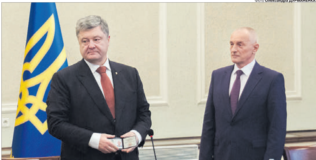
Петро Порошенко — Олександр Савченку: «В області має бути порядок».