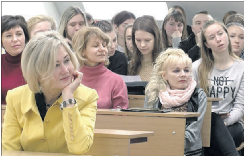
Лірика Ліни Костенко зачаровує.