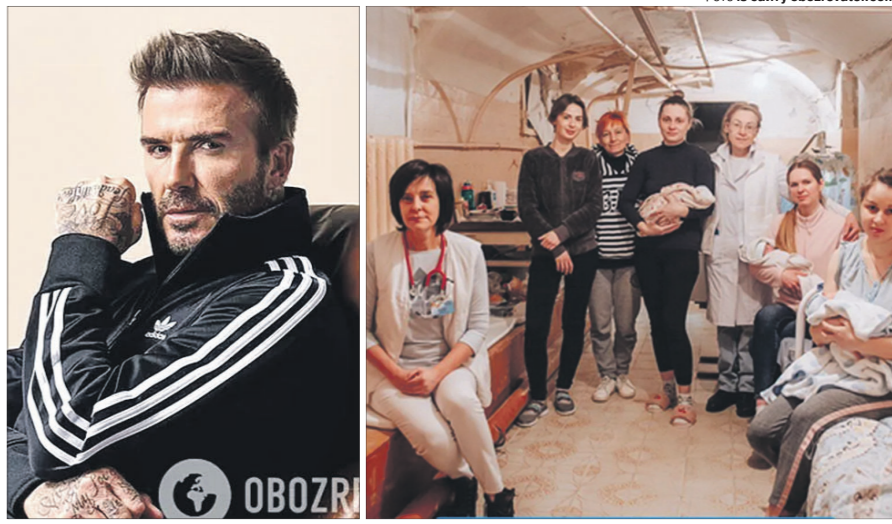
Харківська лікарка особисто не знайома з англійським футболістом, а вибір Бекхема пояснює тим, що раніше брала активну участь у міжнародних програмах.

У списку зірок світового спорту, кіно і шоу-бізнесу, які підтримали Україну з перших днів російського вторгнення, великими літерами вписано ім'я англійського футболіста Девіда Бекхема. Популярний спортсмен, батько чотирьох дітей і просто красивий чоловік став справжнім другом нашої держави. Він не обмежився лише жовто-блакитною стрічкою на одязі та словами підтримки (що теж дуже важливо), але й разом із дружиною Вікторією переказав 1,3 мільйона доларів і далі продовжує збирати кошти