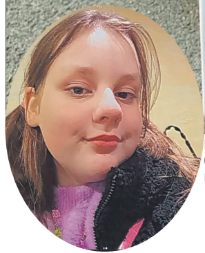
Юна благодійниця без жалю віддала безпілотник, розуміючи, що він може допомогти в обороні України.