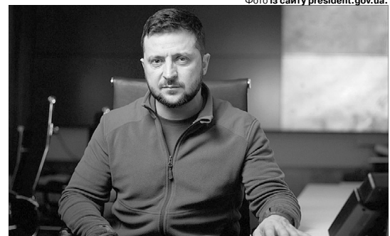
«Вважаю, що авторам цих та інших подібних законопроектів варто було би взяти зброю в руки та вирушити на поле бою... Лише там щось зрозумієте».

Бо віками ми є, браття, козацького роду!