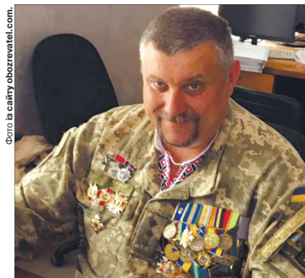
Для нього слово «честь» означало все.