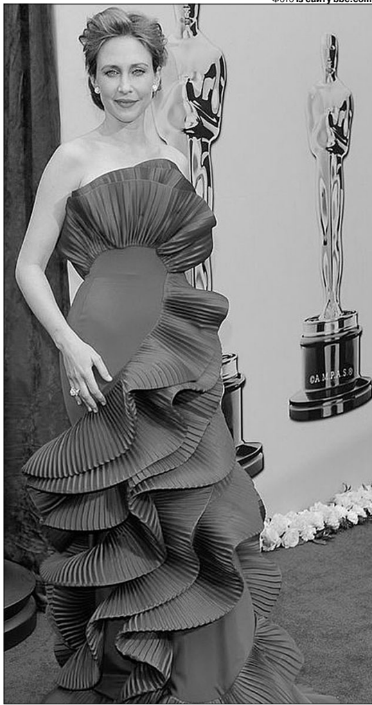
Всесвітньо відома акторка закликає весь світ підтримувати українців.