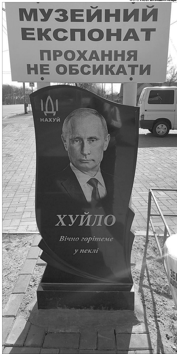
Україна вже готова до кончини пуйла. Цей пам'ятник стоїть у Павлограді Дніпропетровської області.