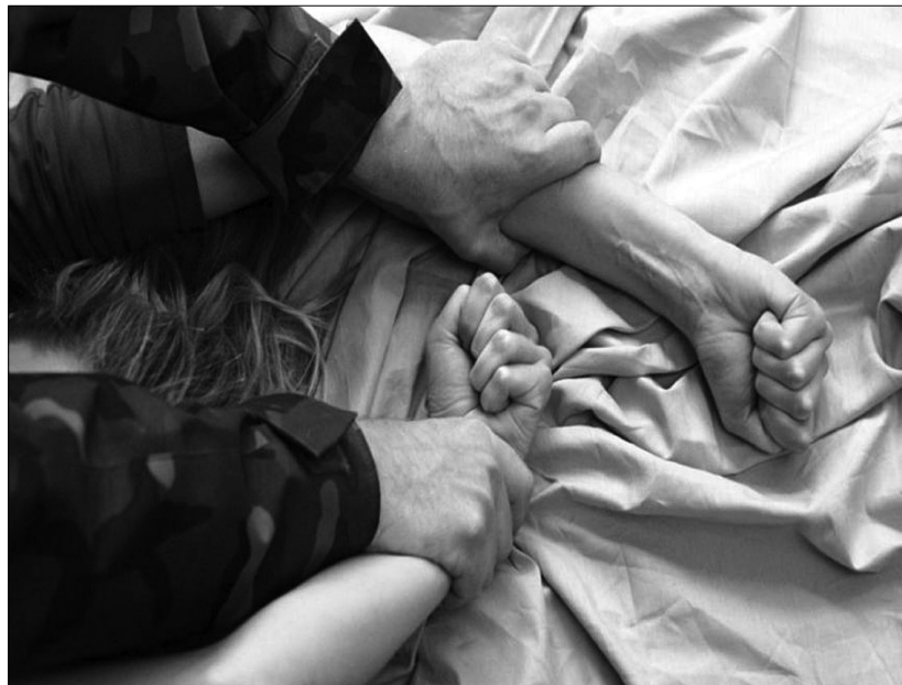
І таких шокуючих історій про злочини путінських тварюк – уже тисячі.