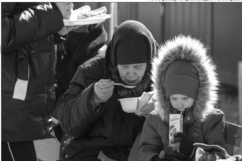
Іхні оселі розбомбив Путін...

провести колону, посадити на автобуси, записати у список, чергувати біля наметів. А й, наприклад, мити банянки. Чи мили ви колись дуже жирні банянки на холоді без засобів для миття, на дорозі, біля цистерни з окропом, коли повз тебе проштовхуються десятки, сотні біженців?