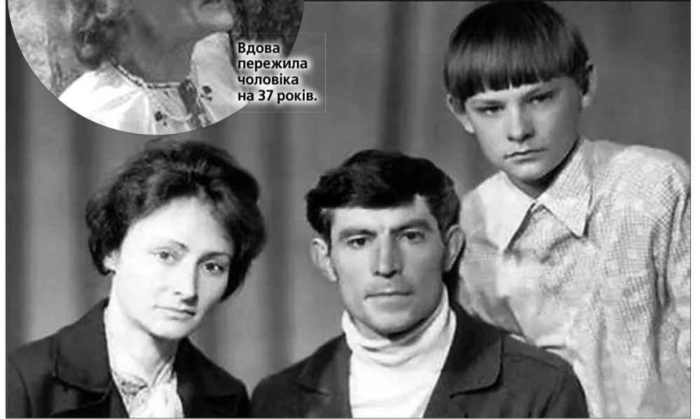
Василь Стус з дружиною й сином.

змінити. Наприклад, коли його вперше забрали, мені наснилась дорога, якою Василь іде і не озирається. Я дивлюся йому вслід... У цю хату він уже не повернувся... За словами жінки, ті роки пережила, як уві сні. Як його не стало — наче світ змінився. Одразу прийшла самотність...»