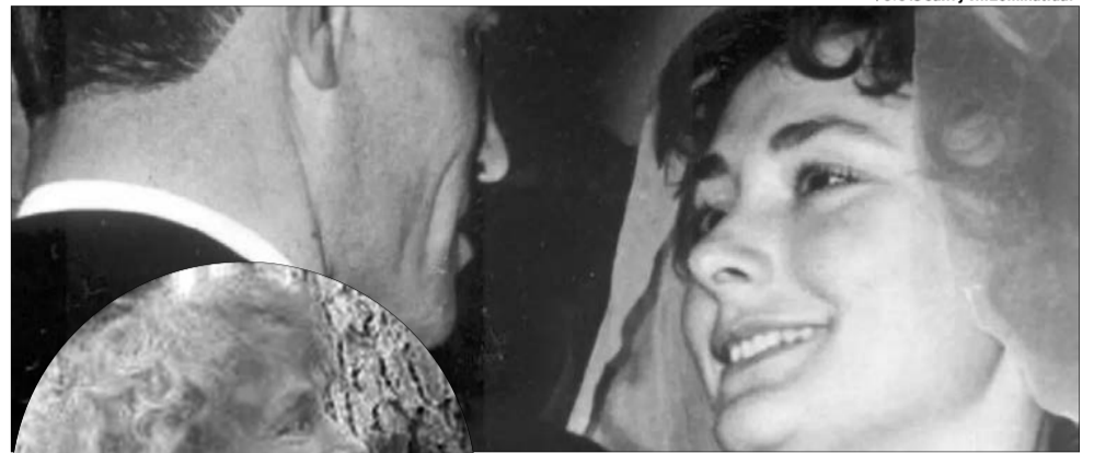
Пам'ятний день весілля.