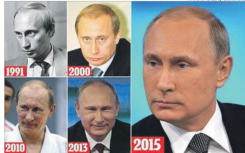
Фотоколаж із сайту factnews.ua.

Словом, путін, який на самоті покладає квіти до якогось пам'ятника, цілком може бути двійником. Людей від нього спеціально відігнали, щоб ніхто не побачив, що «цар» несправжній. А от путін, який бризкає слиною, стверджуючи, що «українців не існує», — той справжній. Справжній диявол.