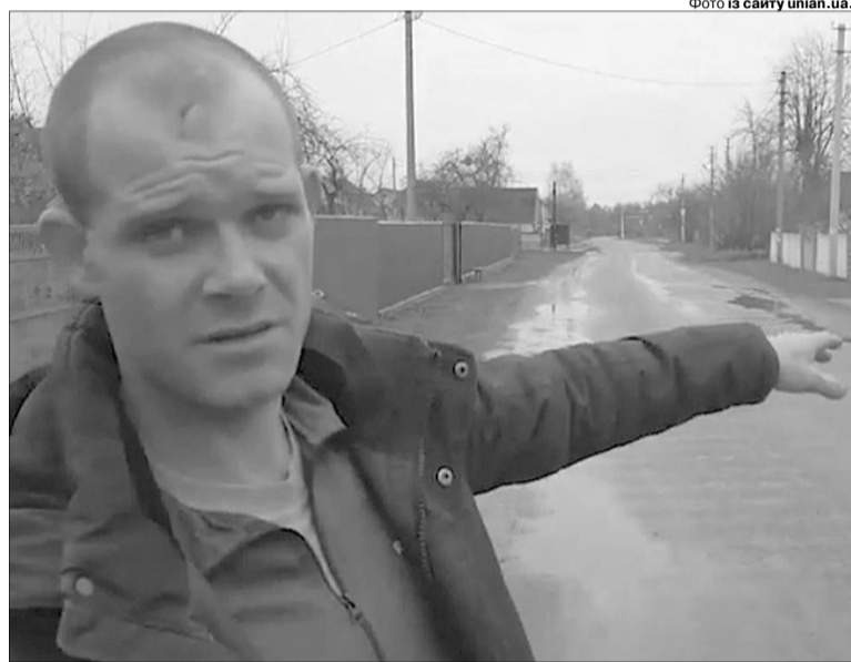
«Били по голові, по ліктях, прострілювали руки й ноги...»

Волонтерів вкинули у вузький люк і по черзі виводили катувати та бити, випитуючи, де позиції українських військових. Але ті ні-