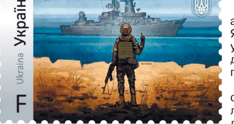
На нашій марці — одне з останніх зображень російського крейсера.

Оскільки Укрпошта припинила співпрацю з росією та білоруссю, то тематичні конверти і марку не можна відправити в ці країни.