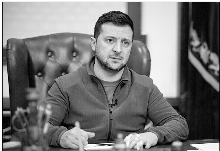
Столиця стоїть, Президент працює!