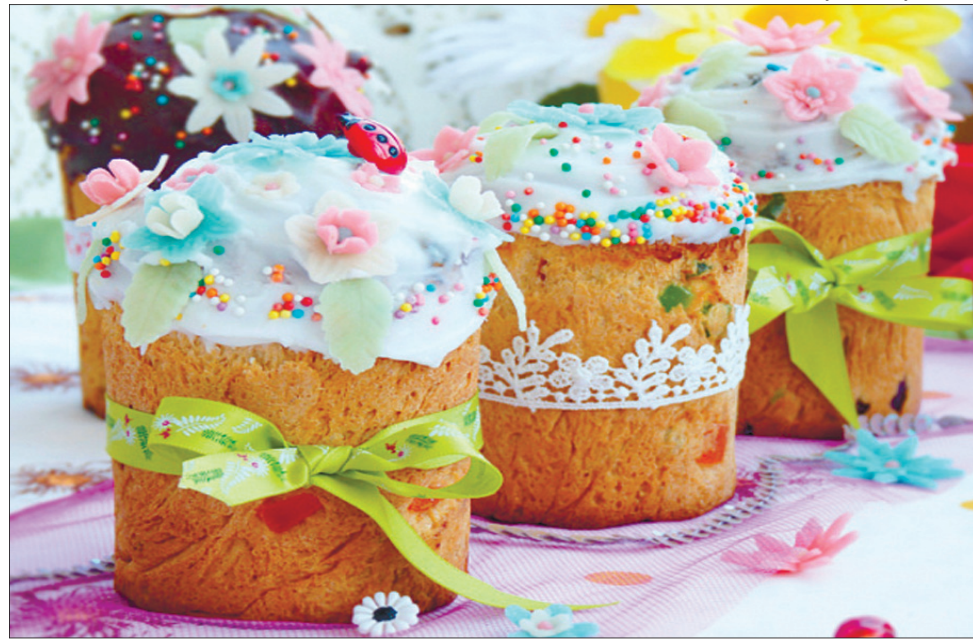
Хоч би скільки наїдків приготували господині, головним атрибутом свята є великодній хліб.

Приготування. Відварене м'ясо нарізати соломкою. Цибулю почистити, пократити півкільцями, скласти в миску, залити оцтом і залишити на 10–15 хвилин, після чого маринад зцідити. Огірки нарізати соломкою. Змішати в мисці м'ясо, цибулю й огірки, посолити, поперчити