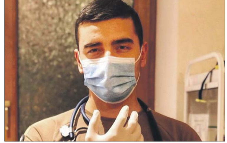
Нехай Бог береже тебе, козаче!