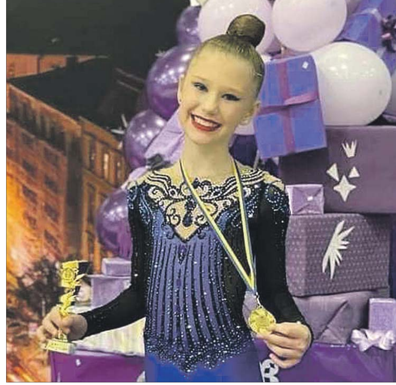
Катруся готувалася виступити в Києві на престижному турнірі з художньої гімнастики на Кубок Дерюгіних.