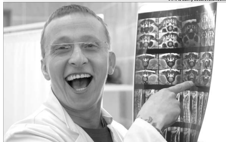
Сподіваємось, що на собаку Охлобистіна чекатиме на нашій землі собача смерть. Нехай пробачать нас усі невинні пси за таке порівняння.