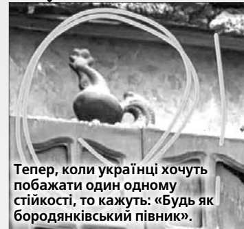
Тепер, коли українці хочуть побажати один одному стійкості, то кажуть: «Будь як бородянківський півник».

У цьому місті на Київщині рятувальники змогли акуратно демонтувати кухонну шафу із керамічним півником, які дивом вціліли після обстрілу рашистами, коли попадали сусідні стіни