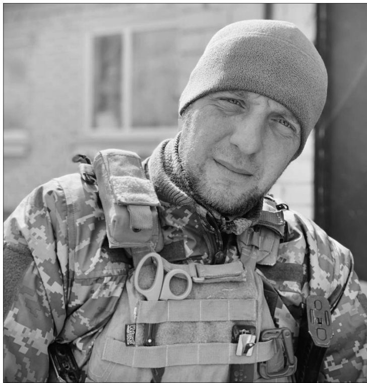
Роман впевнений, що наші діти житимуть у нормальній країні та з правильними цінностями.

Наталія ЗАДВЕРНЯК, кореспондент АрміяInform