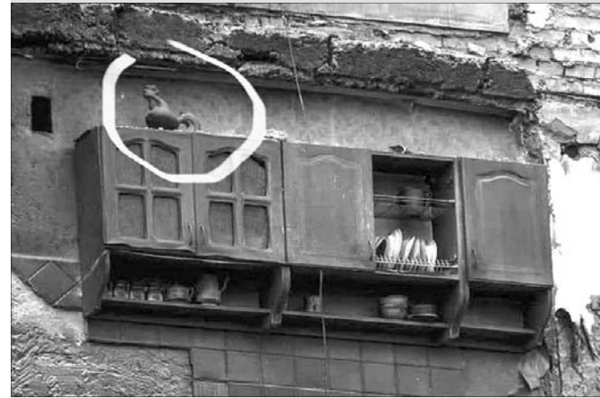
Стілізоване зображення цього півника, яке зараз набуває популярності, означає стояти, попри все, і не здаватись.