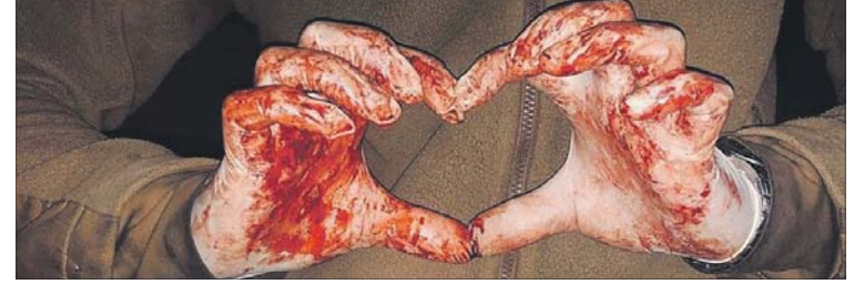
Закривавлені руки у формі серця — це світлина, про яку ми пам'ятатимемо багато років.