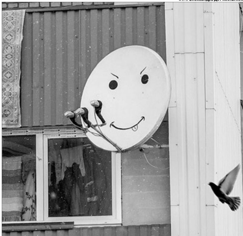
Помічайте усмішки навколо себе, адже вони надихають.

Важко сказати, чи знав автор «розпису», що смайлик справді пов'язаний із засобами масової інформації. Коли в 1972 році європейці вперше побачили це зображення, французька газета «France Soir» розпочала акцію «Знайдіть час усміхнутися». Логотип «смайл» використовувався для