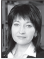
Ірина КОНСТАНКЕВИЧ, народний депутат України (м. Луцьк):

— Після офіційного представлення Президентом нового голови облдержадміністрації Олександра Савченка я мав можливість особисто з ним познайомитися, розповісти про наше підприємство. У розмові зупинилися на ключових моментах, що стосуються моєї роботи як керівника обласного об'єднання організацій роботодавців. У нового губернатора є розуміння найбільш болючих проблем області й бачення шляхів для їхнього розв'язання. Завдання чіткі й зрозумілі. Але для їхньої реалізації перш за все потрібно сформувати команду професіоналів, звичайно, з використанням частини наявного кадрового потенціалу. Тільки тоді можна розраховувати на успіх.