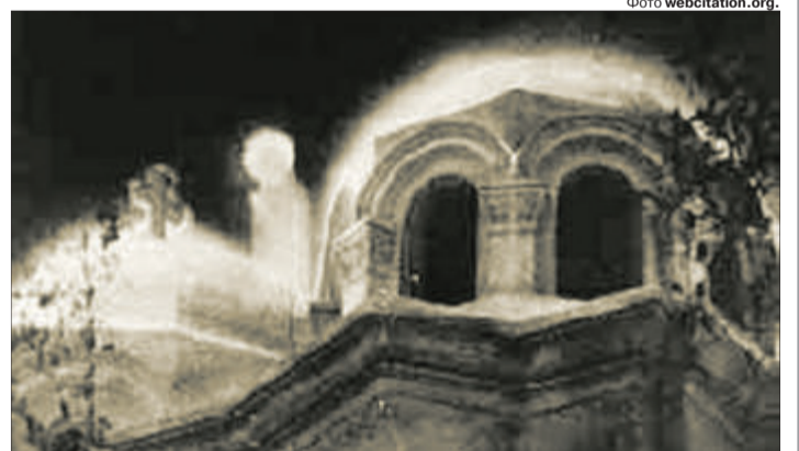
Це фото 50 років тому облетіло увесь світ.

протягом трьох років і завжди вночі. Іноді на куполі храму, іноді біля пальм у дворі церкви. Діва Марія була то сама, то з маленьким Ісусом, то з Ісусом та Йосифом. За цей час зцілювалося багато немічних.