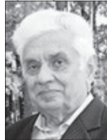
Андрій БОНДАРЧУК, письменник, громадський діяч, народний депутат України І скликання (м. Луцьк):

Мені, звичайно, хотілося б, аби в полі зору нового губернатора були проблеми охорони здоров'я. Реформування галузі почали з первинної ланки, але у сільській місцевості люди не мають з кого вибирати собі лікаря. А через бездоріжжя й «швидка» в глибинку не завжди доїде. Молоді спеціалісти там не затримуються, бо нема житла. Та й загалом до думки медичної спільноти наші «верхи», на жаль, не прислухаються.