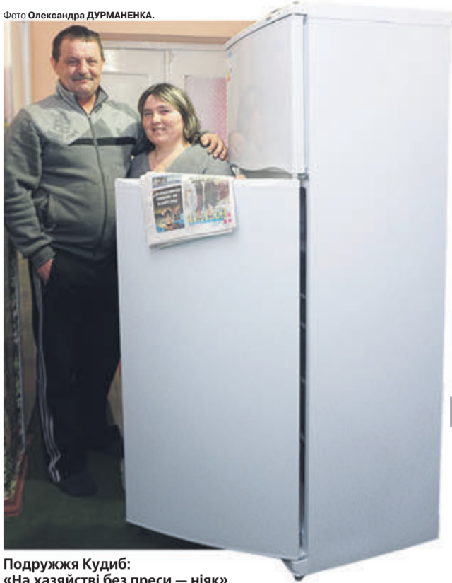
Подружжя Кудиб: «На хазяйстві без преси — ніяк».