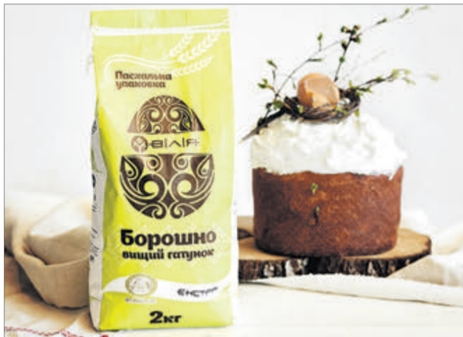
А з нашого борошна паска буде неперевершеною.

Цікаво, що в слов'янських народів з ним пов'язані не тільки християнські звичаї. Його не лише освячували у церкві, але й розкладали шматочки в полі, закликаючи врожаї, а по тому, якою вийде у господині паска, визначали, наскільки вдалим буде для неї наступний рік. За формою традиційний великодній хліб нагадує церкву з куполом, тому на верхівці зображували хрест. Це особливий вид випічки — складно пояснити, чому дріжджовий хліб, спечений на Великдень, може довго зберігатися і не покриватися пліснявою