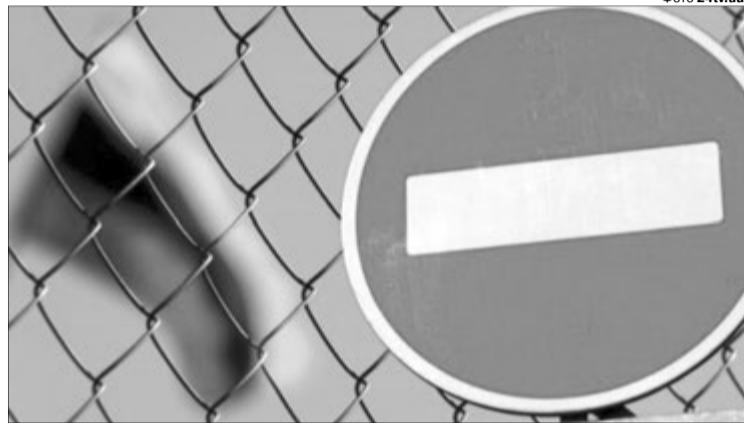
Good Bye, Russia!

Звісно, треба користуватись кожною нагодою для атаки на Росію на будь-якому