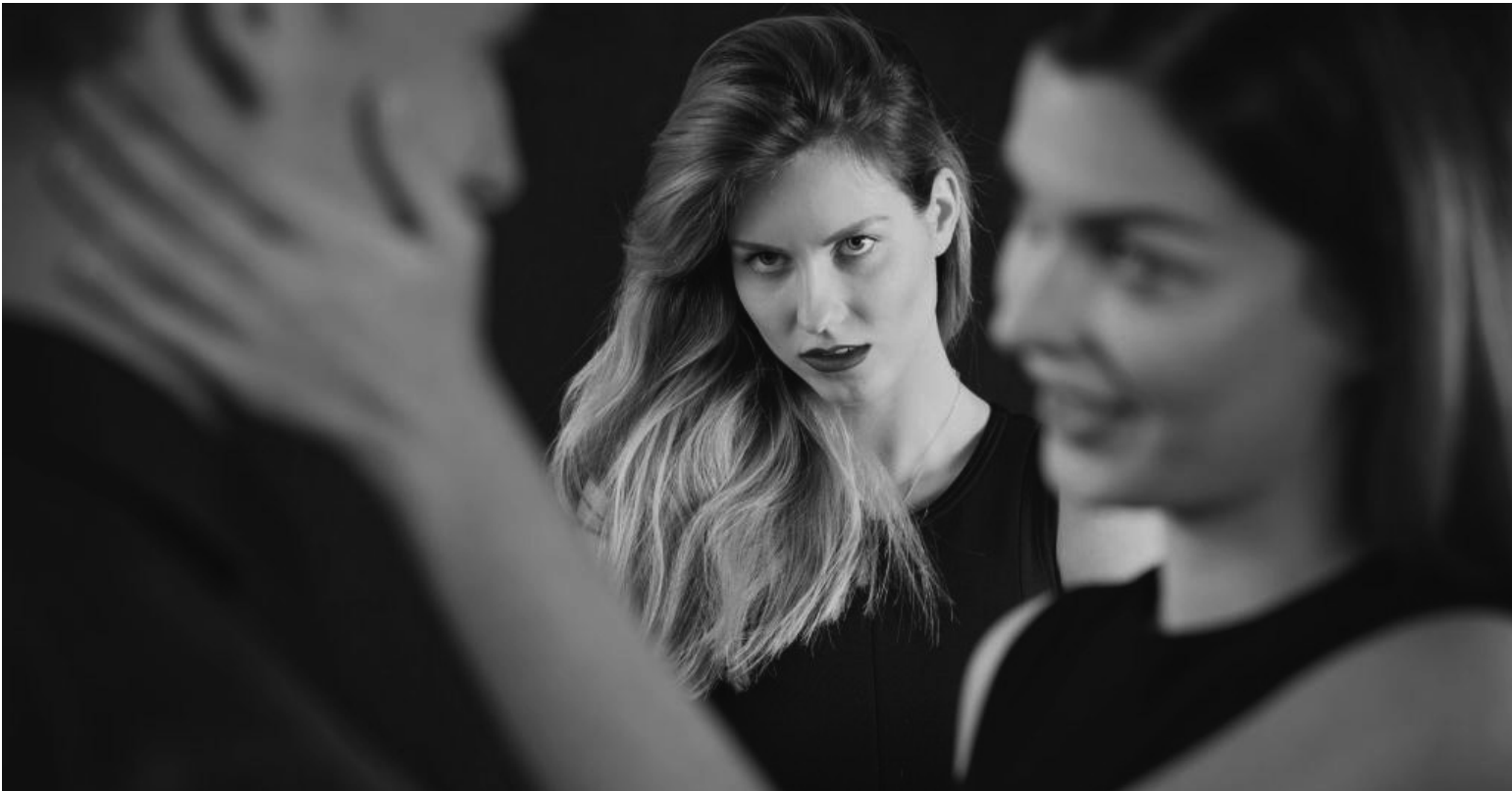
«Дай мені Маринин номер телефону і адресу твоєї тещі...»