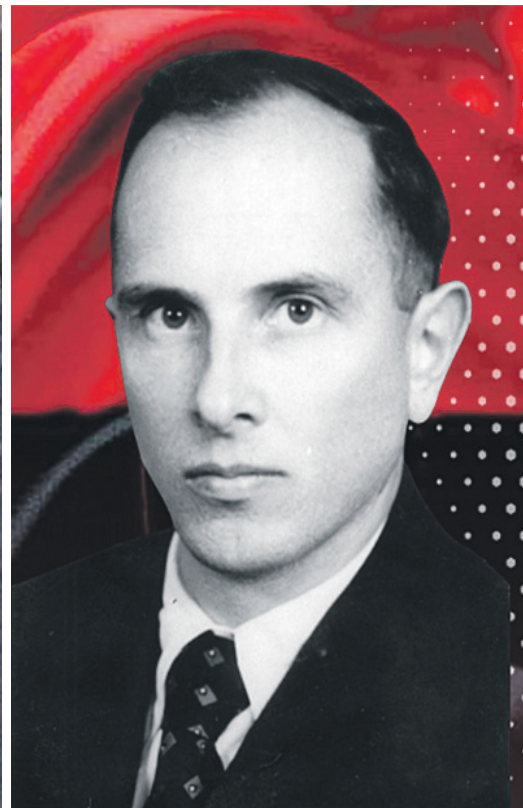
Донька Бандери до 13 років не знала, що її батько — ідеолог ОУН.