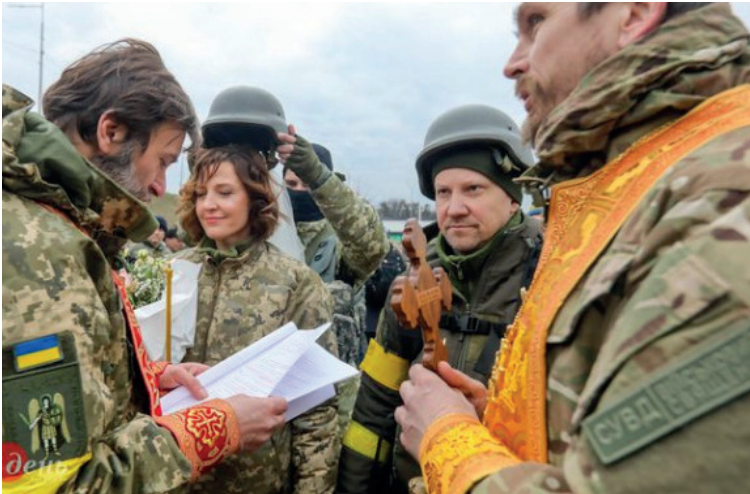
«Так, я згідна бути з ним до кінця своїх днів...»