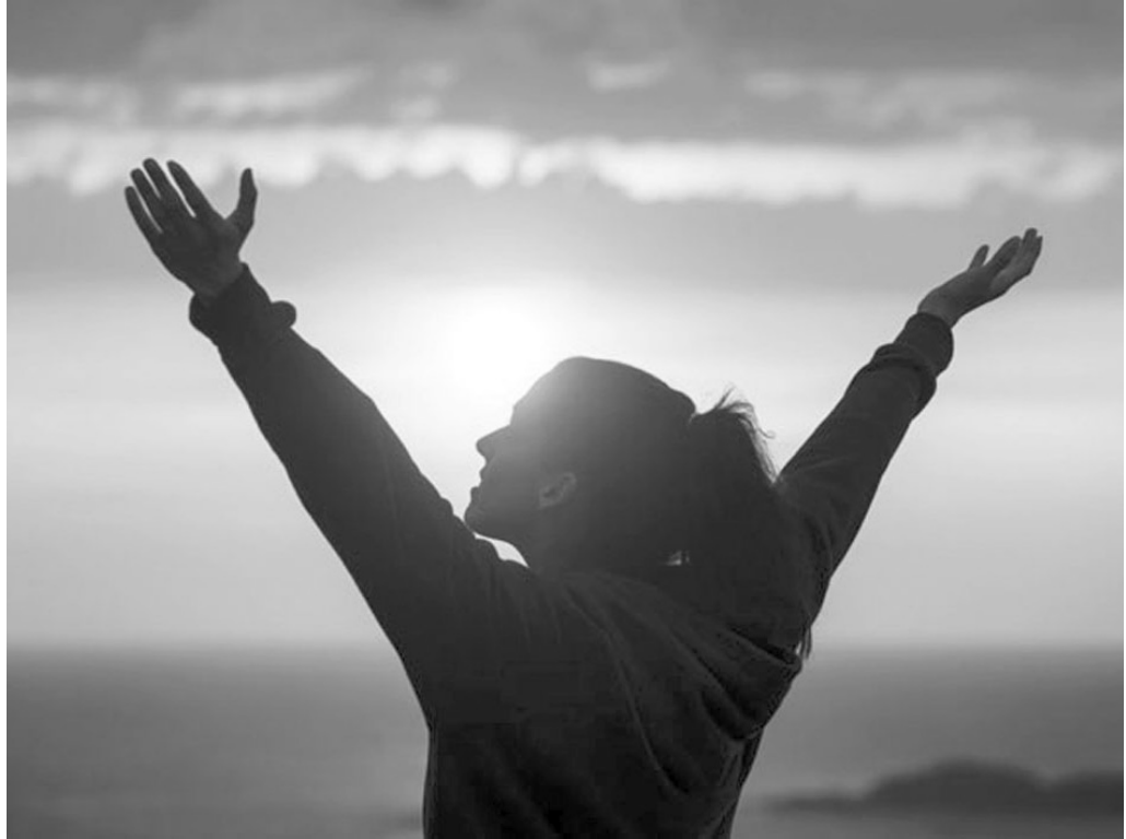
«Вона повернулась додому усміхнена...»

– Пане, я хотіла б вам допомогти, але я також бідна. Все, що я маю, – це трохи хліба і шинки, а на вечерю до мене прийде особливий гість, і я хотіла Його цим пригостити.