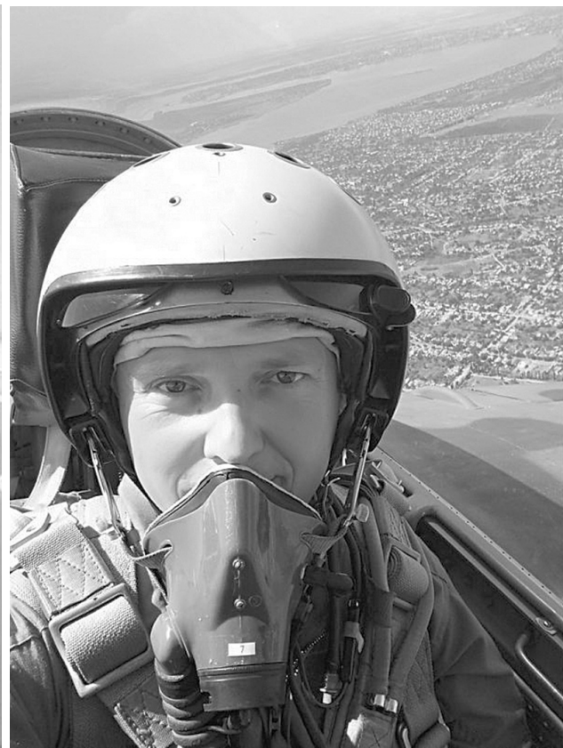
Він дійсно кайфував і від життя, і від служби.