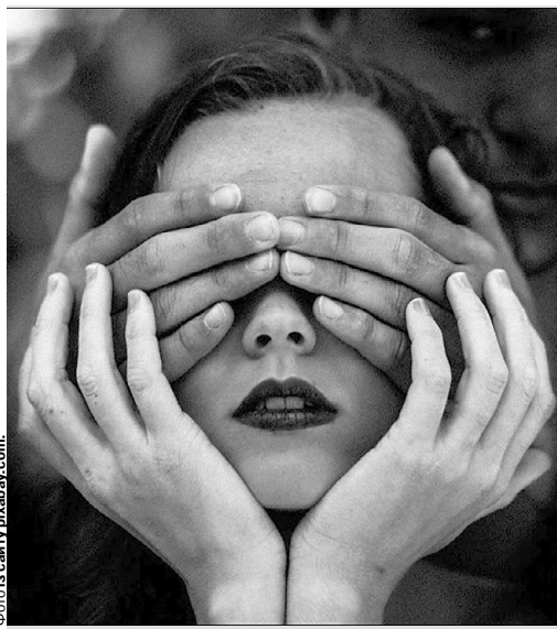
Приймати чужі помилки — це ключ до довгих і здорових взаємин.