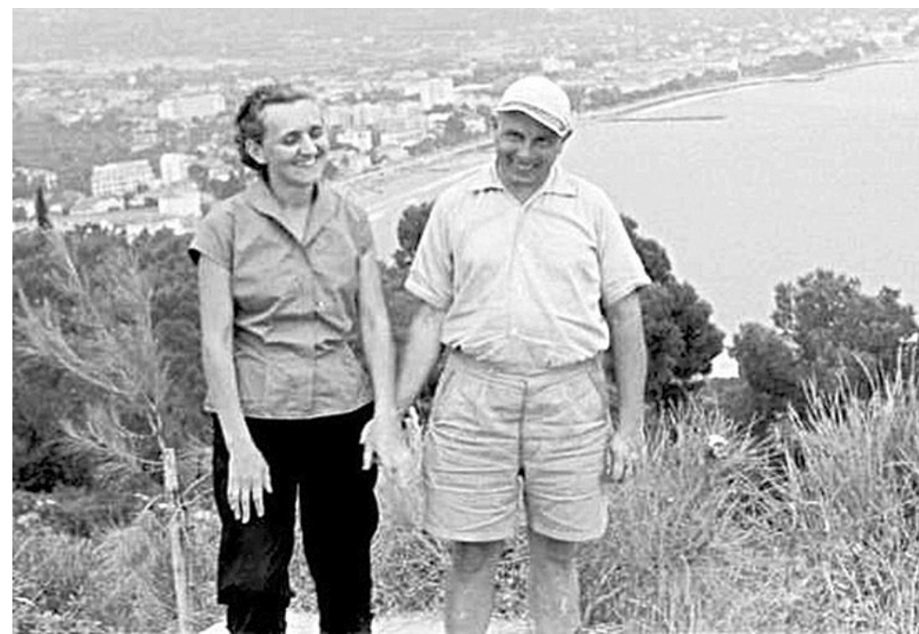
Степан Бандера з дружиною біля Женевського озера.

За матеріалами suspilne.media, lviv.znaj.ua, naskryzhalyah.blogspot.com, nta.ua.