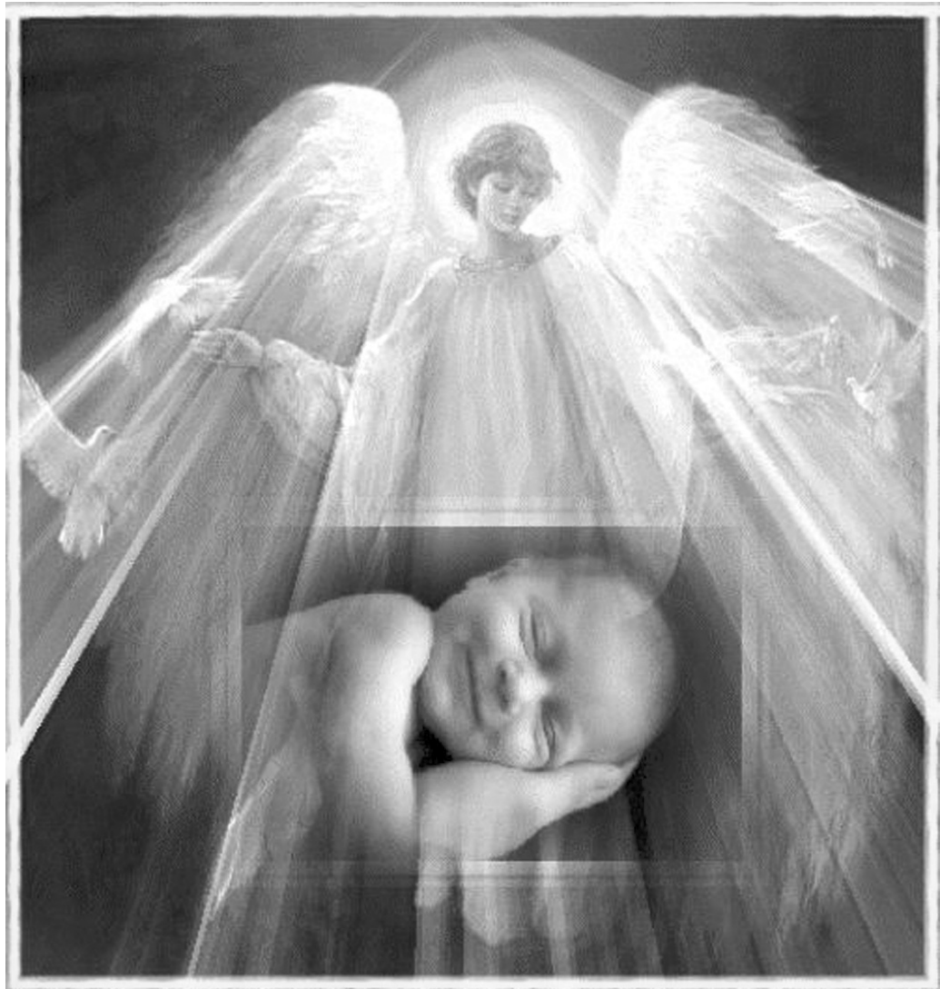
«Я хочу народити дитину».

«Ну, як вам? – хвалився Влад друзям. – Усе тестеве добро – Надьчине придане. Жазиву...». З дружиною кілька разів обе-