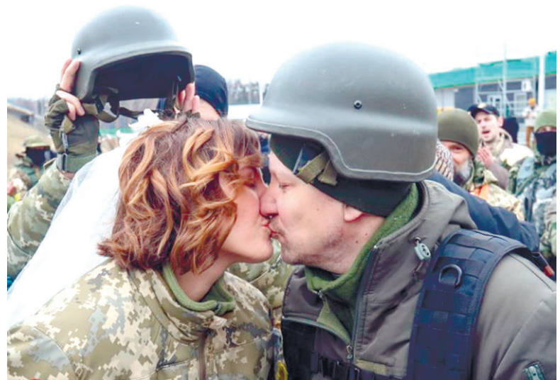
Цей поцілунок облетів увесь світ.

Замість храму – чисте поле біля блокпоста, замість вінців – військові каски, замість рушників – жовті пов'язки.