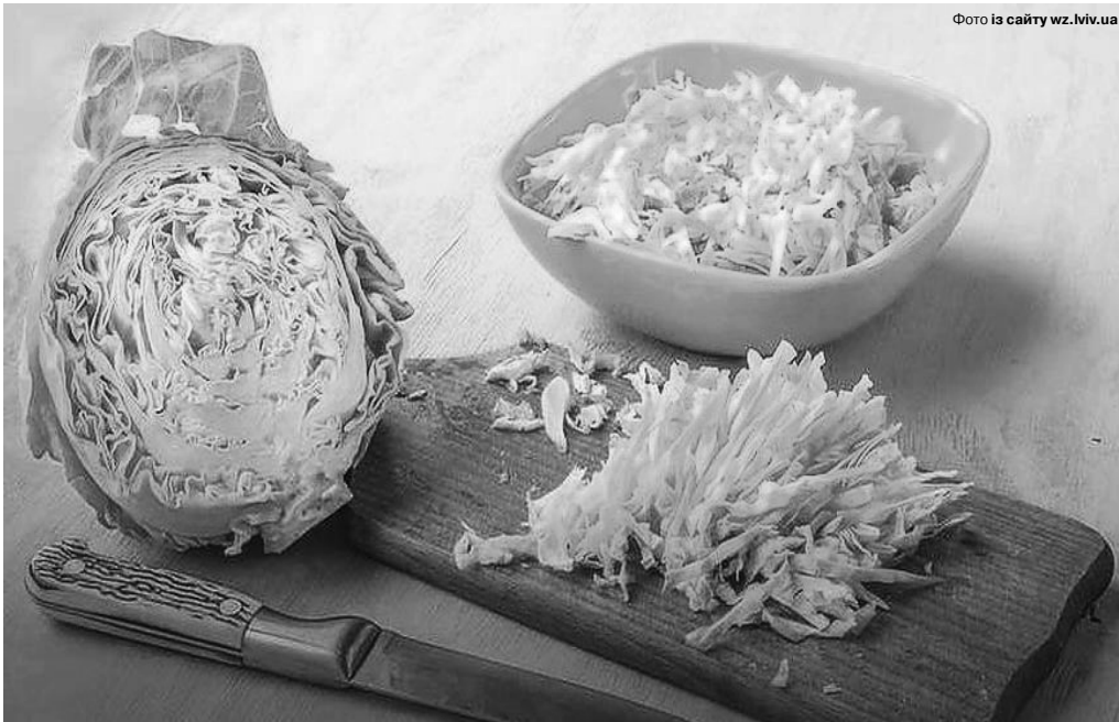
З молоді капусти можна приготувати безліч страв.

картоплини, по 1 пучку кропу і зеленої цибулі, сіль за смаком.