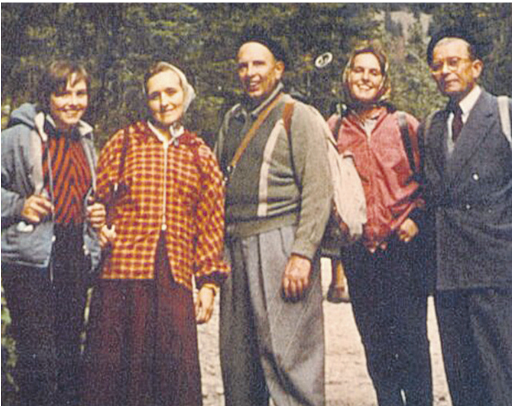
Подружжя Бандер у товаристві однодумців (жовтень 1959). Останнє прижиттєве фото легендарного українця.