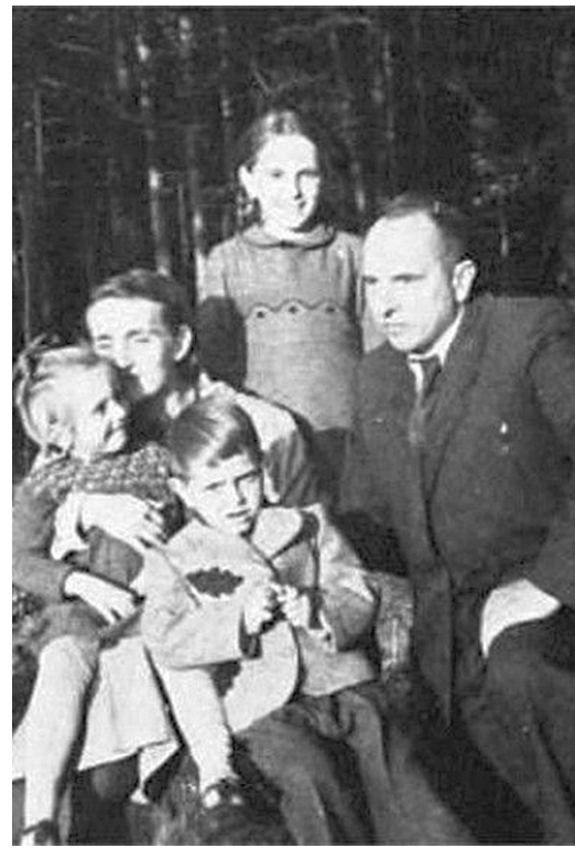
Зустріч Бандери в 1957 році з дружиною та дітьми.