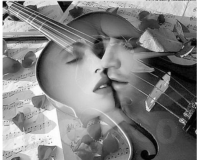
«Світи ж мені, світи мені завжди!»