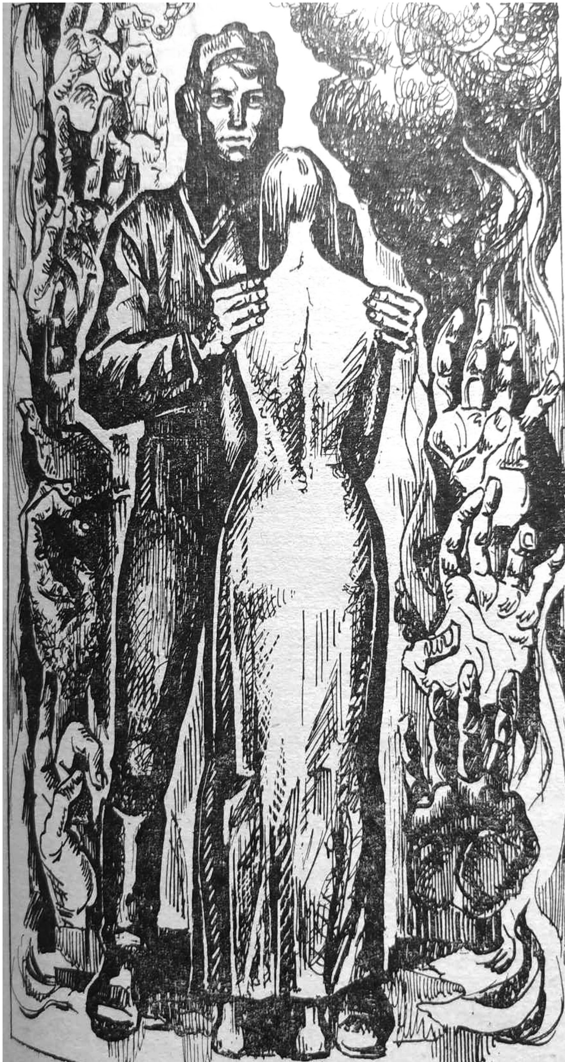
Малюнок Віктора Єфименка.