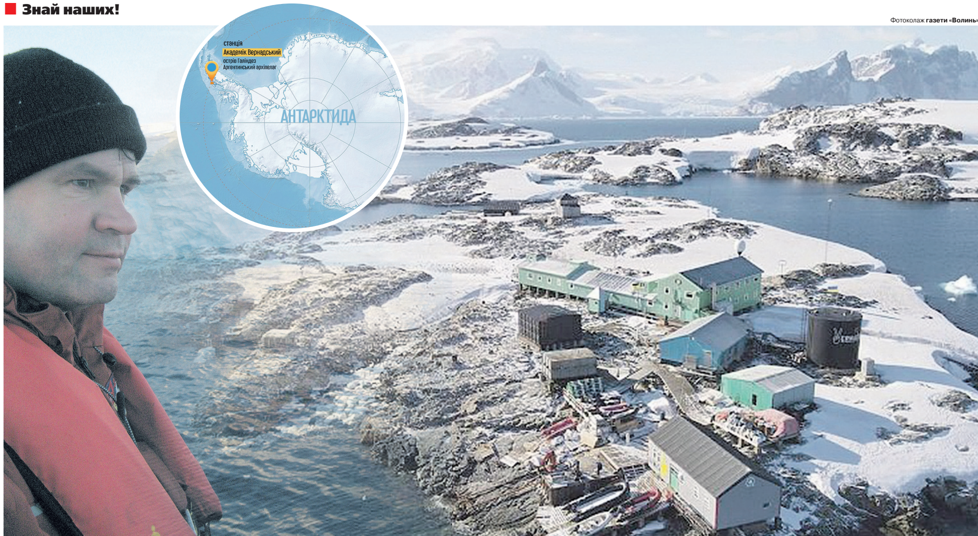
П'ять частину свого життя Богдан Гаврилюк провів серед снігів і льодів.