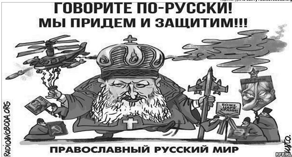
Карикатура. Бережи Боже від такого захисту!

Була б. Тільки тоді українці вкотре воювали б у російській армії, допомагаючи їй загарбувати чергові землі, як зараз це роблять якесь бурятя чи чеченці, завойовуючи українські. А так ми хоч б'ємось за свою країну. І, дасть Бог, коли пожежемо ворога, то наступні кілька поколінь українців нарешті заживуть мирно і в розвитку, а не у вічних російських війнах.