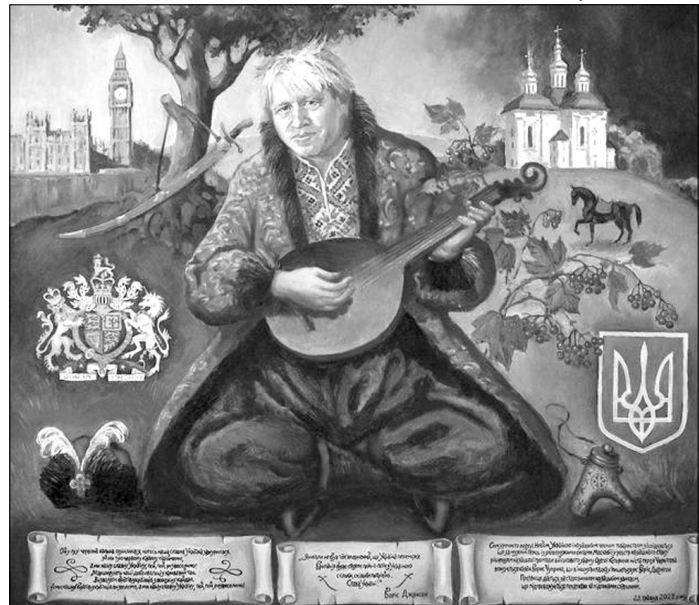
Без Бориса українцям було б набагато важче боротись з қацапо-монголо-татаро-бурятсько-чеченською ордою.