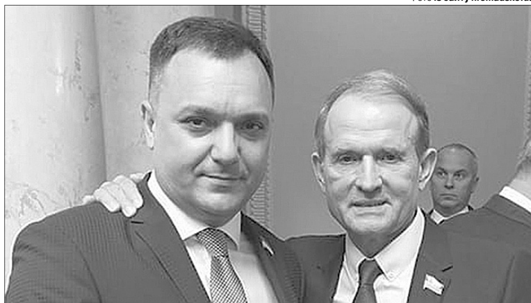
З того «рускава міра» так і пре всяка диявольщина...