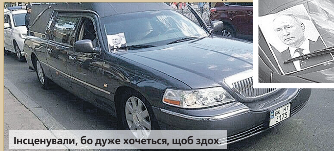
Інсценували, бо дуже хочеться, щоб здох.