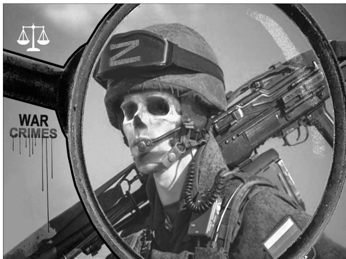
Там, де «русський мір», — там смерть...

Попри весь цей жах, опір є! Ми не коримось мовчки. Початку були велелюдні мітинги, і то дуже часто. Люди з прапорами йшли на БТРи і озброєних рашистів. Потім мітинг розстріляли,