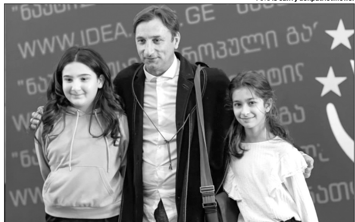
Цей учитель навчає насамперед власним прикладом!