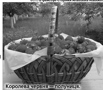
Королева червня — полуниця.

Червень щедро дарує нам ці соковиті й ароматні ягоди, тож і десерти цієї літньої пори не уявляються без трускавок. Хтось полюбляє їсти їх зі сметаною чи вершками, хтось просто кусає полуничку, тримаючи за зелений хвостик, а в когось є час і натхнення приготувати справжній кулінарний шедевр