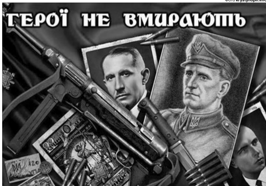
«Щоби воскресла Україна і завітала слобода».