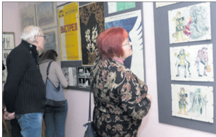
Працівники музею та гості виставки були подивовані цінністю зібраних експонатів.