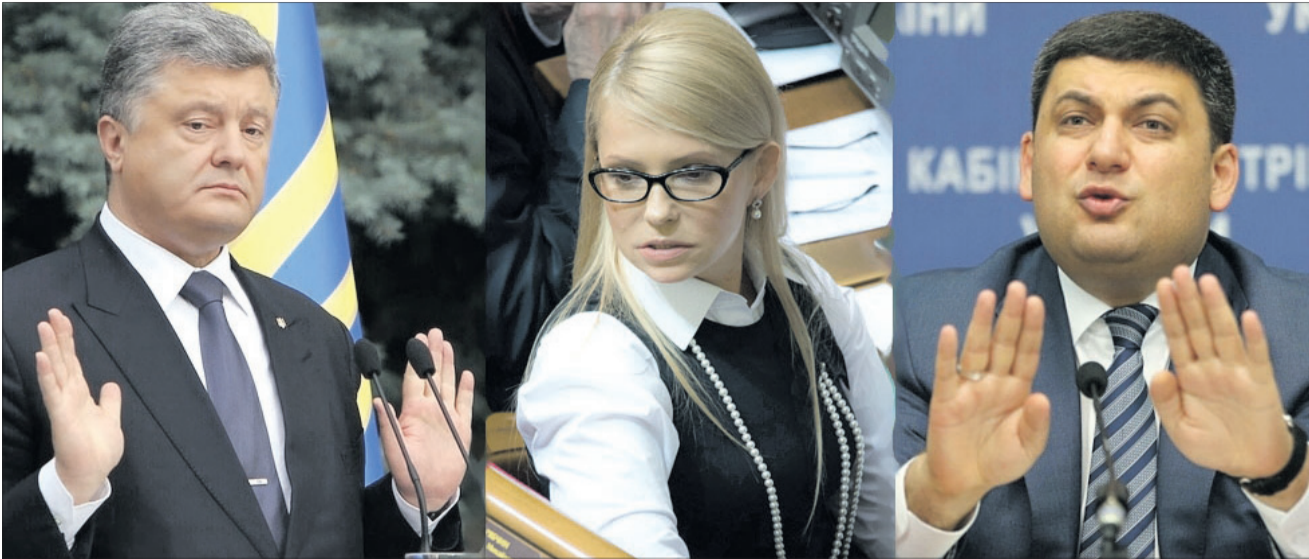
Цікаво, а чи знають вони, скільки коштує буханець хліба?