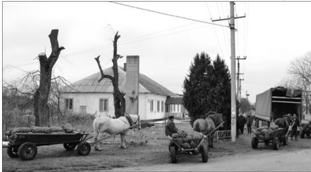
Весь центр села був запруджений підводами з картоплею.

У Полицях Камінь-Каширського району роботу знайти годі, тож люди виживають як можуть. Молодь здебільшого їде за кордон, але й про обробіток паїв не забувають. На продаж вирощують переважно картоплю, зрідка моркву або гарбузи. Хоча дві останні культури вигідніші, визнають самі поліщуки