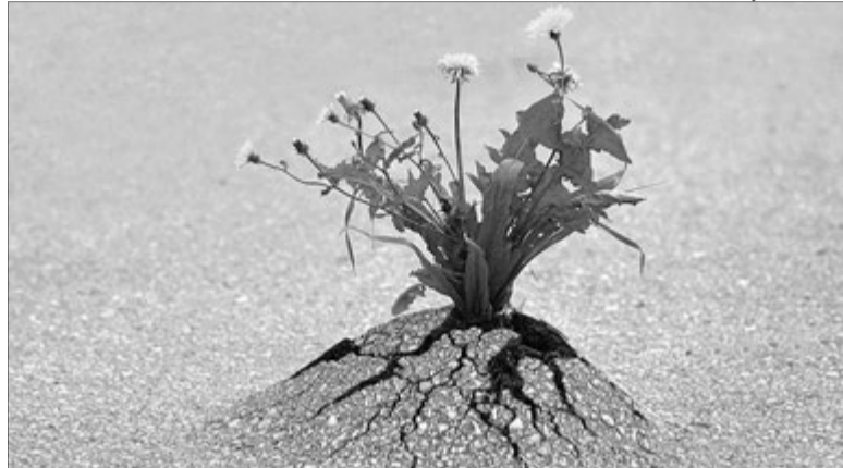
«Щоб жити – ні в кого права не питаюся» (Павло Тичина).

А письменниця планує цілу серію гостросоціальних романів, щоб допомогти молоді пережити проблеми, про які вони натякають. Батьки не можуть достукатися до підлітка, бо примус, повчання вже не проходять. Педагоги, які мають у класі понад 30 дітей, не знають, що коїться в кожній дитячій душі, часто роблять передчасні висновки і ще більше травмують душі. Єдина надія — зустріти справжню людину, яка навчить усе погане викричати, виплакати й відпустити, не тягти той багаж у майбутнє, бо ж скільки дорос-