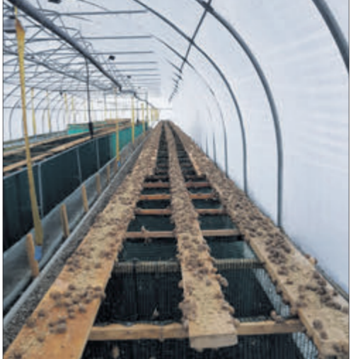
Стелажне вирощування равликів у теплиці.

церну. А під час розмноження їхній раціон збагачують морквою та гарбузами. Як і будь-які інші живі істоти, равлики можуть хворіти і гинути. Вони чутливі до екології, клімату, води. Однак при правильному догляді якихось епідемій на фермах не буває. — Романо, а як українці ставляться до споживання цих делікатесів? Чи продаєте їх на внутрішньому ринку? — цікавлюсь у підприємця. — Вітчизняні споживачі по trochu при звичаються до екзотичного продукту, тож попит на страви із цих мо-