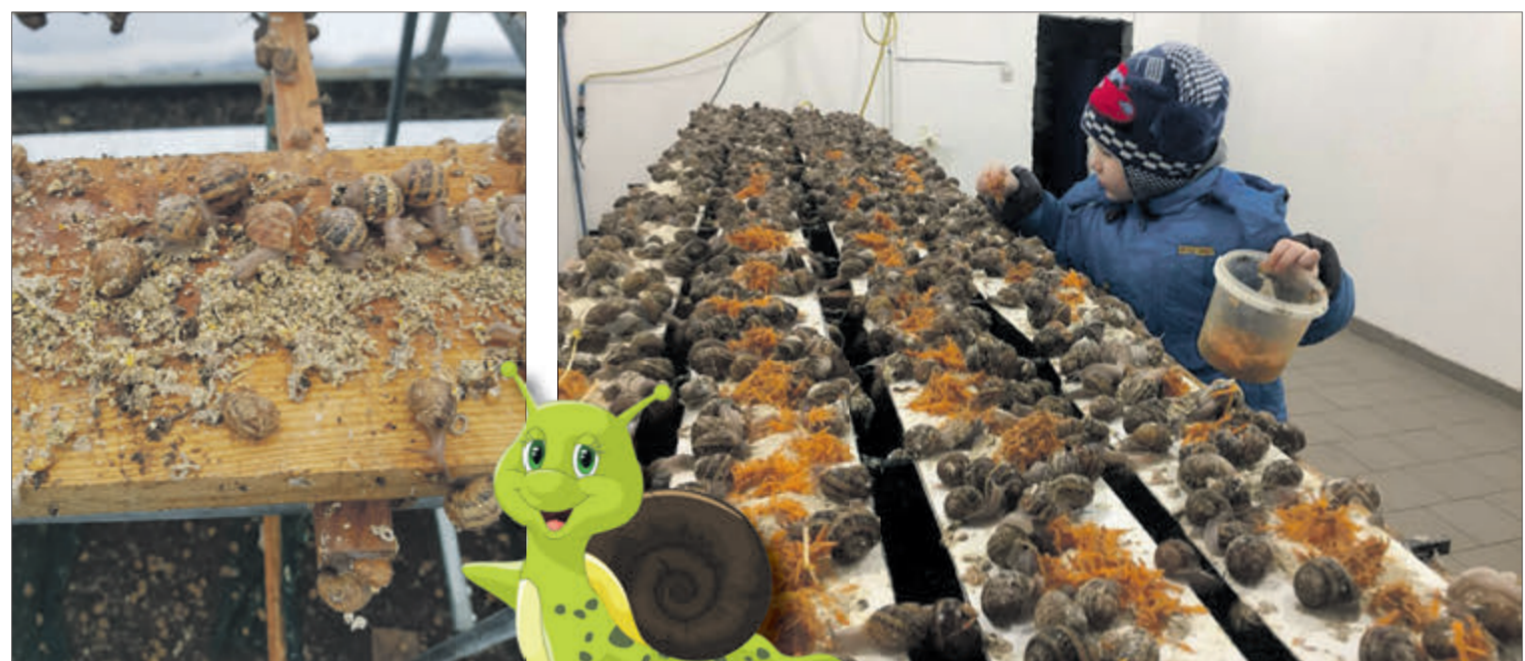
Так пасеться «мала рогата худоба». Найбільше полюбують працювати на фермі діти.