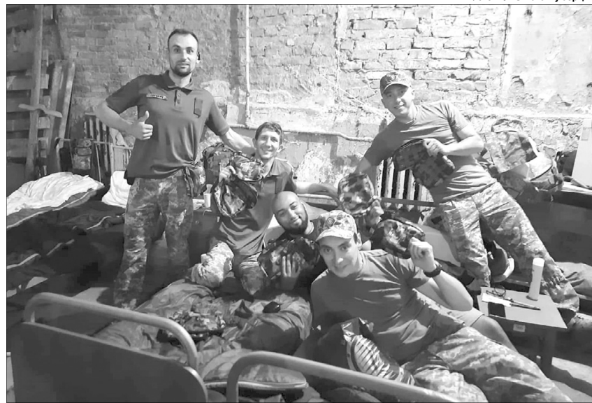
Волонтери кажуть, що ось такі світлини від військових надихають діяти далі.