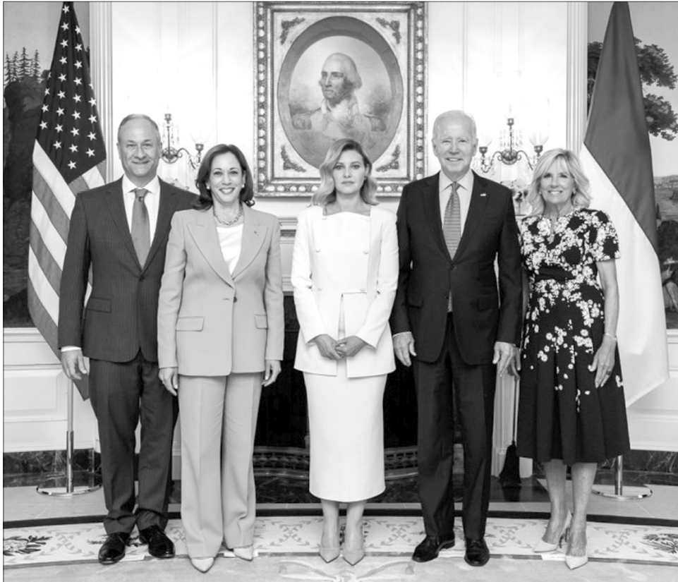
Перша леді України з першими особами США.