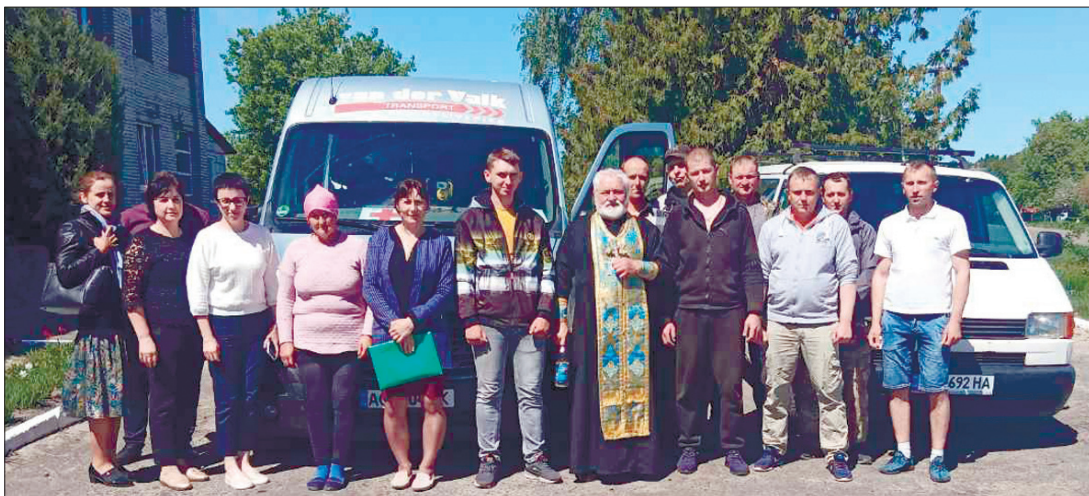
Вісім автомобілів відправили вже нуйнівці бійцям Збройних сил України.

Наразі у лікарні перебувають двоє дорослих. ■