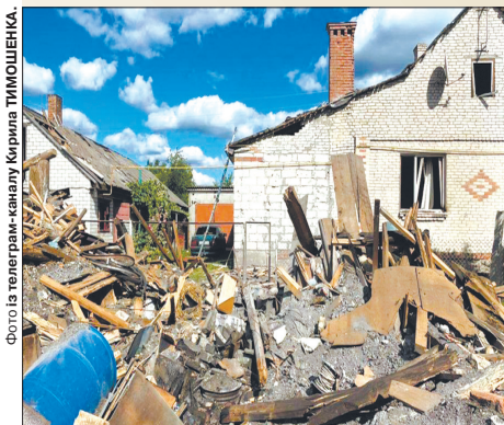
У громаді нині збирають кошти родинам постраждалих.