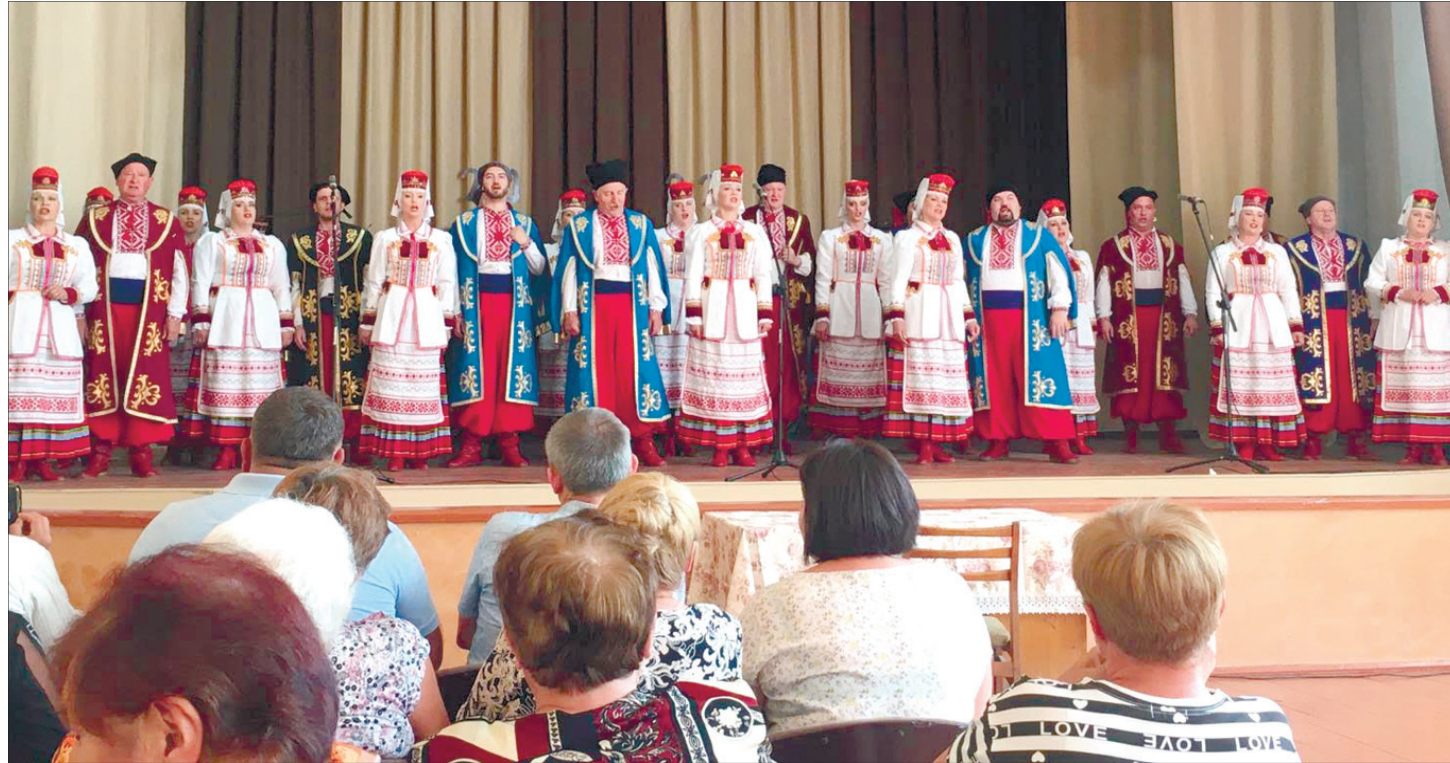
Державний академічний Волинський народний хор дарує свій спів хліборобам на сцені Печиховствієського будинку культури.