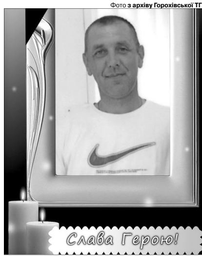
У відважного воїна залишилася дружина і двоє неповнолітніх синів.