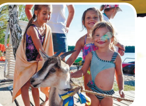
Фотознімок у компанії з Джавеліною.