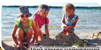
Чий замок найкращий?