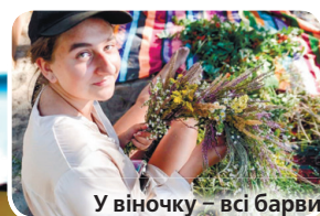
У віночку — всі барви серпневої пори.

Отак у розвагах вдалося зібрати 50716 гривень на потреби Збройних сил України.