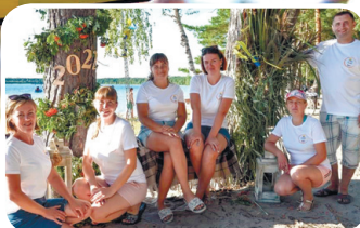
Ініціатори благодійного заходу — членкині ГО «Пісочні береги».

«Багатьох привабили патріотичний аквагрим, плетіння віночків з польових квітів та браслетів із горобини...»