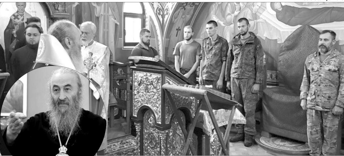
Добре, що хоч про «безбожний Захід», який «друг с другом» нас «посварив», глава московської церкви в Україні не згадав.