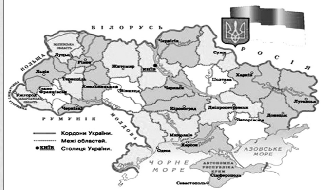
Коли наша мрія стане реальністю?