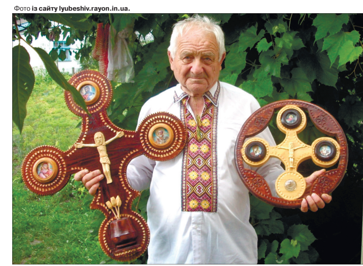
У колекції майстра — понад 1000 хрестів, вирізьблених з дерева.