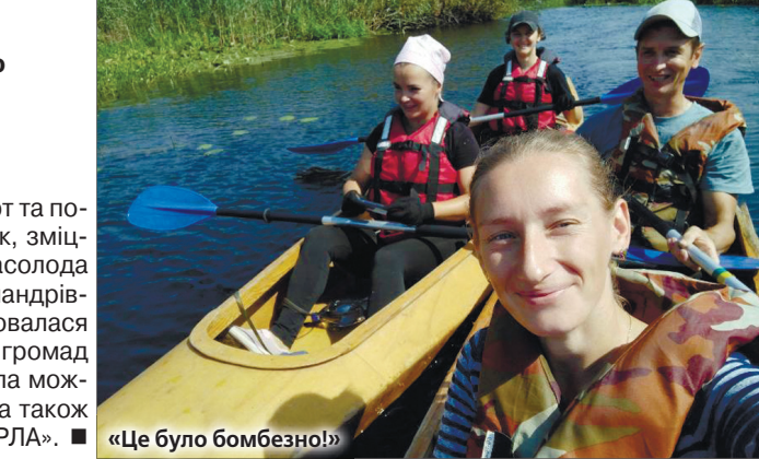
«Це було бомбезно!»

Така подорож Поліською Амазонією — це не лише фізичний гарт та популяризація активного способу життя, а й духовний розвиток, зміцнення командного духу, згуртованості, дружнє спілкування і насолода природою рідного краю. В цьому переконані організатори водної мандрівки — громадська організація «Волинський Інститут права». Здійснювалася вона у рамках проекту «Соціальна інтеграція ВПО через розвиток громад в партнерських громадах «ГОВЕРЛА» у Волинській області» та стала можливою завдяки Агентству США з міжнародного розвитку (USAID), а також щирій підтримці американського народу через проєкт USAID «ГОВЕРЛА». ■