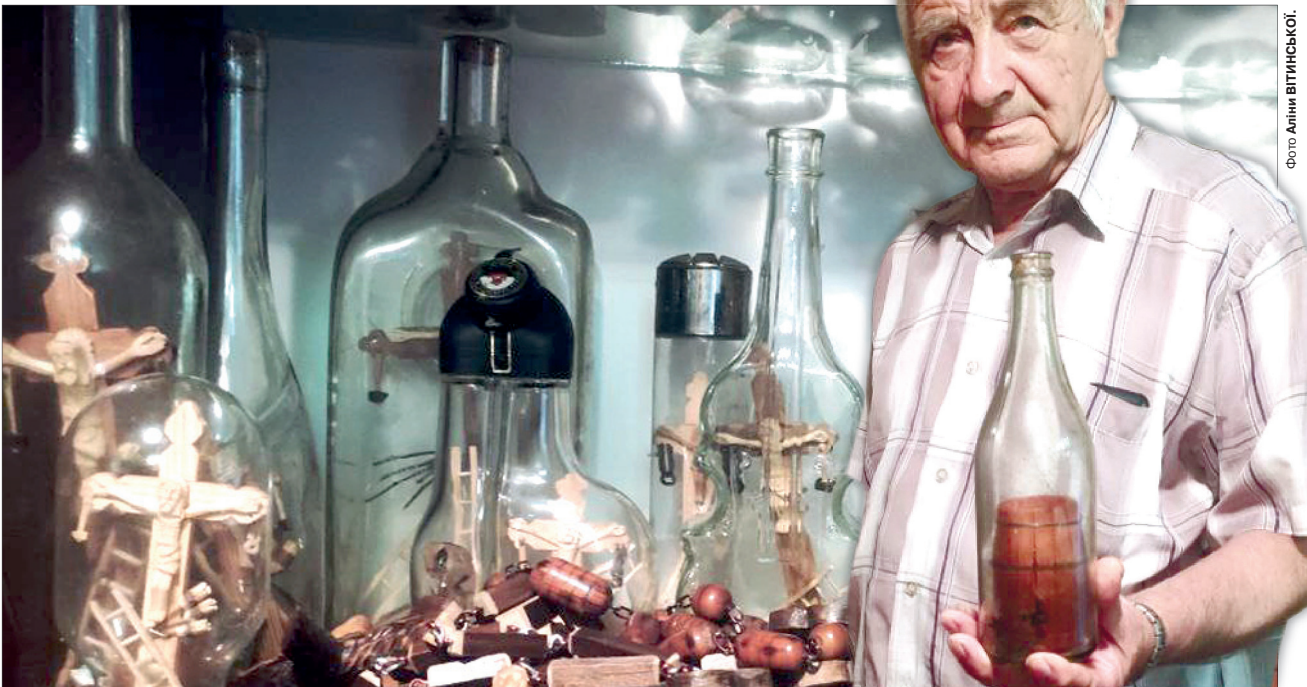
«Головне – не поспішати, тоді встигнеш», – каже майстер про своє захоплення, яке стало справою життя.