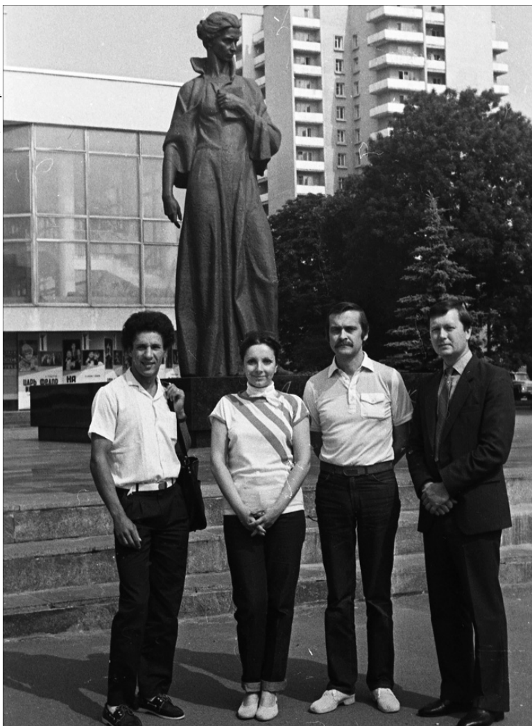
Український актор і режисер Іван Миколайчук із колегами по міжнародній кіногрупі в Луцьку (1985 рік).

ну стрічку. З монумента спадає білосніжне покривало. Звучать гімни Радянського Союзу і Української РСР. Ось вона — Леся Українка! Перед зором постає майже шестиметрова скульптура, відлита у бронзі, встановлена на гранітному постаменті. Земна і в той же час така величава! Здається, що зараз Леся зійде з п'єдесталу, ступить на широку площу, пройде вулицями нашого славного міста, увіллється в юрбу своїх земляків, за світлу долю яких вона боролась», — ділилася враженнями з читачами 45 років тому Катерина Зубчук.