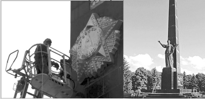
Орден советської «Победи» тепер залишиться лише у фотоархівах.