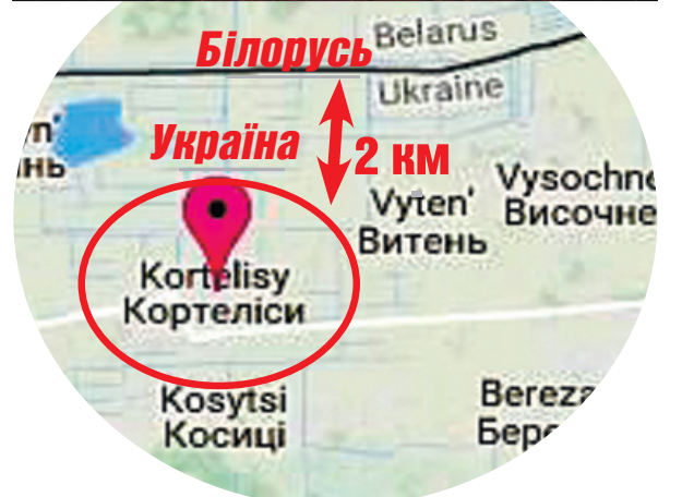
Меморіальний комплекс жертвам фашизму, відкритий у прикордонних Кортелісах в 1980 році, нагадує сьогодні про трагедію, яку пережило це село в Другу світову війну.