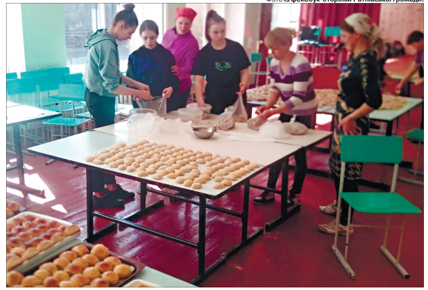
Усім селом у перші тижні війни ліпили вареники, смажили пиріжки.