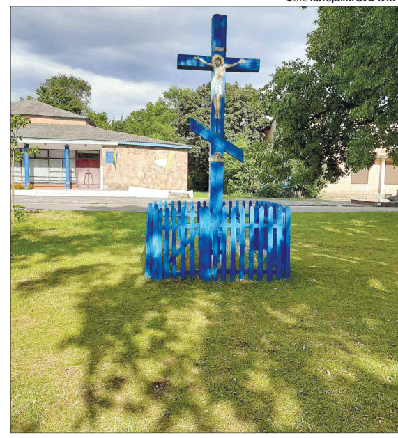
На цьому місці стояла старовинна церква, в якій у вересні 1942 року карателі влаштували криваву розправу над жителями Кортелісів.