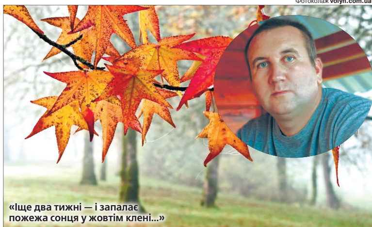
«Ще два тижні – і запалає пожежа сонця у жовтій клені...»

Осінь принесе на Волинь мінливу та вітряну погоду з помірними опадами. Принаймні така ситуація очікується у перші дні місяця. Температура – комфортна, але на початку декади буде декілька прохолодних днів (без заморозків). Далі прийде справжнє