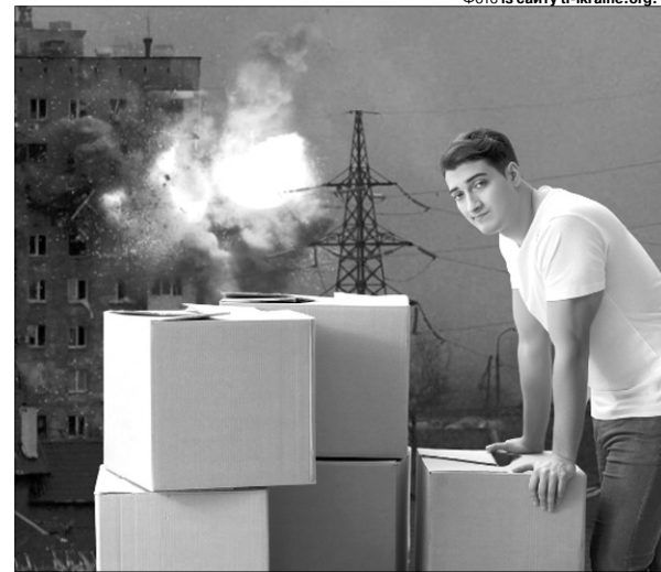
Перевізи підприємство на мирну територію, вони роблять неоціненний внесок у нашу перемогу.

та великих інфраструктурних об'єктів, які могли б слугувати цілями для обстрілів, близькість кордонів та вже зареєстрований індустріальний парк площею 20 гектарів з усіма підведеними комунікаціями.