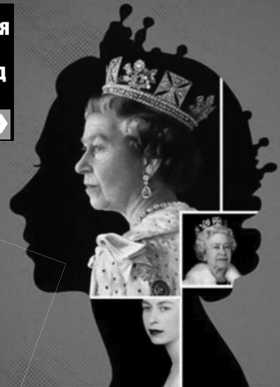
Єлизавета II правила 70 років і сім місяців — найдовше з усіх британських монархів.

«За роки правління Єлизавети II відправила понад три мільйони листів.»