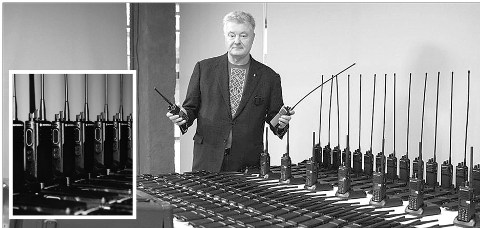
«Ці радіостанції — скарб для наших воїнів на фронті».

Петро Порошенко передав парамедикам батальйону «Госпітальєри».