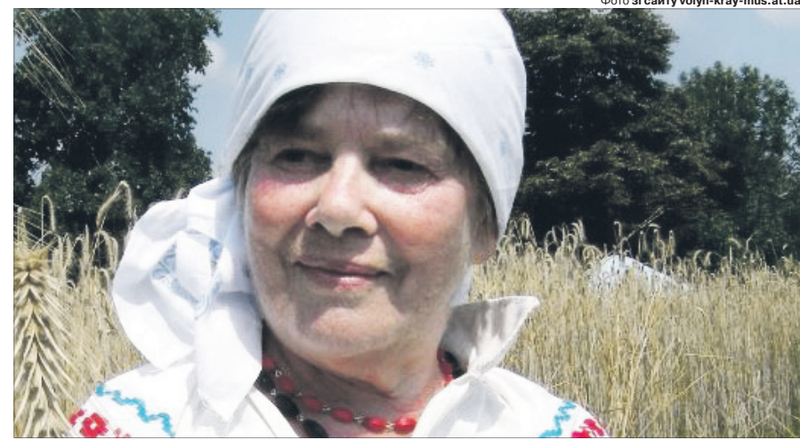
Хустка — це атрибут заміжньої жінки, яка, за українською традицією, щодня мала бути з покритою головою.