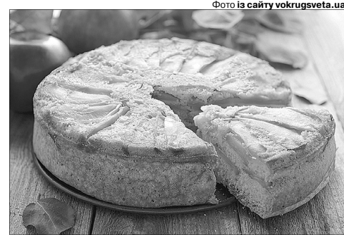
Така випічка з яблуками — завжди безпрограшний варіант.

З приводу виникнення назви «шарлотка» досі точаться дискусії. За однією з версій, вона походить від імені Шарлотти, дружини англійського короля Георга III. За іншою — її пов'язують із коханням: молодий кондитер до безтями закохався в дівчину Шарлотту, і, щоб привернути до себе увагу, назвав на її честь придуманий ним рецепт пирога з яблуками... Та як би там не було, цей десерт справді вартий уваги