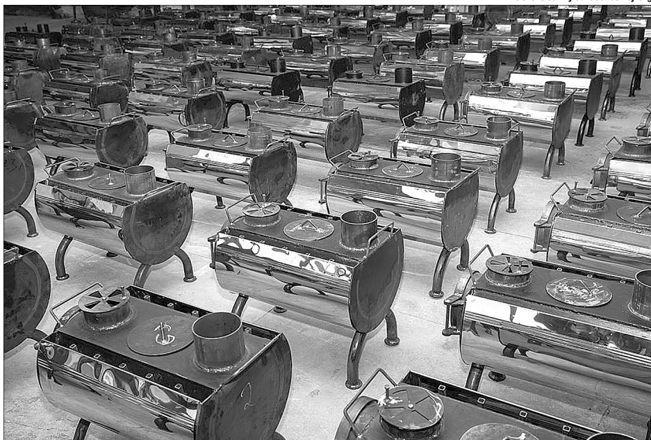
Такі пічки-буржуйки потрібні в кожному окопі, в кожній землянці.

Днямими Порошенко разом із послом Естонії Каймо Кууском побував на випробуваннях безпілотної роботи THeMIS для евакуації поранених. Унікальну машину, яку виробляють в Естонії для армій країн-членів НАТО,