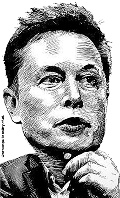
А ще недавно Ілон викликав Путіна на бій за Україну... Програв без зброї?