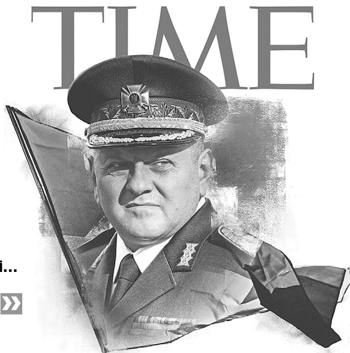
Бути на першій сторінці Time — це світове визнання. І назва статті з одного слова — «Генерал» — красномовне цьому свідчення.

А щодо тактики росіян, то нею головний український військовик залишився задоволений, адже ворог, наразившись на опір, не шукав інших підходів: «Вони просто кидали своїх солдатів на за-