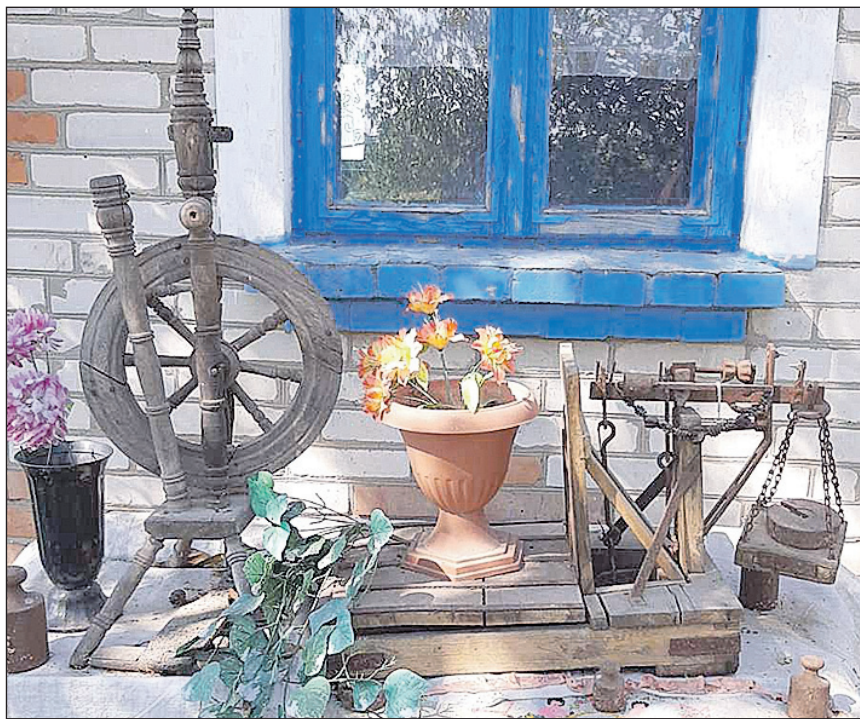
Під літньою кухнею в Онишкевичів — ось такий музейний куточок, облаштований господинею, у якій романтична натура.

Вісім років тому боліла душа батьків за синів, біля яких ходила смерть, і зараз, коли йде повномасштабна війна, думка про них і вдень, і вночі. Просять Бога, щоб уберіг їх. Жінка, як висловилася, з мобілкою не розлучається, хоч раніше клала телефон десь у хаті й забувала про нього