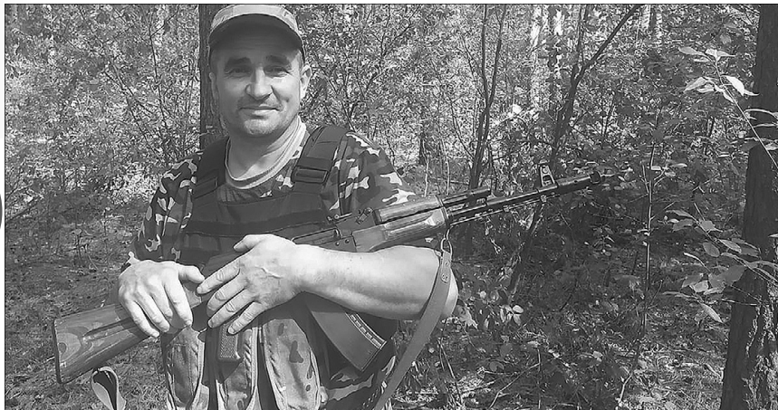
Фото з фейсбук-сторінки 100-ї окремої бригади територіальної оборони.

А вранці 24 лютого 2022-го швиденько склав найнеобхідніше