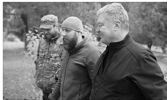
«Цей тренажер суттєво підвищує якість підготовки операторів ПЗРК — переносних зенітно-ракетних комплексів».

ко. — Я переконаний, що нам вдасться виконати поставлені завдання. Дуже дякую вам за службу — і разом до перемоги», — наголосив п'ятий Президент.