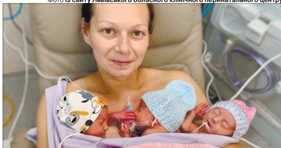
Ростить здорові, «поспішайки!»

У Львівському обласному клінічному перинатальному центрі виходили трійню, яка народилася передчасно