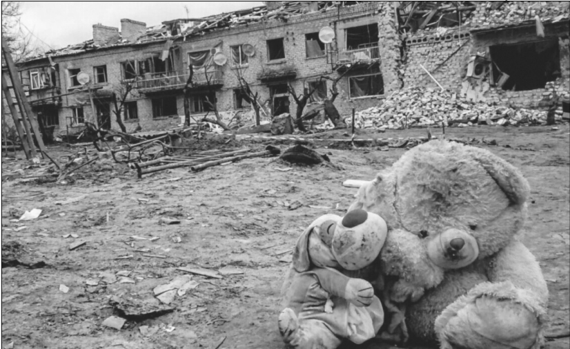
Через російські бомбардування й обстріли на початок листопада в Україні пошкоджено 2 719 навчальних закладів, 332 із них зруйновано повністю.