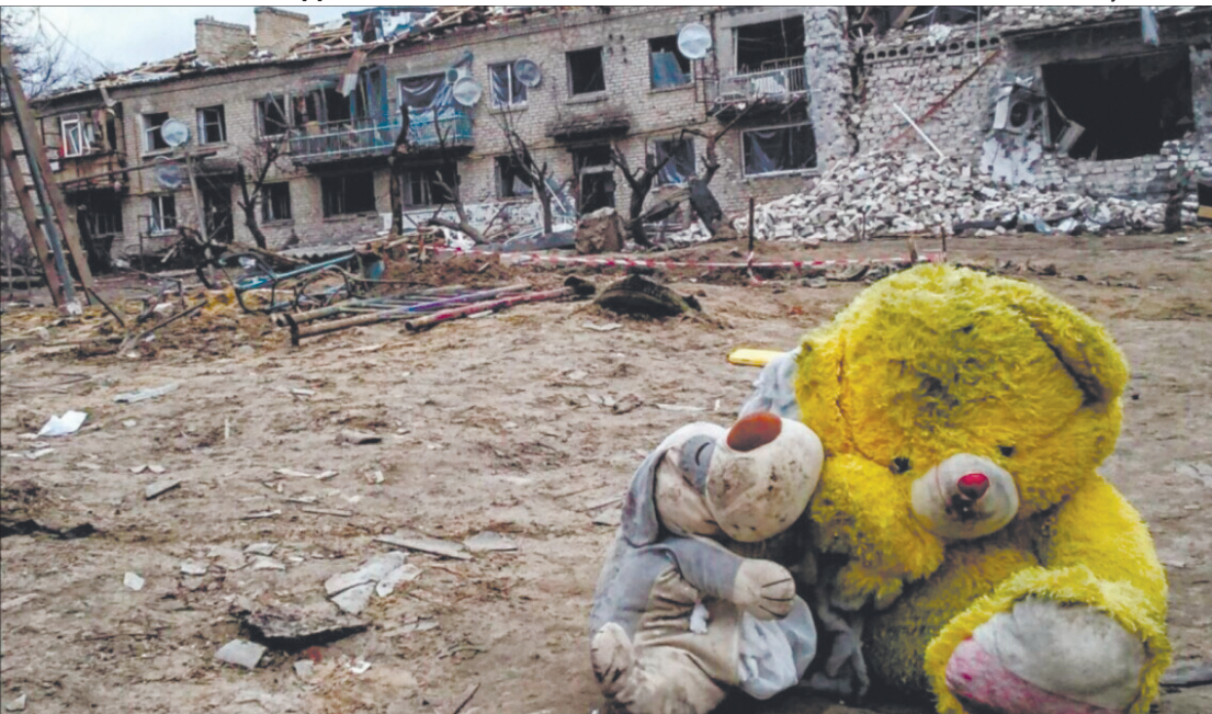
За даними офісу Генпрокурора України, на ранок 3 листопада росіяни вбили в нашій країні 430 дітей, поранили – 826.