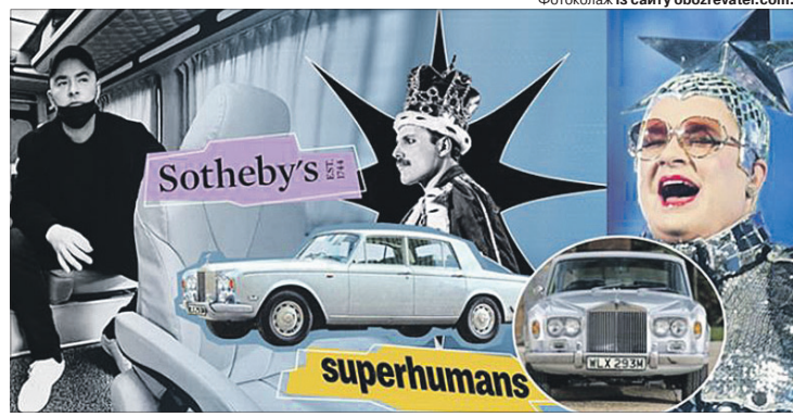
Фотоколлаж із сайту obozrevatel.com.

Машину придбали за 11 мільйонів гривень. Виторгувані від продажу раритетного автомобіля гроші передадуть для створення в Україні на базі однієї з лікарень Львівщини сучасного центру реабілітації та протезування