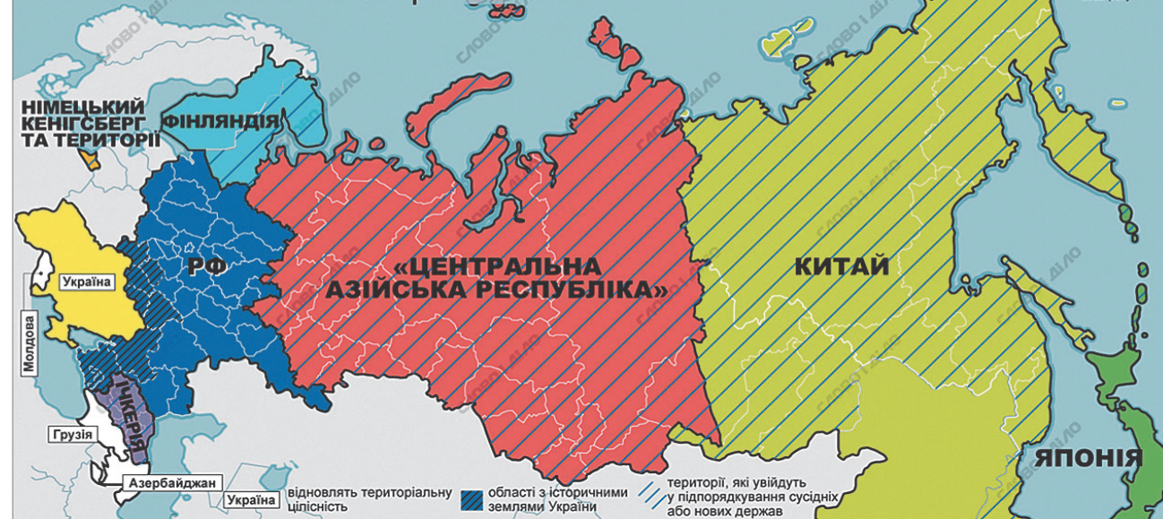
Класно, звісно, було б...