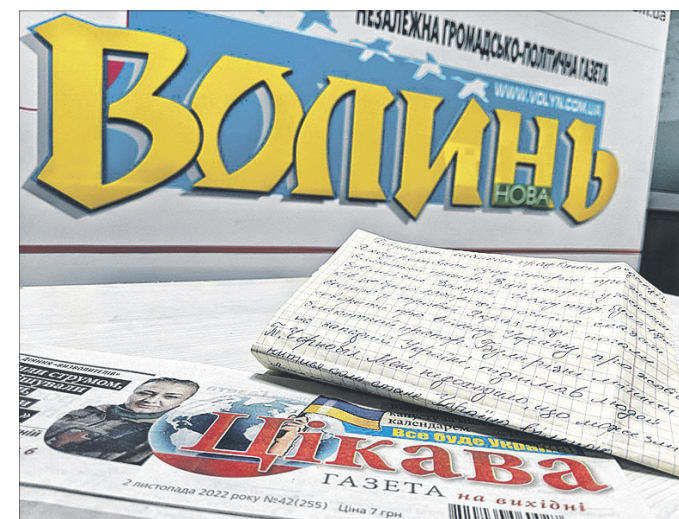
Шановні читачі! Редакція чекає і ваших цікавих історій.