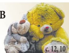
с. 12, 10

Під час обстрілів 6-річна Аделіна почала сивіти