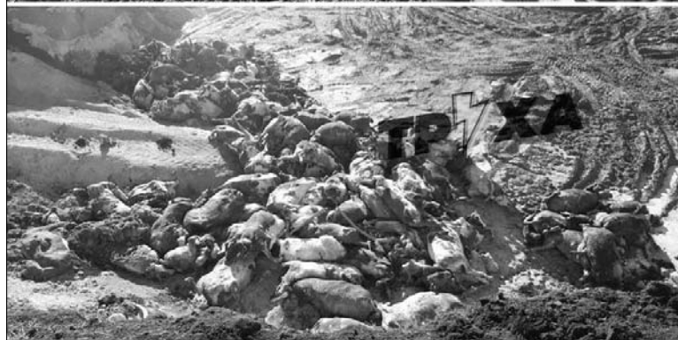
Ось яка картина постала на фермі, коли її залишили окупанти.

Були випадки, що лежить корова, яка ще вчора ходила, а в неї відрізана або нога, або частина тулуба. Просто вбивали корів, відрізували частини того, що їм найкраще смакує. І так залишали.