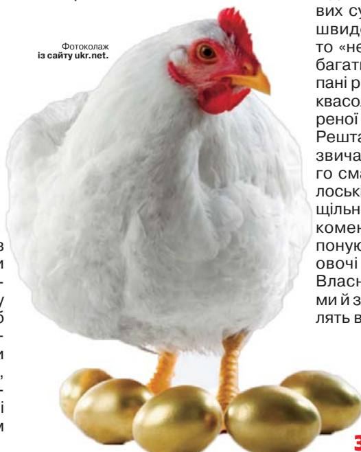
Фотоколаж із сайту ukr.net.

у пригоді», – таке повідомлення написала одна пані в соцмережі, тут же зібравши понад 1000 коментарів.