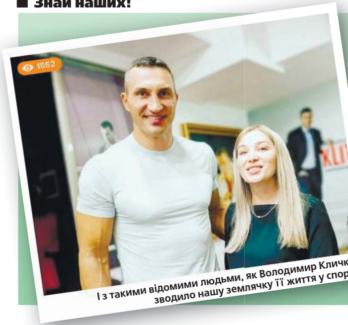
І з такими відомими людьми, як Володимир Кличко, зводило нашу землячку її життя у спорті.