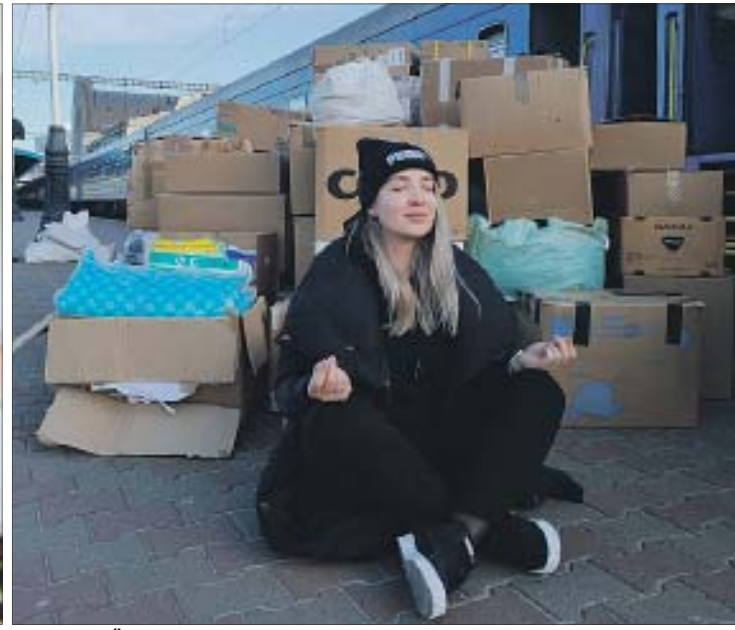
Її кликали за кордон — в безпечніше місце, а вона з чоловіком вирішила нікуди не виїжджати з України й взялася за волонтерство.