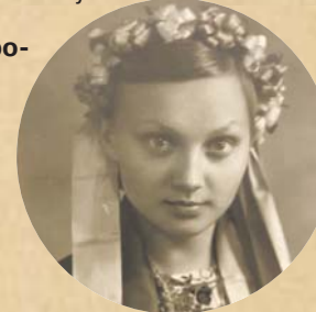
Писана красуня... Тепер навіть на подіумах таких мало знайдеш.

Від меча й загине! Ми не станем на коліна! Козаки, тримайтесь! Україна наша вільна! З нами Бог! Єднаймося!»