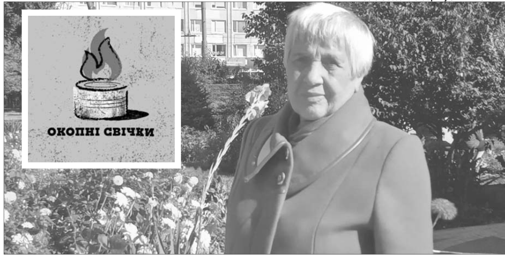
«Усі ми хочемо найшвидше вигнати з нашої рідної землі цих варварів і дочекатися Перемоги».