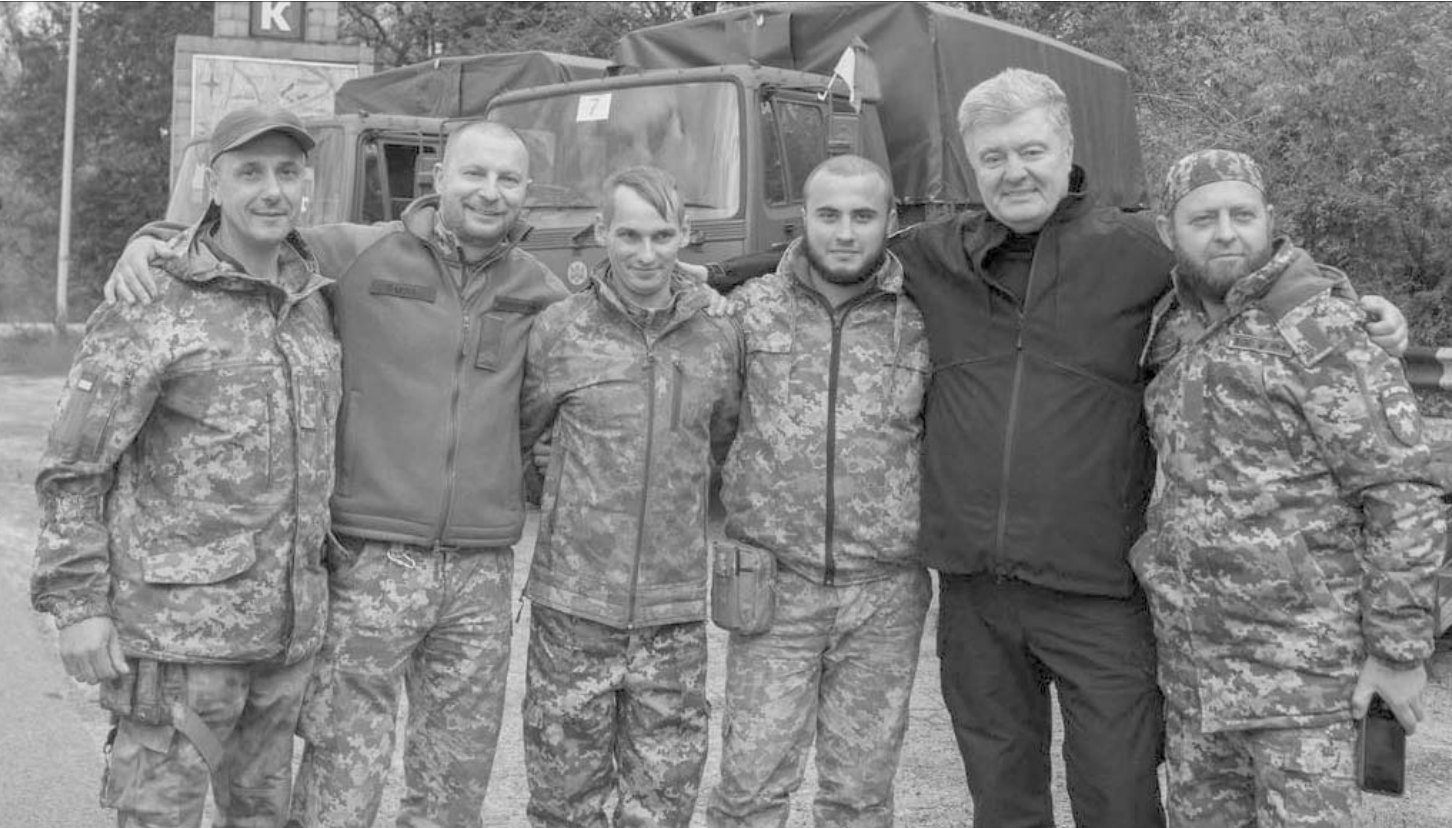
Кому ще «волонтерку» особисто доставляє п'ятий Президент?