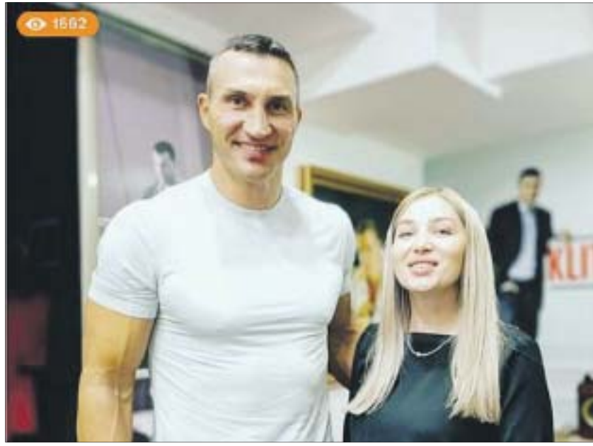
Світлина на згадку про зустріч із українським професійним боксером Володимиром Кличком.