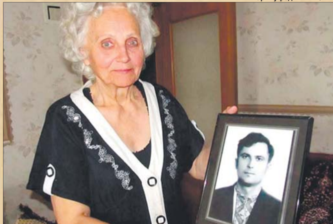
«Уже 26 років, як я без другого крила...».