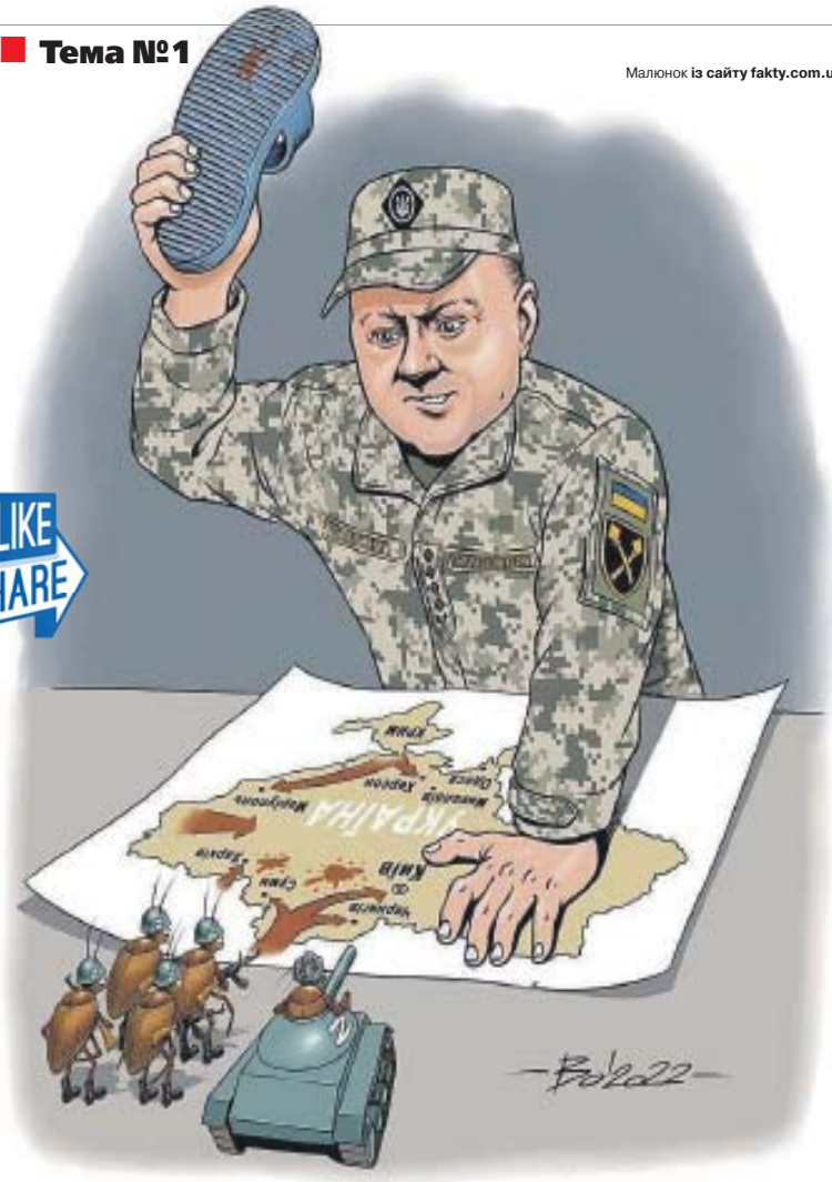
А фейсбук-спільнота тим часом пише захопливі коментарі про головного нашого воїна. Серед них є і такий: «Мертвий москаль нам дуже потрібний! З днем народження, пане Залужний!».