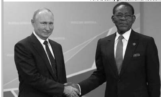
Не дивно, що їй пуйло йому тисне руку...