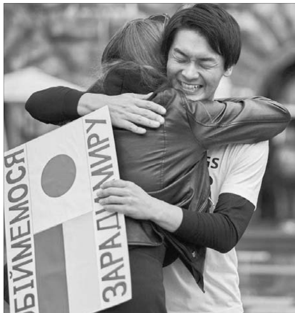
Молодий чоловік із Країни сонця, що сходить, на власні очі переконався, що війна в Україні — це не просто новини по телевізору, а реальність.