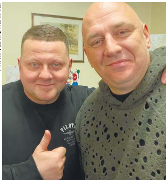
Худі в дірках, у яке вбраний артист, трохи нагадує маскувальну сітку.

А той факт, що після повномасштабного нападу росії довго перебував за кордоном, пояснив проблемами зі здоров'ям: «У мене був COVID-19, потім отит, а після цього синдром Рамзі Ханта, який був у Джастіна Бібера, він навіть зараз зупинив тур. Це параліч обличчя, нервів. Така важка штука. Але я дивився на хлопців, які воюють, і зрозумів: який параліч, про що казати... Тому всі ці місяці працював без упину, від Польщі до Латинської Америки, даючи концерти та збираючи кошти для України, – сказав Потап і наголосив: – Я викреслив російську мову повністю зі своїх нових пісень».