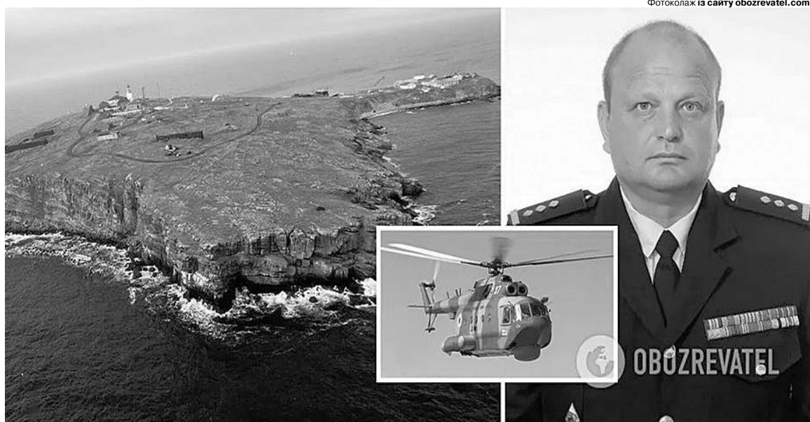
Політ на острів Зміїний для легендарного вертольотчика став останнім.