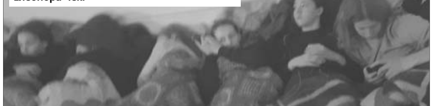
Волонтери в перший же воєнний вечір завезли до укриття матраци та воду. Проте тренерка розуміла: треба вивозити дітей.