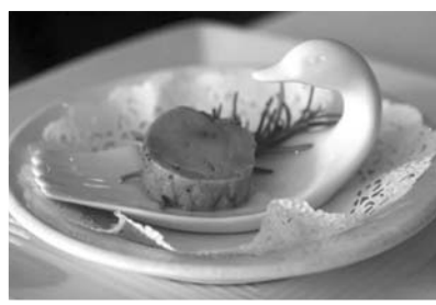
Фото із сайту bbc.com.