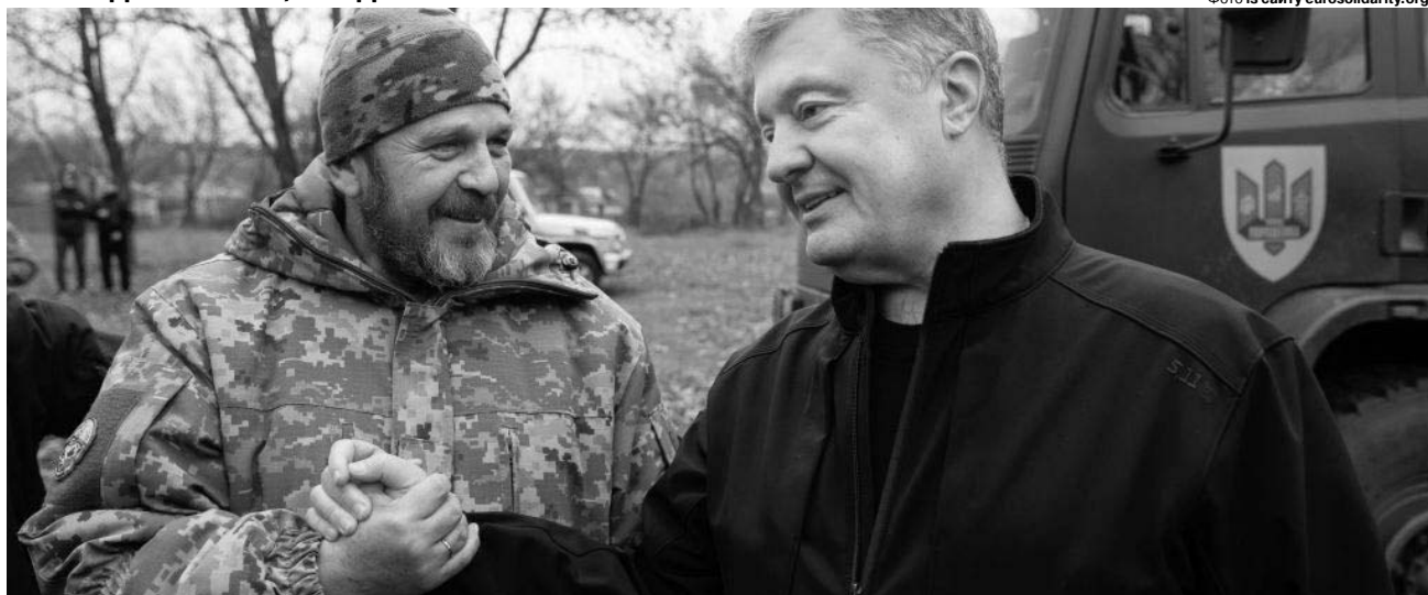
«Зустрічі на фронті – завжди емоційні, кожна з них особлива».