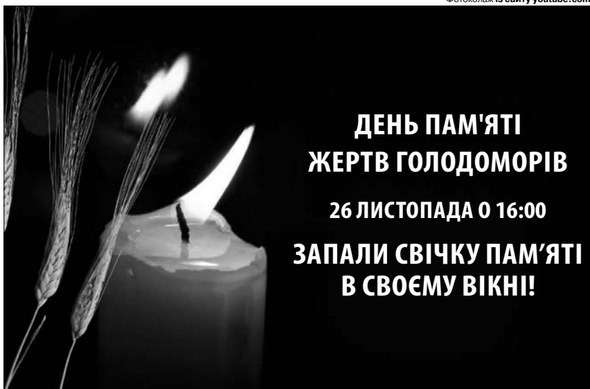
Фотоколлаж із сайту youtube.com.

Потім йшла й собі і подовгу сиділа біля вікна, дивлячись на дорогу. Випав сніг і дорога ледь позначалась, так