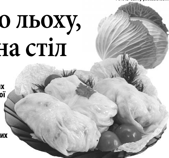
Недарма ж голубці – одна з найпопулярніших страв української кухні.

Якщо й ви вже зібрали з городу чималі листаті головки, можна приготувати одну з найулюбленіших і найпопулярніших страв української кухні. Рецептів цього найдку дуже багато, тож є з чого вибирати: і святкові, і пісні, і з м'ясом, і з картоплею, і з грибами... Маємо надію, що і якийсь із запропонованих у добірці варіантів припаде вам до смаку