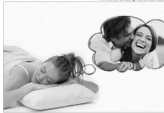
А суботній сон може справдитися вже до обіду...