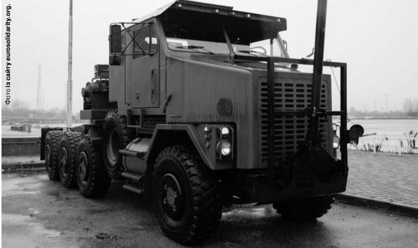
Серед «волонтерки» – і найбільший у світі тягач Oshkosh M1070.

«Допомога, яку привіз Фонд Порошенка, дуже потрібна. Нам доставили два військових DAF, це якраз для мінометників те, що дуже потрібно. І нам привезли броньований «Мерседес» – для хлопців, які виїжджають на передову, ведуть активні бойові дії, тобто для наших груп. Це дуже велика допомога», – розпові-