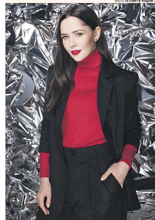
«Мені довелося докласти неабияких зусиль, аби вивчити мову».