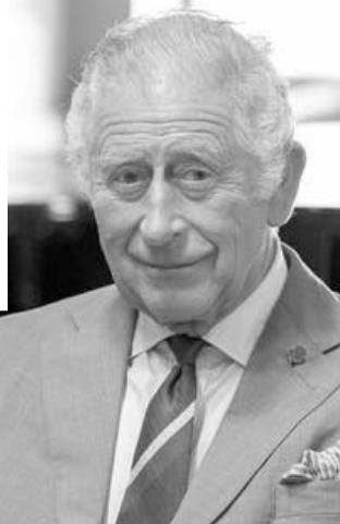
Британський монарх віддавна вважається прихильником екологічного способу життя.