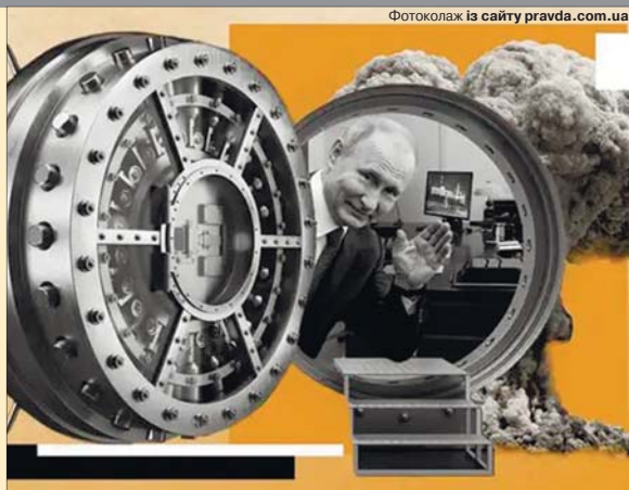
Фотоколаж із сайту pravda.com.ua.