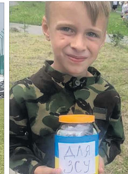
Зрозуміло усім: «Для ЗСУ».