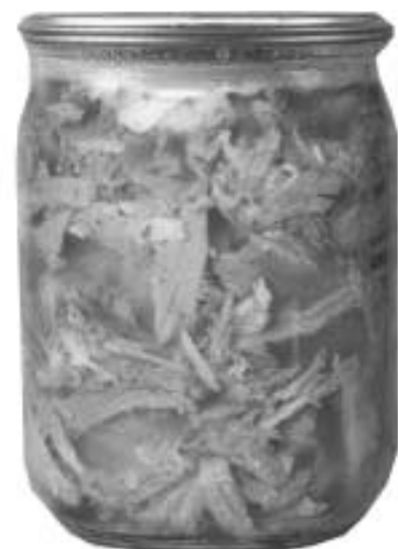
Кілька таких слоїчків мусить бути в комірчині про всяк випадок.

ємо воду з сіллю, доводимо до кипіння. Сало (можна брати з м'ясним прошарком) ріжемо на шматки й укладаємо в чисті банки. На кожен слоїк кладемо по 3 зубчики часнику, 1 лавровому листку, по кілька штук чорного і запашного перцю. Заливаємо гарячий маринад, накриваємо кришками і стерилізуємо в каструлі протягом 2 годин з моменту закипання. Закручуємо кришки, перевертаємо і залишаємо до повного охолодження. Щоб сало добре застигло, охолоджені банки ставимо в холодильник, потому переносимо на зберігання в підвал або в комору.