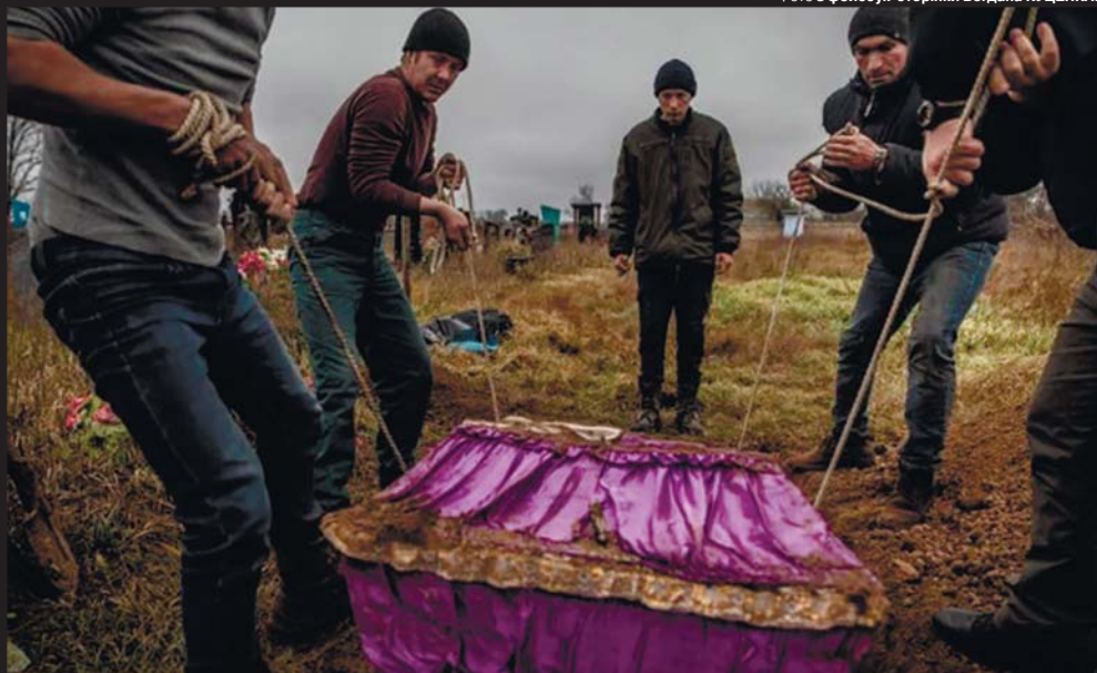
У невеличкій бузковій труні були саме ті речі, в яких убили дівчину. Зверху шар тканини і сукня, яку просто поклали її прийомні батьки, що гвалтували її з 10 років...