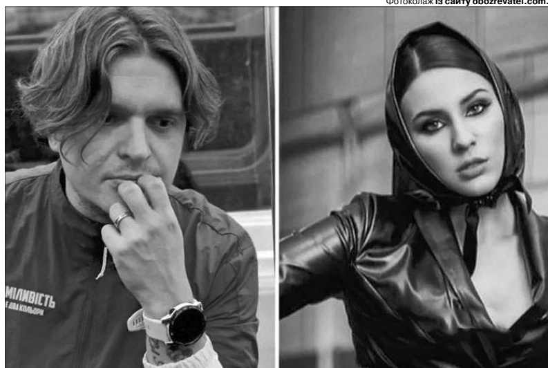
Анатолій Анатоліч: «Викидати непотріб типу MARUV зі своїх плеєрів, зі своєї голови і зі свого життя».