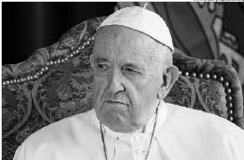
Цікаво, а який у Папи зв'язок із кремлем?

Цікаві заяви. Хочеться відповісти шанованому понтифіку. Буряти – буд-