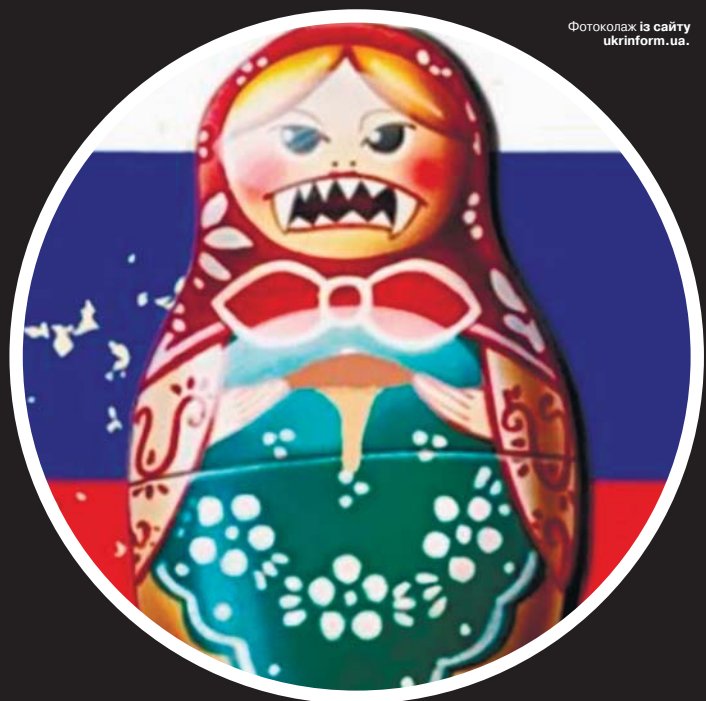
Фотоколаж із сайту ukrinform.ua.