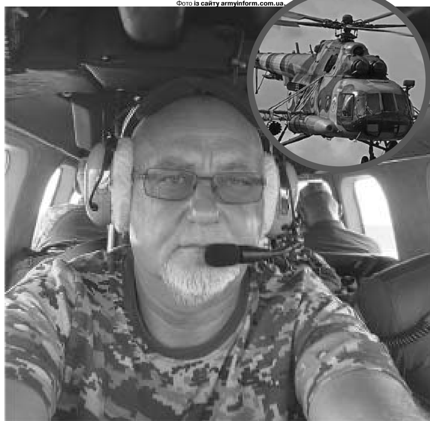
«Він собою хотів усе небо захистити».