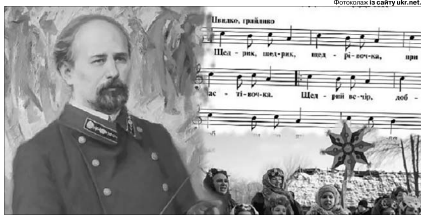
Перша обробка «Щедрика» Миколою Леонтовичем (1877 – 1921) була зроблена в 1901 році, друга – у 1906–1908 роках, третя – 1914-го, четверта – в 1916-му, п'ята – 1919-го.

На концерті з нагоди сторіччя прем'єри «Щедрика» перед багатотисячною аудиторією в залі та онлайн виступили український дитячий хор «Щедрик» із Києва, український хор «Думка» з Нью-Йорка, хор «Трініті Вол-Стріт». Особливим сюрпризом стали ведучі: культовий режисер Мартін Скорсезе та американська акторка українського походження Віра Фарміга, а також