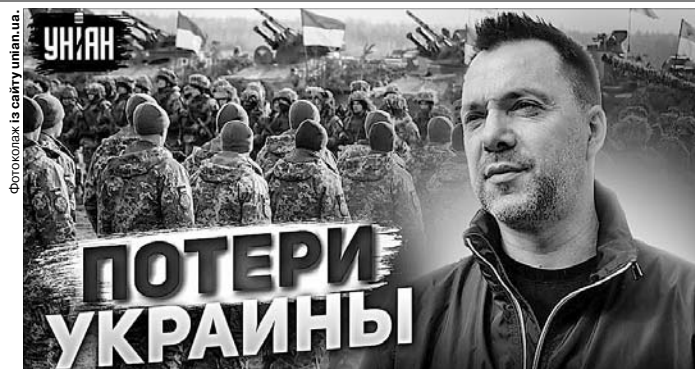
«Наших загинуло 10 тисяч, росіян – у вісім разів більше».