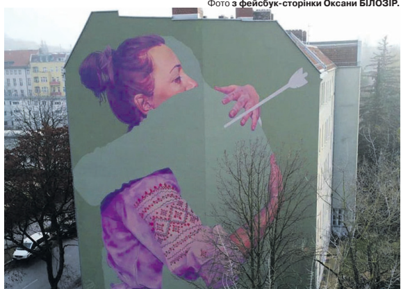
Вражаюче до сліз.

«Відсутній» створений за мотивами схожого муралу в українській столиці. У 2016 році його намалювали ті ж художники Innerfields. Київський мурал вони назвали «Присутній» (Present) і присвятили його анексії Криму. ■