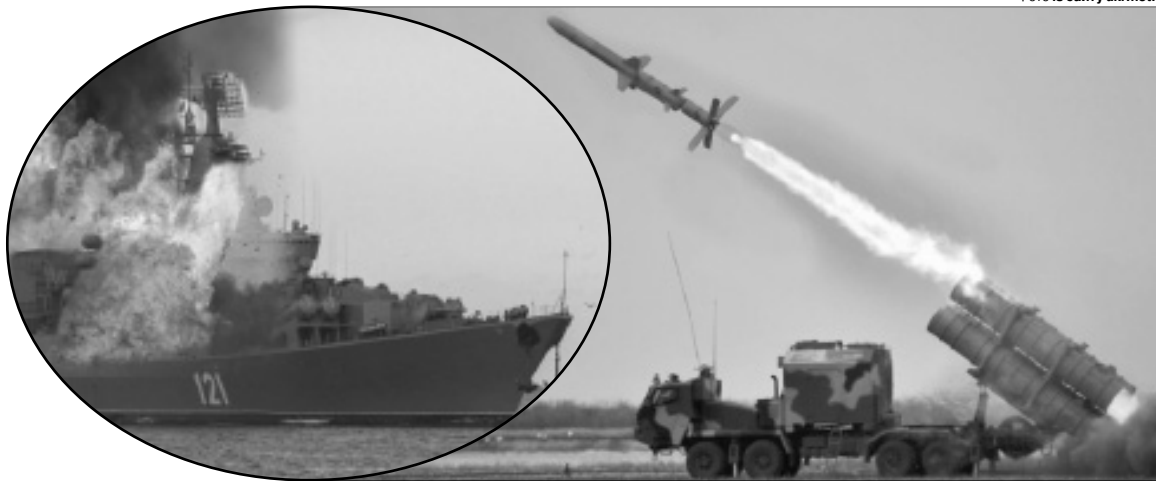
Перше бойове застосування «Нептунів» відбулося аж ніяк не у квітні, а в перші дні повномасштабного вторгнення росії.