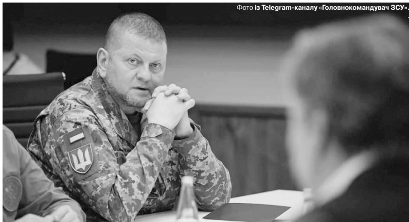
«Не бійтеся вбивати росіян і будь-яких інших ворогів».

що або ти виконаєш поставлене завдання, або тебе пошлють «на», — пояснив свою точку зору український генерал.