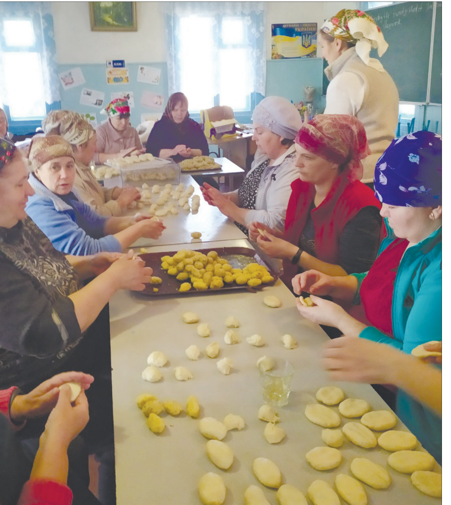
З перших днів війни вчителі почали волонтерити – до них долучилися інші мешканці села.

І дуже печальний спогад: – А після війни, в 1951-му, дядька виселили на Сибір, хоч він просив не робити цього, оскільки його талант вдома може послужити. Батько мій був на фронті, то