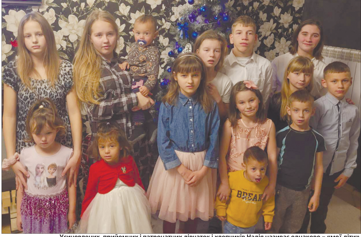
Усиновлених, прийомних і патронатних дівчаток і хлопчиків Надія називає однаково – «мої діти».