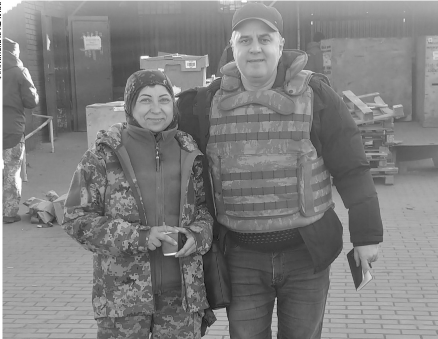
«Про волинський Світязь начувана і вже внесла його у свою «Карту бажань», де записує адреси, куди поїду після Перемоги».

української землі, щоб «ми хоча б на кілька років отримали перепочинок». Бо, переконаний, росія не полишатиме спроб нас знову загарбати. Тому в розмові просить «диванних експертів» не заважати воювати, а журналістів не ставити запитань на кшталт «Зеленський чи Залужний?», дякує батькам за патріотичне виховання (тато – військовий пенсіонер, мама – кухарка в дитсадку) і... розцвітає.