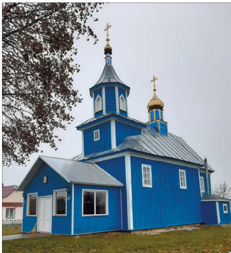
Старовинна Свято-Усікновенська церква, парафіяни якої в час війни долучилися до волонтерства.