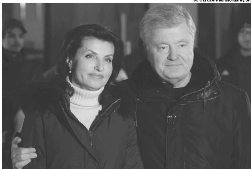
«Українці навчилися жити без світла. Але зрозуміли, що світло в нас самих».

Марина Порошенко звернулася до українських родин, розлучених війною, якнайшвидше возз'єднатися: «Моє побажання у цей день – нехай особливе тепло новорічної ночі подолає великі відстані і з'єднає розділені війною сім'ї. Що більшого можна