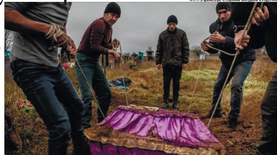
Перепоховання 16-річної дівчини: історія, від якої Шекспір би жажнувся.

Деталі цієї моторошної історії розповів у фейсбуці Богдан Куценко. «Чи не до кожного випадку з убивством і катуванням цивільних дотичні місцеві колаборанти. Село Мироліувка. Історія, від якої Шекспір би жажнувся. Семеро співробітників охорони фермерського господарства схоплені, зв'язані, закатовані, застрелені в голову і о четвертій ранку підірвані разом із будинком, у якому жили всі разом. Наймолодшому було 18 років, він закохався у місцеву дівчинку 16 літ, виявилось, що вітччм її бив і гвалтував з десятирічного віку. Хлопець та інші охоронці заступилися за неї, забрали до себе, пообіцяли йому проблеми, коли наші прийдуть. Вітччм був колаборантом і здав їх росіянам, як коригувальників». Усіх, як пише Куценко, розстріляли, включно з дівчинкою. Руки за спину, очі