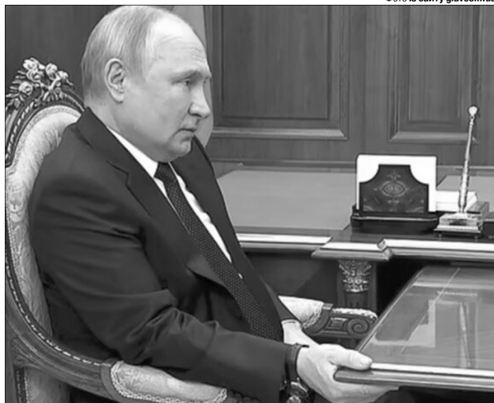
«Щоб полегшити біль, він намагається сидіти, міцно тримаючись за різні предмети».

мре від недуги, на яку страждає. Але з часом російська еліта може захотіти мати сильнішу людину біля керма. «У нас склалося стійке