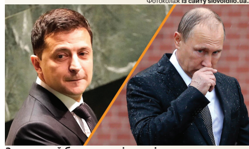
Зеленський буде на коні, а путін поводитиметься, як пацюк, загнаний у глухий кут.