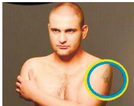
Мужнього воїна окупанти не залякали, бо на лівій руці він набив тризуб!