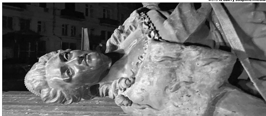
І не факт, що цій катюзі місце навіть у Художньому музеї.