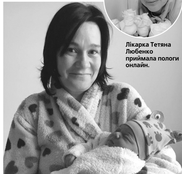
«... нічого кращого немає, як тая мати молодая з своїм дитятком малим» (Тарас ШЕВЧЕНКО).