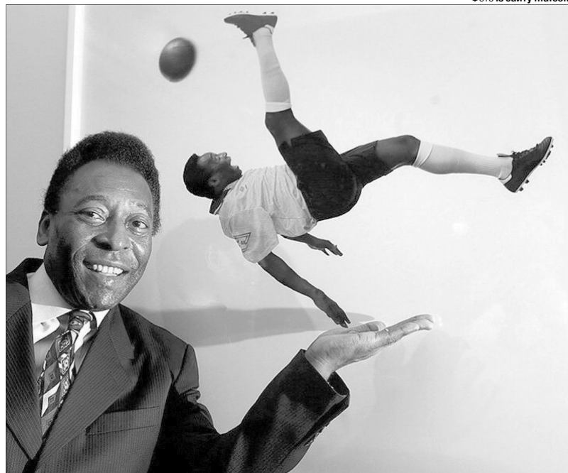
«А ви так зможете?». «Футболіст з іншої планети» мав і чудове почуття гумору.

Дізнавшись про смерть легенди, влада Ріо-де-Жанейро підсвітила статую Христа-Спасителя у кольори бразильського прапора, щоб віддати данину пам'яті триразовому чемпіону світу у складі національної команди країни.