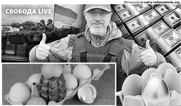
Міністр оборони Олексій Резніков і оком не моргнув, пояснивши українцям, що яйця для армії закуповують у кілограмах.