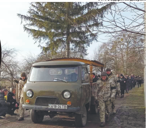
Село не перестав сумувати за односельчанином.