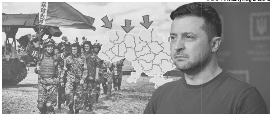
«Ми нападати на білорусь не збираємося і ніколи не збиралися».

Вона існує, але наш Президент вважає, що ні білоруське суспільство, ні солдати не хочуть воювати проти нас