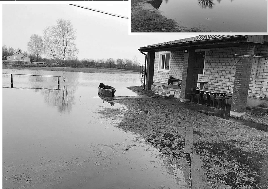
Ось такі пейзажі – швидше весняні, ніж зимові – непоодинокі зараз, зокрема у північних районах Волині: до багатьох обійсть хіба човном можна добратися.

Зокрема, працівниками Прип'ятської експлуатаційної дільниці ліквідовано розмив берега річки Виживка неподалік села Глухи Ковельського