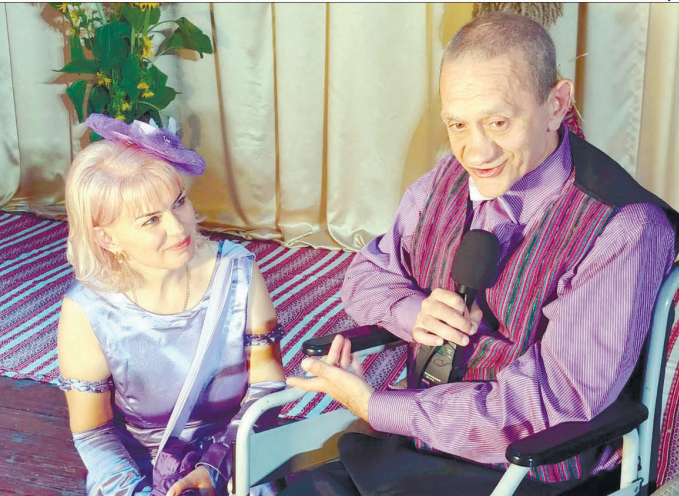
«Я щаслива тоді, коли бачу навколо щасливі очі».