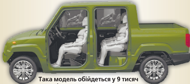
Така модель обійдеться у 9 тисяч доларів.

Виявляється, з Волинню «бойову машину» пов'язуватиме лише назва