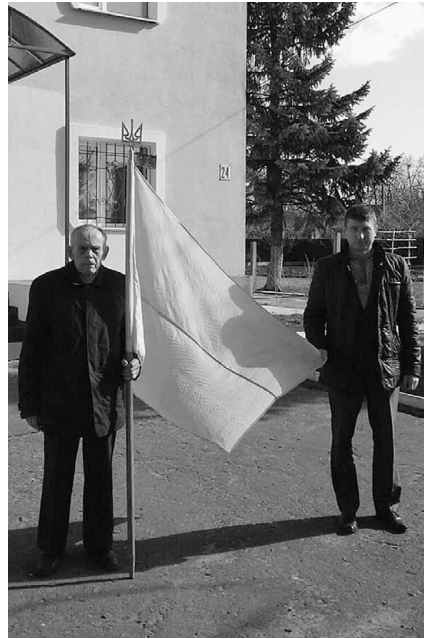
Цей жовто-блакитний прапор став цінним музейним експонатом.

«Я вдячний Богу, що мені вистачило сил та енергії разом із небайдужими ківерчанами ініціювати для громади чимало добрих справ.»