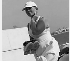
Фотозображення з сайту pravda.com.ua

Народний депутат, лідерка партії «Батьківщина» Юлія Тимошенко початок нового року зустріла у Дубаї (Об'єднані Арабські Емірати). Журналісти «Української правди» з'ясували, що Леді Ю жила на насипному острові Палм-Джумейра у п'ятизірковому готелі Kempinski, який має приватний закритий пляж. Більше того, нардепка з обережності сідала в авто не на вулиці, а у підземному паркінгу. Видання з посиланням на джерела зазначає, що родина доньки Тимошенко переїхала у Дубай ще до початку повномасштабного вторгнення і зараз там мешкає.