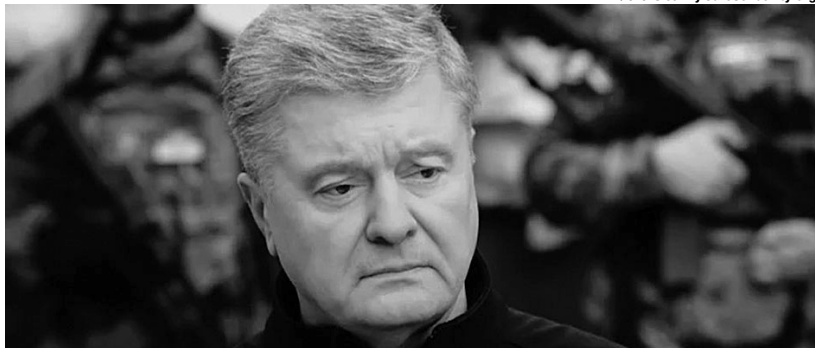
«Санкції і зброя, зброя і санкції – це те, що забезпечить наближення нашої спільної Перемоги і такий довгоочікуваний мир».

5. Закрити нарешті нафтогін «Дружба». «Це ж абсурд, коли росіяни знищують нашу інфраструктуру, а ми змушені прокачувати приблизно 12 мільйонів тонн російської нафти! За згодою із партнерами, не маю жодних сумнівів, Україна зупинить і «Дружбу», і нашу частину ГТС. Єдина причина, чому ми й досі качаємо нафту та газ, – рахуємося з думкою тих наших партнерів, які й досі споживають російські енергосистеми», – зазначає Порошенко.