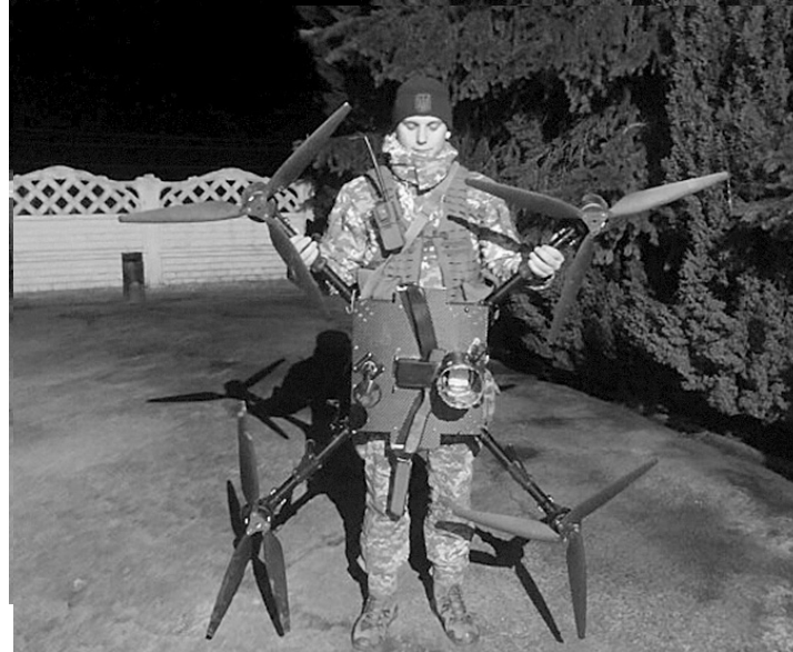
Така пташка не буде зайвою на фронті.