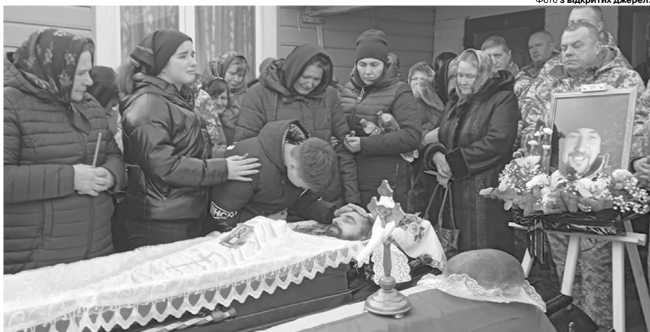
Біль рідних не передати словами...

Американське видання New York Times розповіло, що емігрант з України та громадянин США Григорій (Грегорі) Степанець заповів як спадщину 1 мільйон доларів Головнокомандувачу Збройних сил України Валерієві Залужному. Натомість генерал Залужний передав усю суму на потреби української армії, зазначивши: «Я все своє життя віддав Збройним силам. І не мав жодного сумніву, що повинен робити зі спадком. Остання воля пана Григорія, очевидно, полягала в тому, щоб підтримати в моїй особі українське військо. Вдячний усім, хто допомагає ЗСУ. І вдячний своїй родині за розуміння». ■