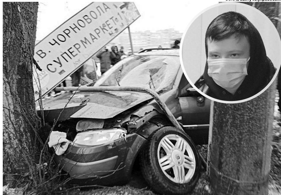
Нахабство винуватця ДТП, який намагався втекти з місця аварії, у грудні 2021-го обурило всю Україну.

Згодом слідство встановило, що за кілька тижнів до цього підліток, застосувавши балончик зі слезогінним газом, відібрав у знайомого мобільний телефон. Суд призначив неповнолітньому, який перебуває під вартою, покарання у вигляді семи років та шести місяців позбавлення волі. ■