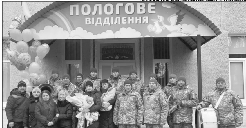
Немовля з мамою зустрічав оркестр побратимів Героя із 14-ї ОМБр імені князя Романа Великого.