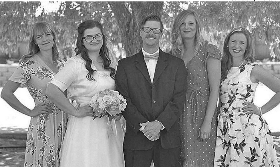
«І нехай султан мені заздрить!»