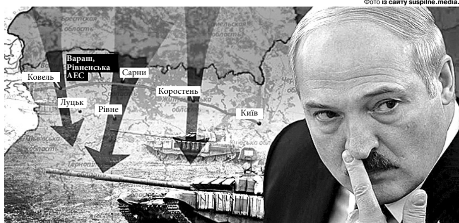
На будівництво бліндажів Люблинецька громада ще не витратила ні копійки – всі матеріали місцеві мешканці заготовляють своїми силами.