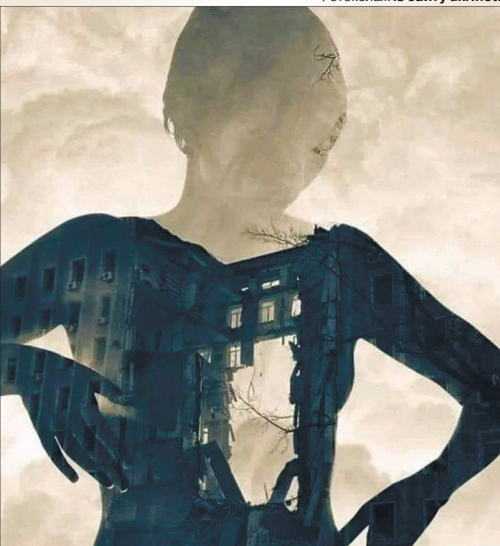
«Як ти?» – «Ось так!»