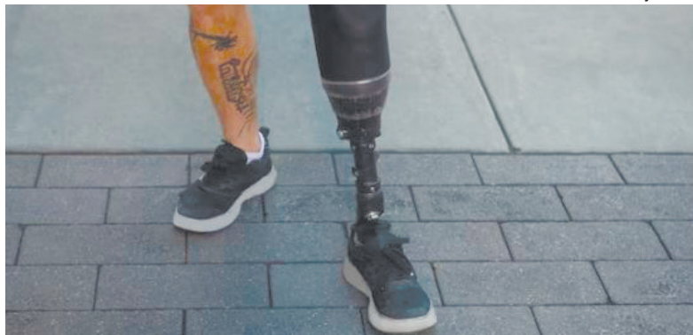
«Дай Боже, щоб ми були здатні приймати інших людей такими, якими вони є...»

Росаріо ГОМЕС, притча «Безумовна любов» на сайті prytychi.in.ua