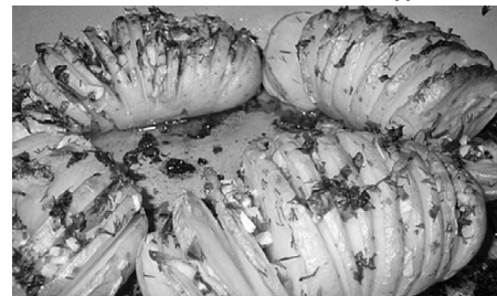
Смаж! Печи! Товчи!

Бульба є чи не основним продуктом харчування українців, ми готуємо з неї безліч страв. Але, на диво, знов і знов можна зробити щось по-новому