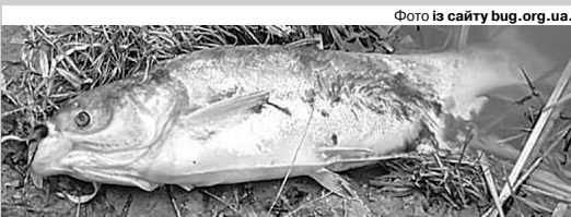
Ось такі сумні реалії.

На місці події працювала слідчо-оперативна група поліції та криміналістична лабораторія. ■