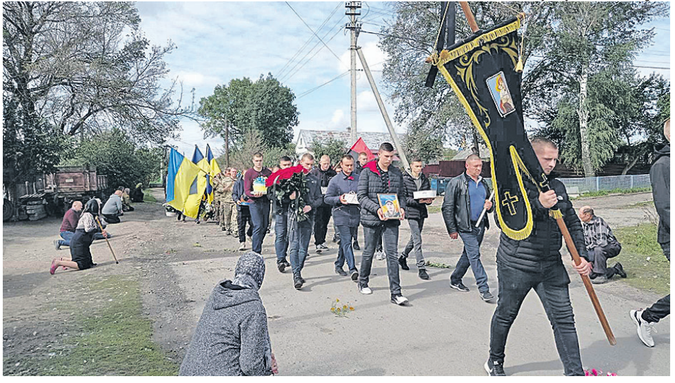
Навколішки проводжали односельчани в останню путь свого Героя.

– Хоч мрії про армію, – розповідає жінка, – у сина не було. Ваня добре вчився у Мар’янівській загальноосвітній школі, брав участь у дитячому зразковому гурті-студії «Кобзарик» – грав на бандурі, співав, малював. Мав титули «Містер класу», «Містер школи». А коли закінчив дев’ятий клас, то вирішив навчатися в Польщі, в місті Новогард, де вже понад десять літ жив його старший брат із дружиною. Вступив там до технікуму. За п’ять років одержав відповідні сертифікати на три фахи – електромеханіка з ремонту автомобілів, їх обслуговування та діагностики. Вже декілька місяців за кордоном працював.