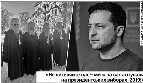
«Не виселяйте нас – ми ж за вас агітували на президентських виборах-2019!»

8. Ким для вас є постать В'ячеслава Чорновола? Серед людей, які в Україні суцільні нині і які були раніше, для мене є два світочі. Перший – це Тарас Шевченко, а другий – В'ячеслав Чорновіл. Це – український титан-державник. Вважаю, якби він переміг на президентських виборах, то Україна вже була б у сім'ї європейських держав, в НАТО. На початку 1990-х ми уявляли, що через тридцять років житимемо в квітучій країні, про що й мріяв Чорновіл. На жаль,