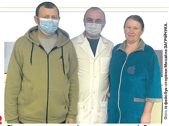
Лікар-трансплантолог і вдячне подружжя із Ратного.