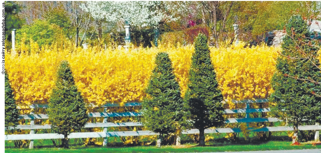
Навесні квітуча форзиція особливо ефектна на тлі хвойних дерев. Підходить цей чагарник як для групової, так і для одиночної посадки, для формування живоплоту, прикраси схилів.