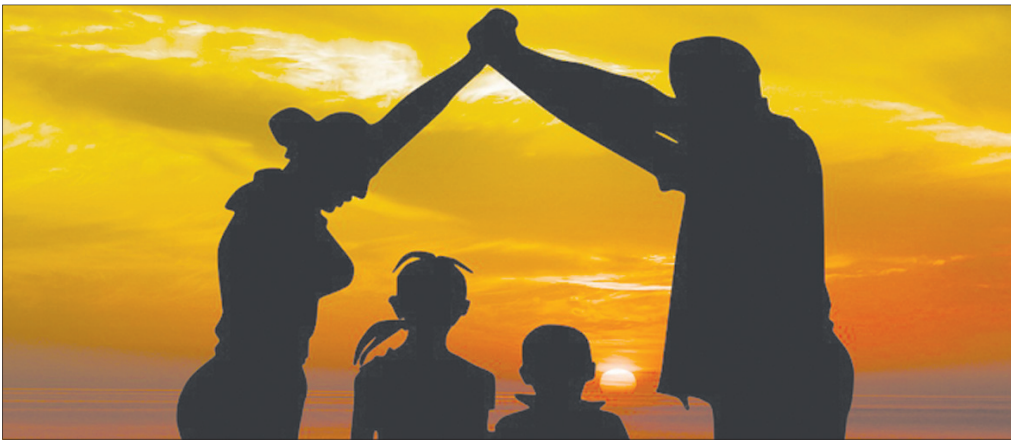
Секрет затишного дому, в який завжди приємно повертатися, – у маленьких ритуалах, які демонструють любов і прийняття.