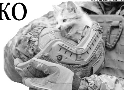
«Он у мене тут малеча...»