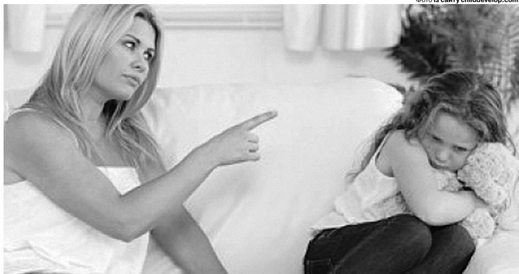
Стосунки з дочкою набагато важливіші за оцінки.