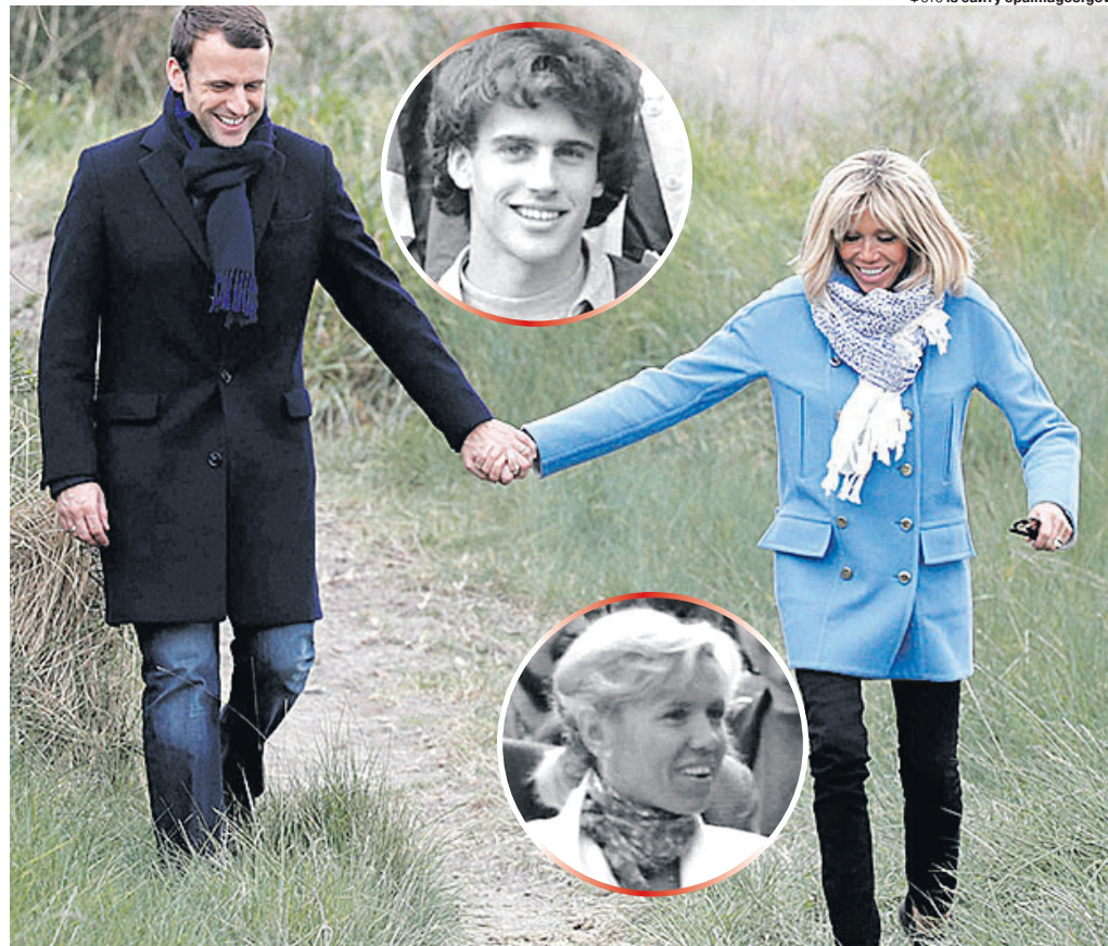
«У нас немає класичної сім'ї – це незаперечна реальність. Але від цього в нашій родині не менше любові».

Батьки Макрона, обоє лікарі, були шоковані, однак вирішили не пода-