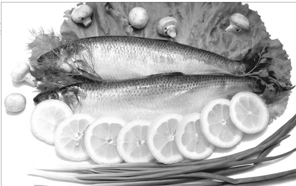
Лимон і риба – вдале поєднання, завдяки якому вдається позбутися специфічного різкого запаху і покращити смак страви.