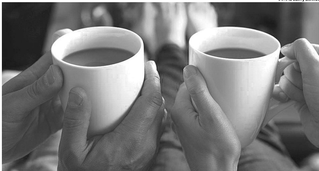
«Ми уникали дивитися на вікно, за яким стояла війна з кров'ю і сльозами».

«Так, шкода, шкода, що я не можу віддати тобі своє серце, бо воно дав-