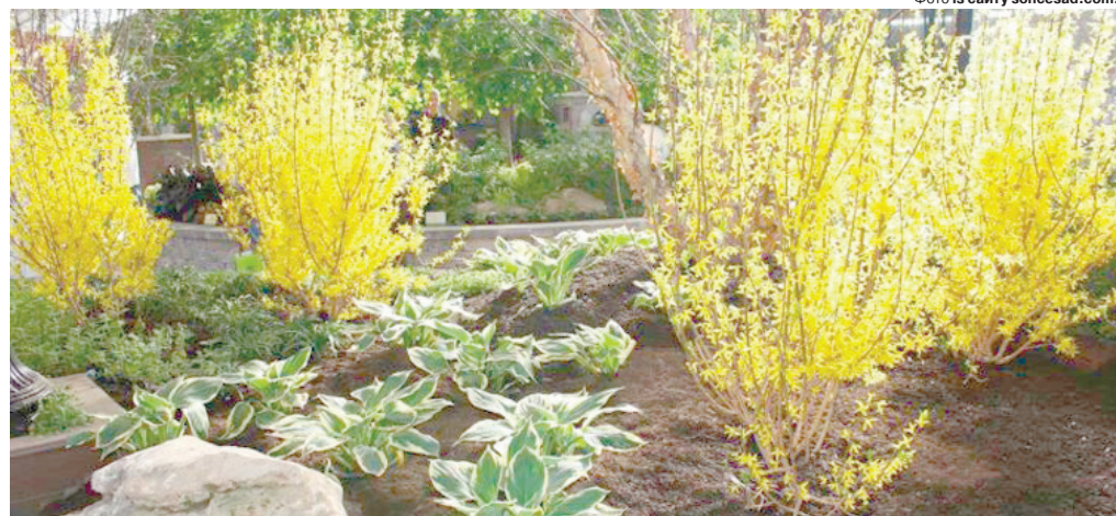
Дистанція до сусідніх кущів має бути 1,5 м (для високих сортів – 2 м).

лин має бути 1,5 м (для високих сортів – 2 м). Потрібні великі посадкові ями глибиною до 70 см і шириною хоча б пів метра. Ґрунт слід змішати у рівних частинах із компостом (чи перегноєм) і піском, на дно викласти два шари дренажу (20–25 см) – зі щебеню чи битої цегли і піску. Кореневу шийку потрібно залишити на рівні землі, для ясного поливу відразу зробіть лунку. Политі кущики замульчуйте.