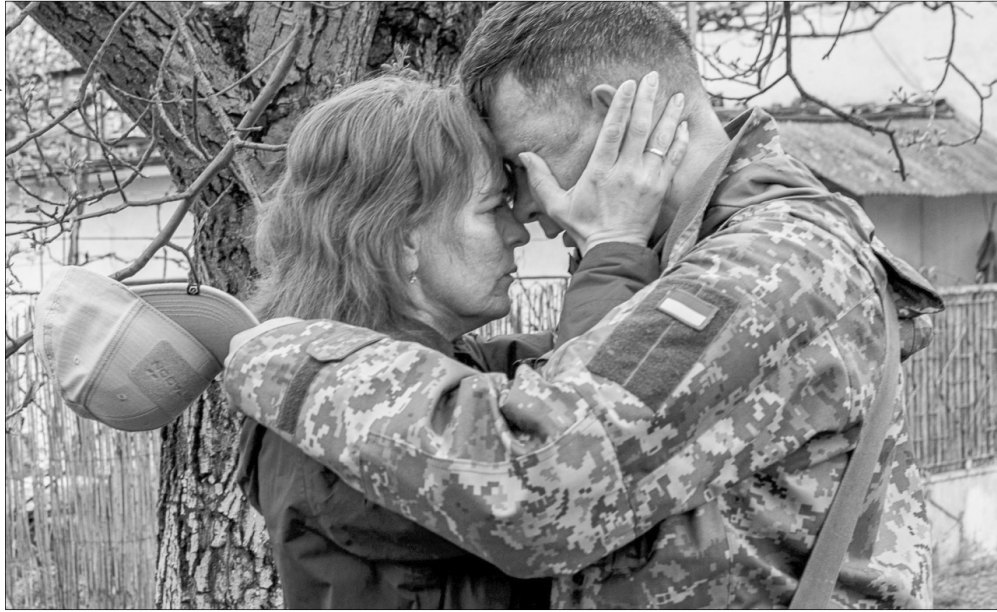
Вона фізично відчувала себе біля нього, ніби сама була на передовій.