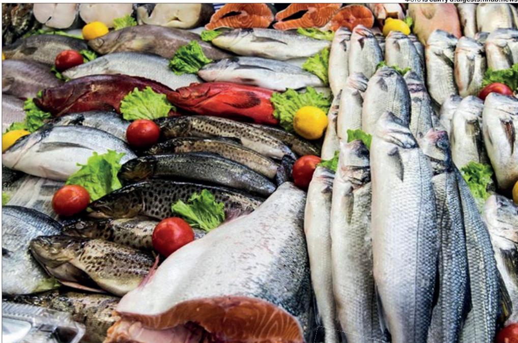
Від різноманіття лускатих на прилавках очі розбігаються...