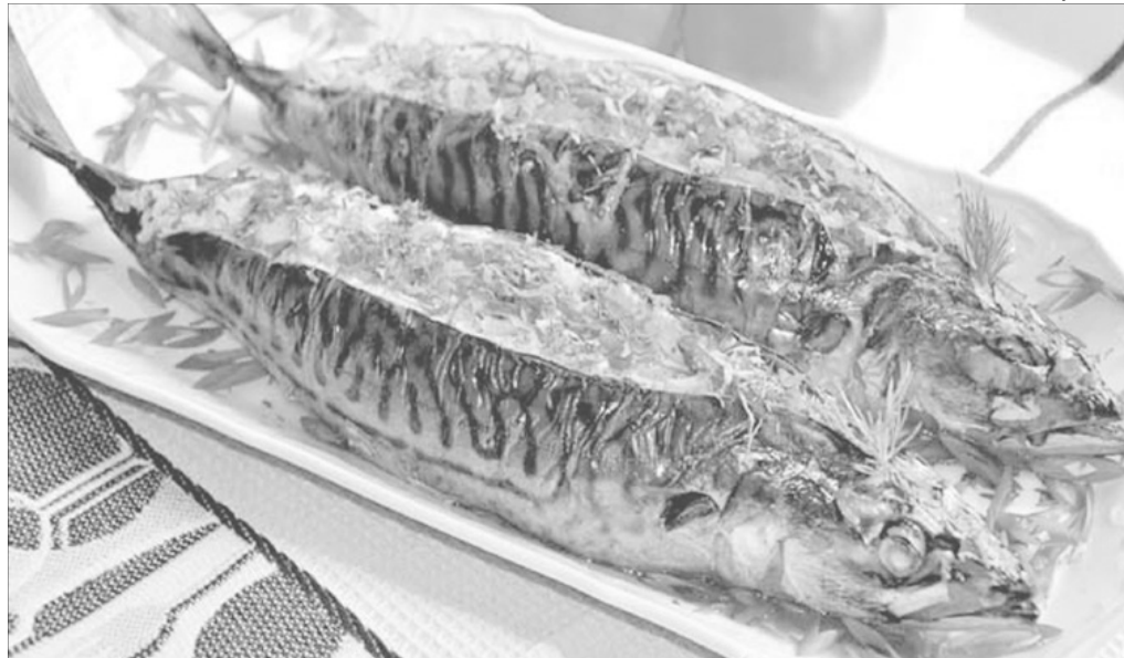
Чи не найпопулярнішою рибною стравою нині є запечена скумбрія у численних варіаціях і різноманітних поєднаннях.