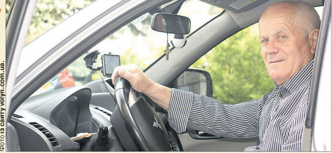
Перші водійські права Микола Денисюк отримав ще 1967-го.

17 квітня у редакції «Волинь» буде сонячно від щирих поздоровлень: на життєвий поріг нашого водія Миколи ДЕНИСЮКА (на фото) завітає 75-й день народження