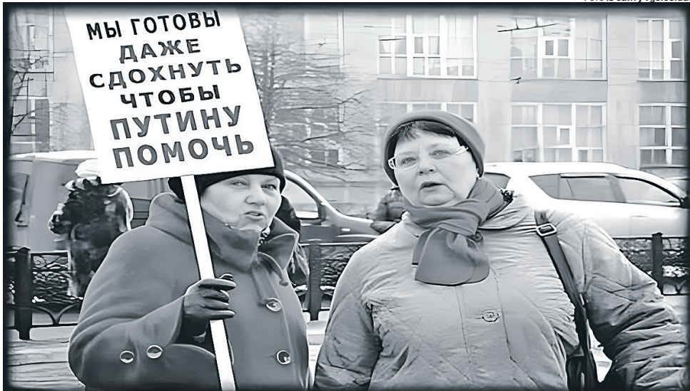
Ці божевільні панянки зможуть ще тримати такі плакати до 2036-го – часу, коли путін офіційно може правити росією відповідно до змін у конституції рф.

Ця фраза путіна розбиває усі закиди, що війна почалась нібито через бажання України стати членом НАТО. Приклад Фінляндії показав, що це не так. Ця країна має понад 1300 км кор-