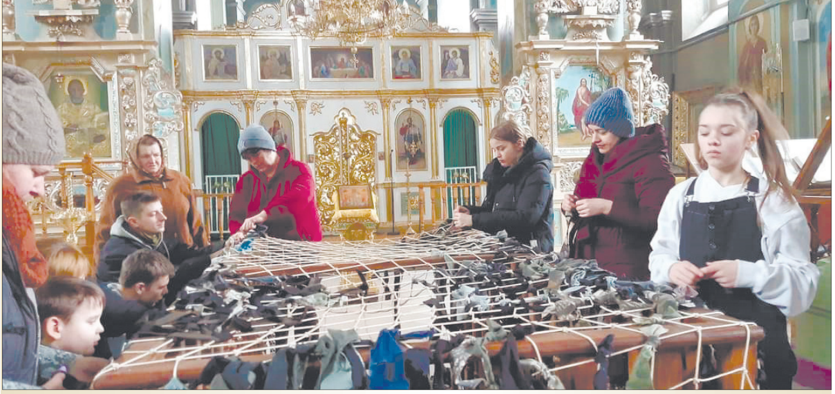
Маскувальні сітки плели безпосередньо у храмі – такого він ще не бачив.