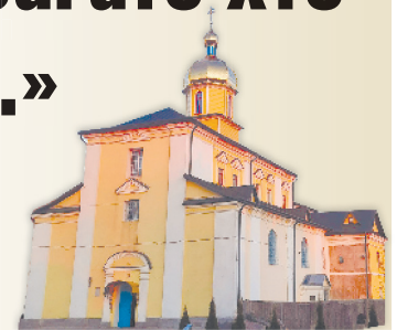
Чоловіча обитель об'єднала людей для доброї справи.

Із перших днів війни древня святиня – Жидичинський Свято-Миколаївський монастир – стала і надійним укриттям, і центром волонтерства