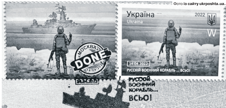
Марка «Русский военный корабль...всё!» стала найпопулярнішою 2022 року.

Як відомо, найбільший внесок у створення української крилатої протикорабельної ракети «Нептун», здатної вражати цілі на відстані до 280 кілометрів, був зроблений у 2015–2019 роках. 30 січня 2018-го відбулися успішні перші льотні випробування «Нептуна» за участі тодішнього секретаря РНБО України Олександра Турчинова, а 5 квітня 2019 року на полігоні в Одеській