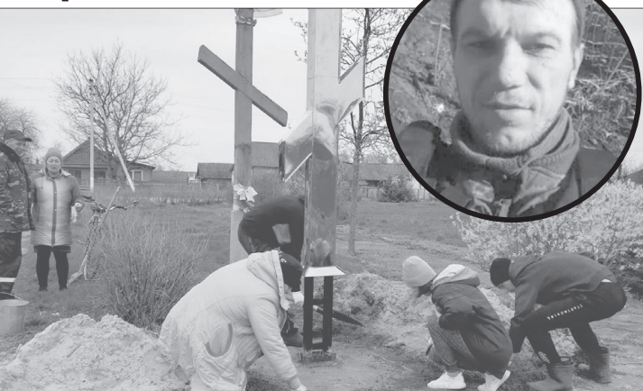
Тепер є ідея продовжити озеленення центральної частини села на знак пам'яті про полеглого Героя.