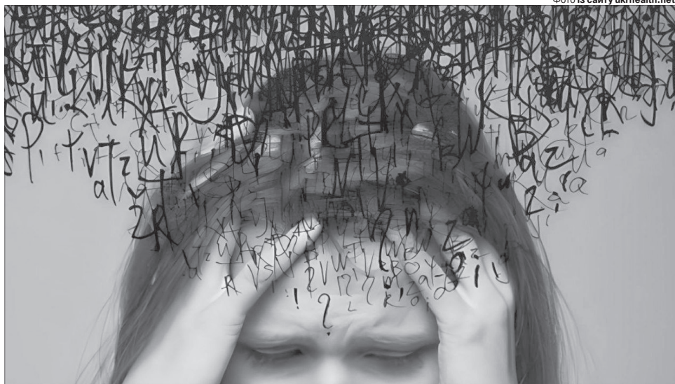
Питань у голові було стільки, що здавалося: вона от-от вибухне.

яка до тебе причепилася, зникне, якщо будеш вмиватися свяченою водою».