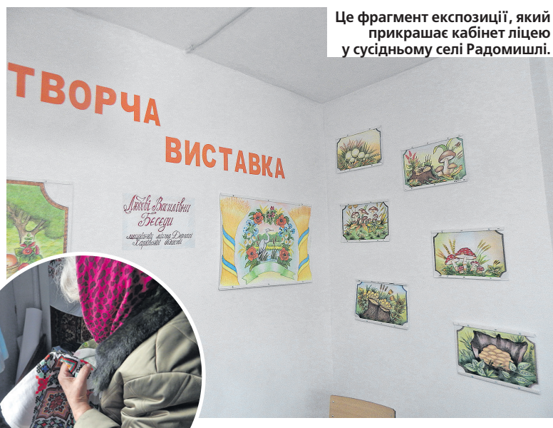
Це фрагмент експозиції, який прикрашає кабінет ліцею у сусідньому селі Радомишлі.