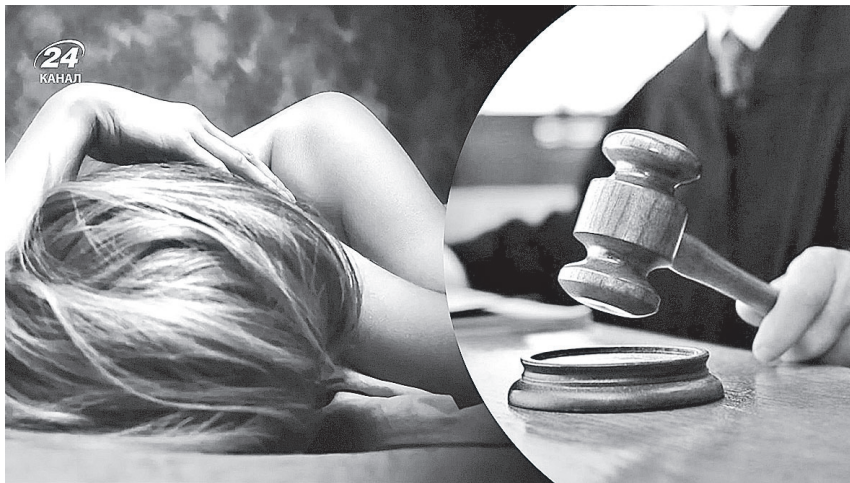
Жодного каяття у скоєному обвинувачена не висловила.

Воприлюднених у березні цього року матеріалах справи Шевченківського райсуду Львова йдеться про кримінальну справу мешканки Володимира Волинської області, яка в 2020 році продавала власні фото та відео порнографічного характеру в соцмережах.