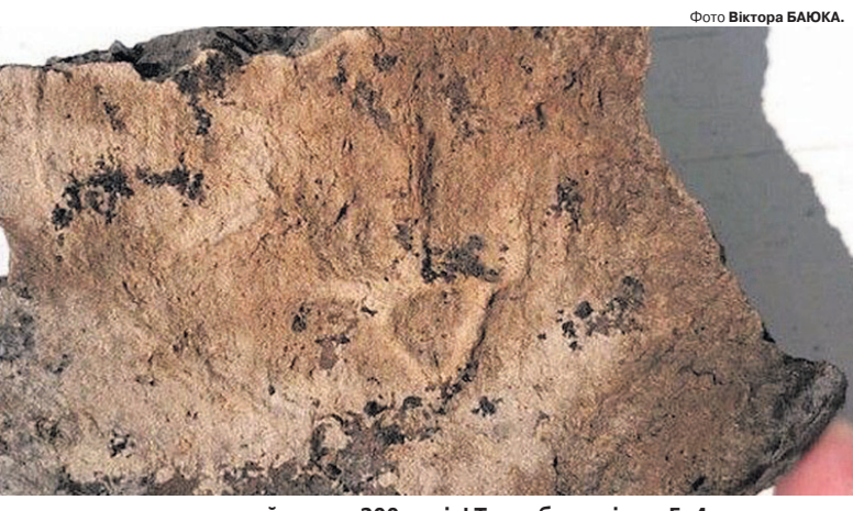
Цьому фрагменту посуду – щонайменше 200 років! Тризуб розміром 5x4 сантиметри.