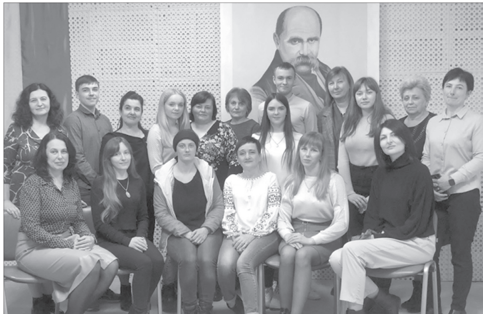
Кожну зустріч учасники літературного клубу «Натхнення» називають незабутньою і увічнюють світлиною.

«Учасниками «Натхнення» стали ті, хто не просто пише вірші, а не може їх не писати.»