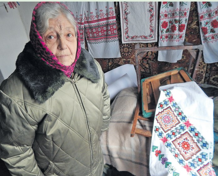
За тисячу кілометрів від дому вона знайшла порятунок у малюванні й хрещатих оберегах.