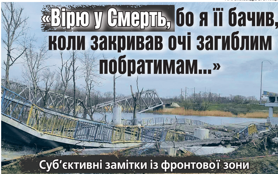
Фото Олександра ЗГОРАНЕЦЬ.

У мене перед очима виринає розкладене на землі солдатське вбрання і слова одного захисника: «Після окопів жодна пралка не потягне наш одяг». Тому воїни намагаються спочатку заїхати на мийку машин, там розкладають обмундиру-