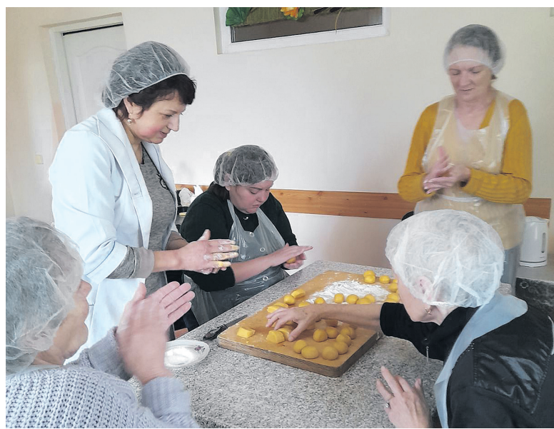
Підопічні жінки охоче долучаються до спільного приготування смаколиків, якими пригощають усіх мешканців закладу.