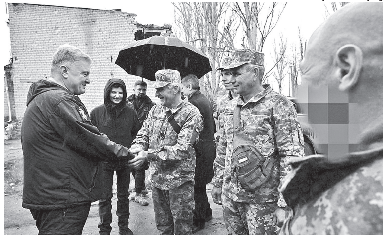
Козакам у 406-ту бригаду, яка й відправила російський крейсер на дно, команда Порошенка привезла залізни «гостинці» – вантажівки DAF, старлінки, рації і шини.

В Україні дуже оригінально відзначили річницю знищення найбільшого у Чорному морі військового корабля загарбників. Саме 13 квітня Президент України Володимир Зеленський підписав указ про День працівника оборонно-промисло-