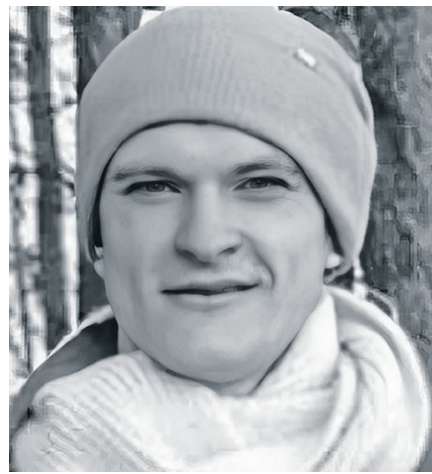
Уявіть, як же боляче воїну, якщо нам важко просто дивитися на ці фото.

Під час наради на Поліссі Президент заслухав доповіді про обста-