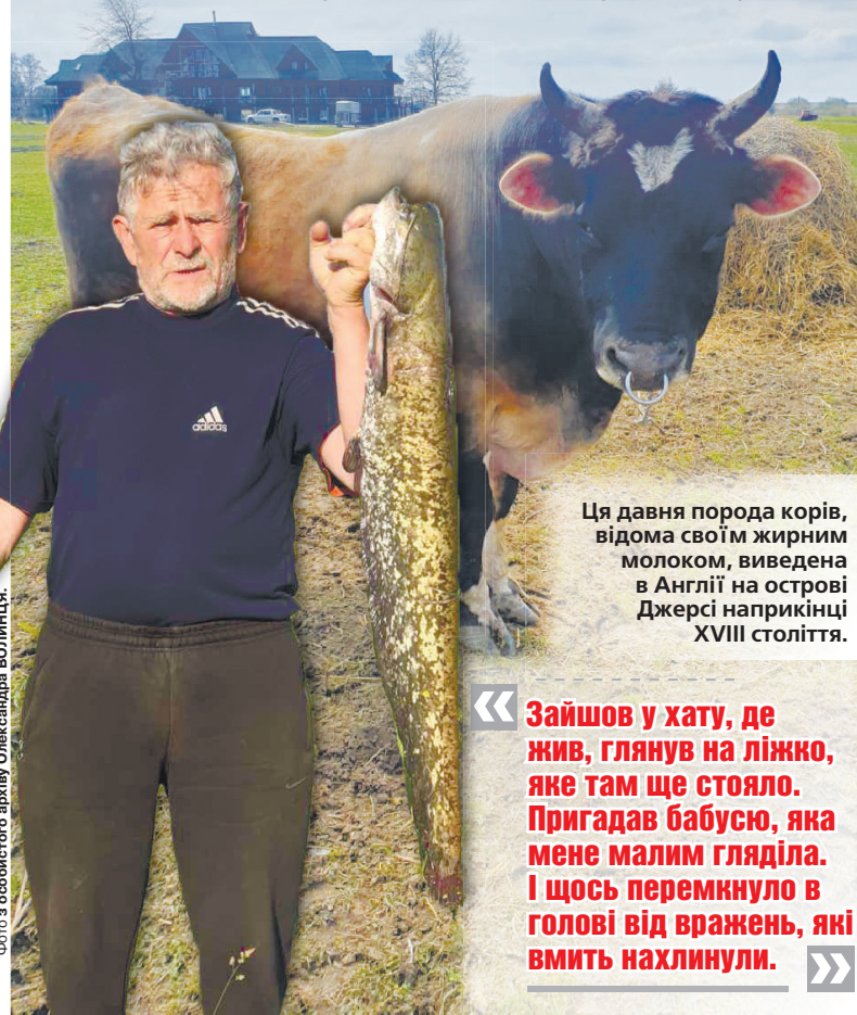
Ця давня порода корів, відома своїм жирним молоком, виведена в Англії на острові Джерсі наприкінці XVIII століття.

А ще – крутезним джерсійським коровам і граційним коням, подивитись на які до його нащадка приїжджають з усієї України