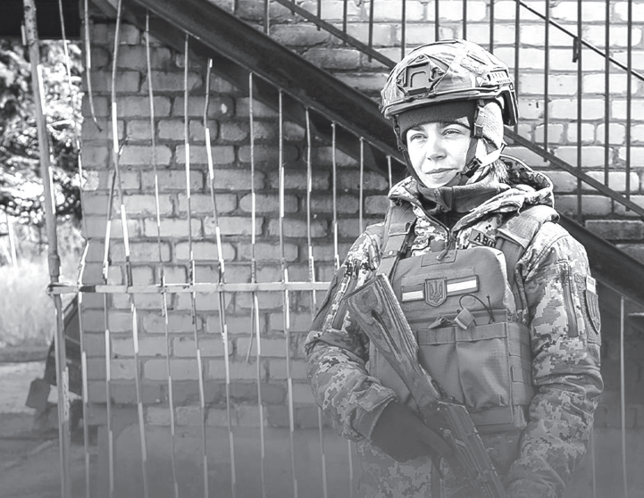
Альона каже, що вирішила присвятити себе служінню людям та країні.