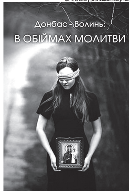
Цей лист ми проілюстрували обкладинкою збірника «Донбас – Волинь: в обіймах молитви: християнська поезія й проза» видавництва «Вежа-Друк» (Луцьк).

Помаленьку за свої і парафіян кошти він почав зводити церкву – і люди потягнулися до неї. Але з 5 тисяч населення приходило 10–50 осіб. Більше було на Водохреще і Великдень – освятити воду і великодній