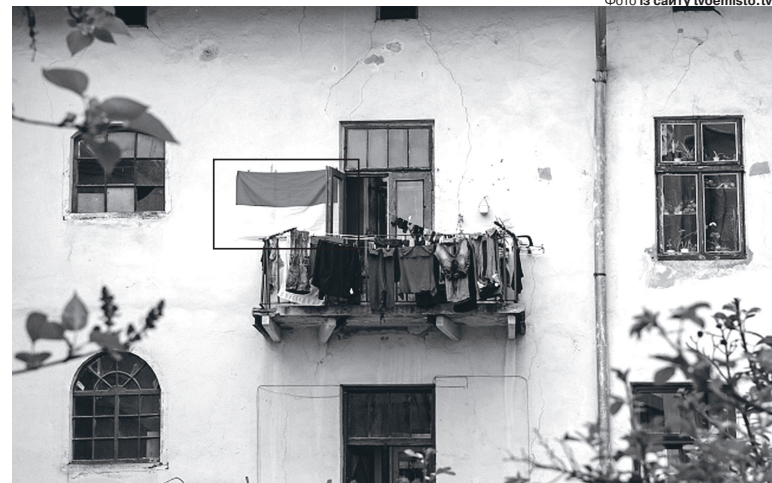
Війна навчила нас показувати й пишатися, що ми з України, найнесподіванішими способами.

Чітко пам'ятаю травневий день минулого року. Ми з мамою з мотиками наводимо лад на грядках. Неподалік бігає син із племінником і сусідськими дітьми; пахтить яблунево-вишневим цвітом – і тут оглушливий сигнал тривоги. Той звук, здавалося, пролазить у кожну клітину. Ми слухали і прикидали, куди можна заховатися від потенційної загрози. Мамині батьки, діти війни, навіть і думати не могли, що після такої великої біди колись може бути ще одна, тож у проєкті будинку нічого проти ракет не передбачили. Навіть льох розрахований тільки для зберігання картоплі, а не людського життя. Отож усі залишилися на своїх місцях, відчуваючи суміш розпачу з люттю до ворога... І ось знову травень. Війна й далі шарпає нерви смертями й каліцтвами. Але дякувати ЗСУ й ППО у нас, на Волині, немає тієї кількості тривоги, що була, а якщо й трапляється, то з усіх почуттів головну скрипку грає лише лють. Зник умовний рефлекс, який на початку війни штовхав купувати продукти тривалого зберігання.