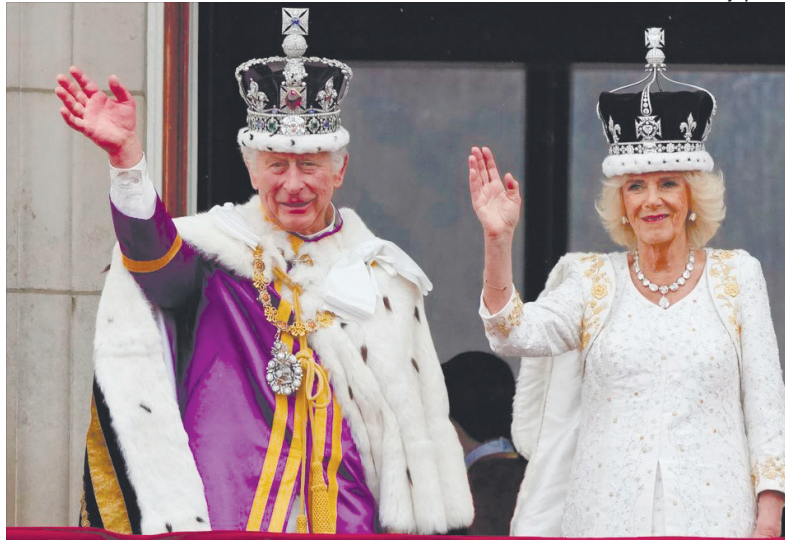
«Боже, бережи короля і його любов – королеву!»

6 травня у Вестмінстерському абатстві в Лондоні відбулася пишна церемонія коронації Чарльза III як короля Сполученого Королівства та країн Співдружності націй