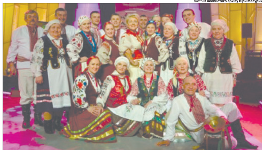
Народний аматорський фольклорний колектив «Родинне перевесло» став своєрідною візитівкою Веселого.