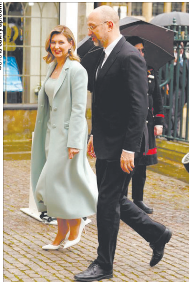
Перша леді України Олена Зеленська мала на церемонії одне з найбільш елегантних убрань.