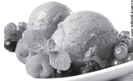
Поласуйте легким холодним десертом.

Головна його відмінність від іншого холодного смаколика – морозива – полягає у відсутності тваринних або рослинних жирів та, відповідно, зайвих калорій. Завдяки цьому він цінується прихильниками здорового харчування. Однак такі ласощі сподобаються не тільки їм, а й охочим просто насолодитися натуральним смаком ягід і фруктів. Як приготувати сорбет удома? Це просто – був би холодильник! Ще бажано мати блендер і морозильницю, але вони не є обов'язковими. Ще потрібна мінеральна вода (для приготування льоду), ну і бажані продукти: фрукти, овочі, сиропи, вино... Головне, щоб все було свіжим і хорошої якості