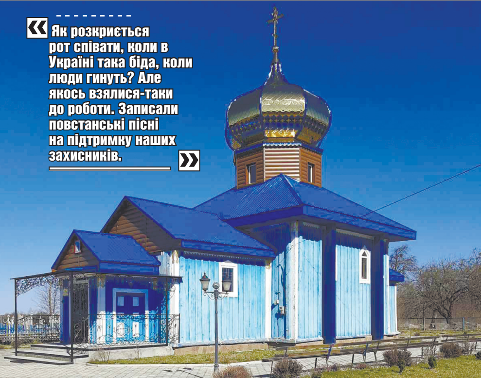
Друге народження храму припало на травень 1990 року, коли тут знову почалися відправи.