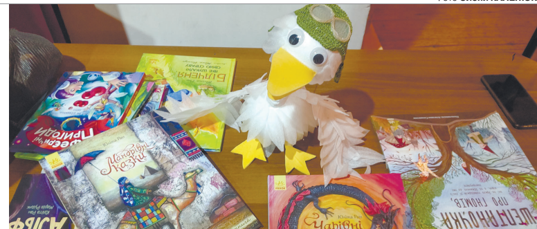
Росіяни придумали лякалку про бандерогусей – тепер із затурканих сусідів сміються навіть наші діти.

Акторка Волинського театру ляльок та представниця ГО «Жива