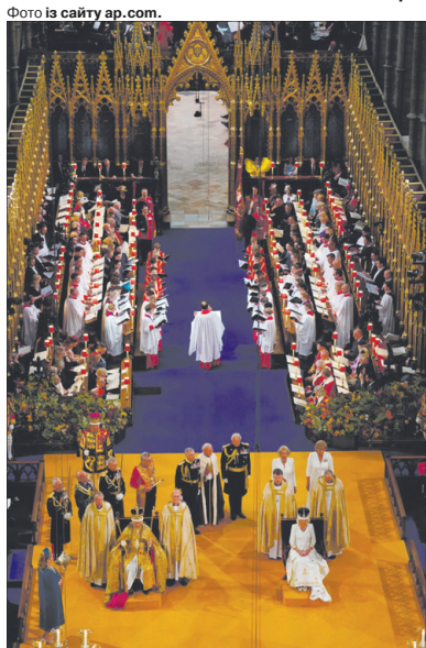
У соборі Святого Петра у Вестмінстері 6 травня 2023 року символічно постелили величезний килим у кольорах українського прапора.