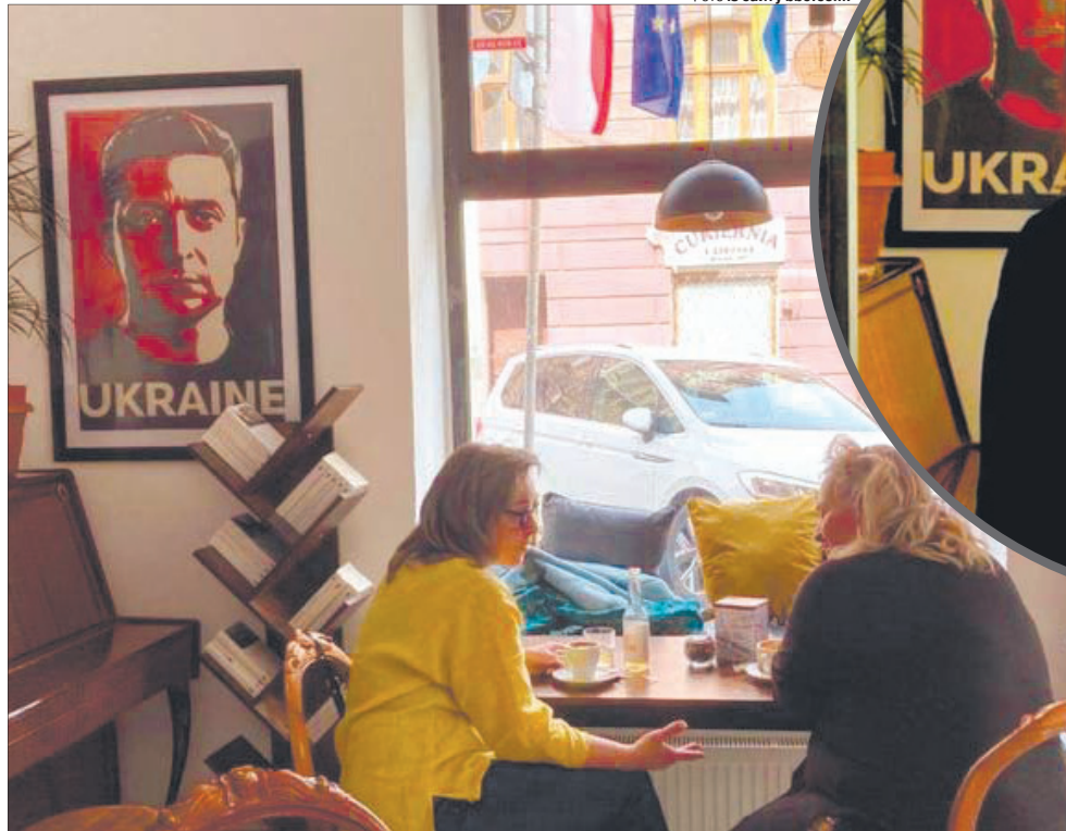
Це не просто кав'ярня, а ще й клуб за інтересами.

Але це лише зробило заклад, яким керують українки з окупованого Бердянська, відомим на всю країну