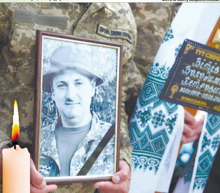
Залишився навіки 44-річним...