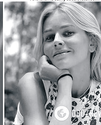
Фотоколаж із сайту obozrevatel.com