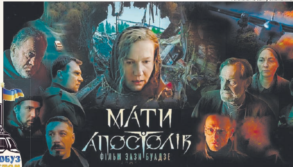
Ця драма присвячена всім матерям, діти яких загинули, захищаючи Україну.