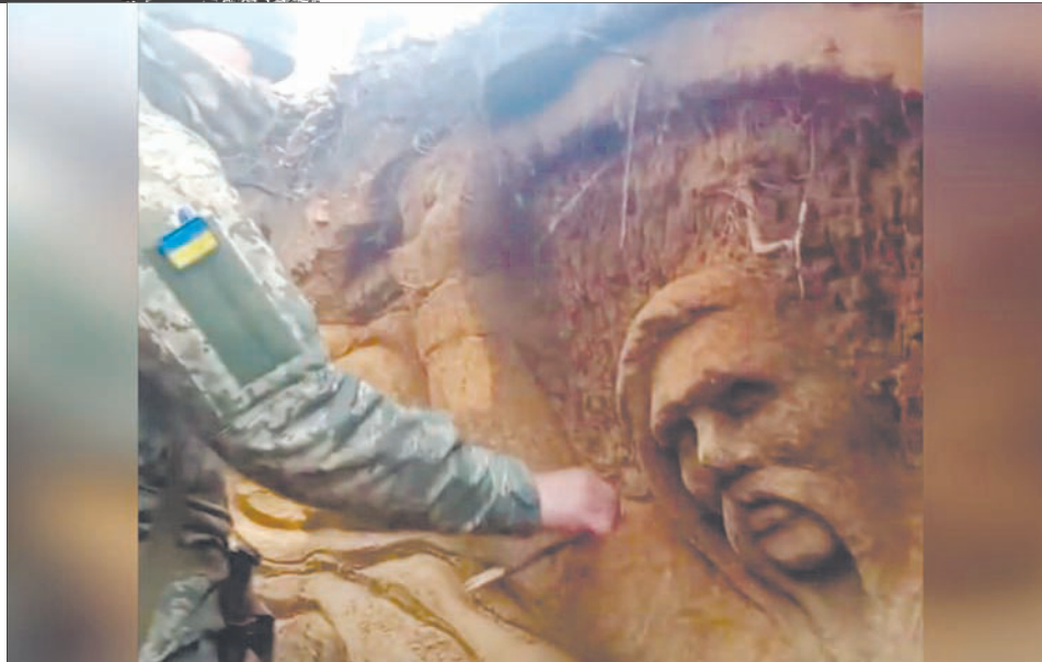
Воїни ЗСУ не лише хоробрі та відважні, а й талановиті.

«Робота називається «Боротьба». Символ боротьби українського народу – отакий козак. З нами добро, з нами Бог. Слава Україні!» – прокоментував свою роботу автор.