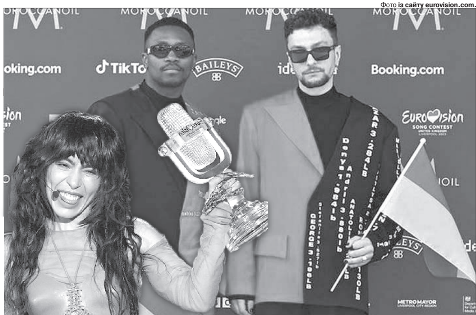
Все одно «синьо-жовті» триумфували: в Україні – 6-те місце, у Швеції – «золото»!

А триумфувала у фіналі «Євробачення-2023» 39-літня шведська виконавиця Loreen із піснею Tattoo, набравши 583