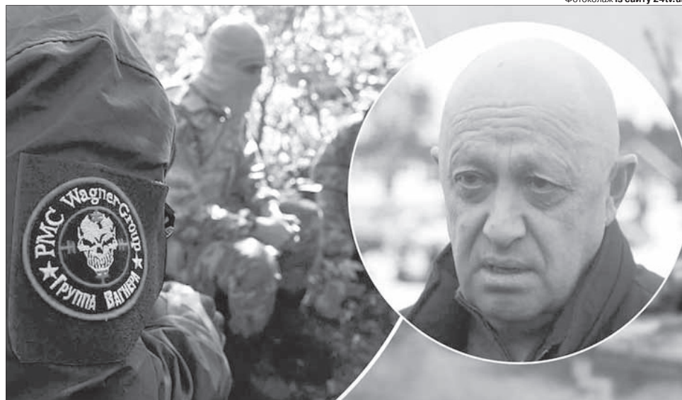
Горітиме це чмо у пеклі.

ють 5 000 танків. Якщо у них воювати вміло 20 тисяч людей, нині вміє воювати 400 тисяч.