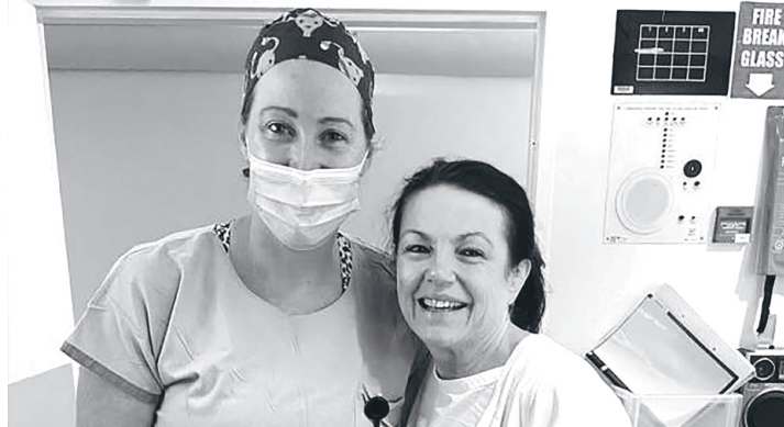
Мама-донорка (праворуч) з лікаркою тепер триматимуть кулаки, щоб вагітність проходила без ускладнень.