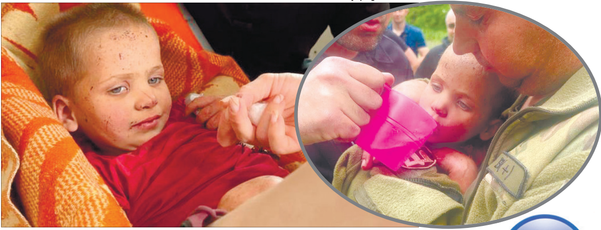
«Коли ми побачили її живу, мурашки – це найменше, що ми відчули. Мурашки і сльози».