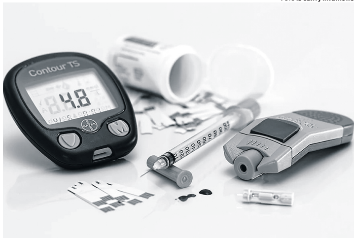
Важливо починати лікування одразу після встановлення діагнозу.

Підступність ЦД 2 типу полягає в тому, що на початку захворювання практично відсутні будь-які ознаки та симптоми. І це призводить до того, що вперше діагноз встановлюється, коли людина хворіє впродовж декількох років.