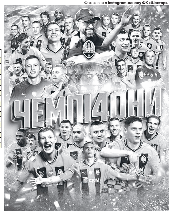
Фотоколаж з Instagram-каналу ФК «Шахтар».

Та й сам «чемпіонський матч» довів, що «Дніпро-1» ще замало каші з'їв, щоб почепити на себе золоті медалі, бо «Шахтар» в очному поєдинку буквально розтощив свого опонента. Більше того, після цього фіаско дніпріан за очками наздогнала луганська «Зоря», яка на виїзді перемогла «Олександрію» – 0:2. Так що доля срібла і разом з тим право грати