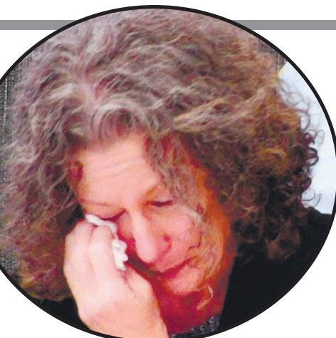
Справу 55-річної Фолбігг, яка завжди наполягала на своїй невинуватості, називають однією з найбільших судових помилок в Австралії...

Відтак губернатор Нового Південного Уельсу підписав указ про повне помилу-