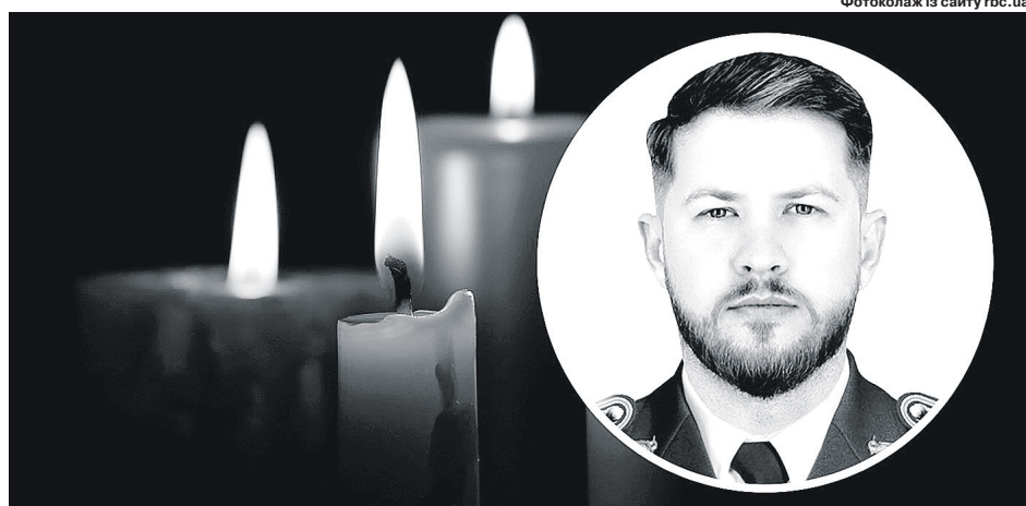
Фотоколлаж із сайту rbc.ua.

– Він був чудовою людиною! Хорошим другом, чоловіком, батьком, сином своїх батьків та України. Навіть будучи у довгому відрядженні за кордоном, він рвався в бій, щоб захищати свою