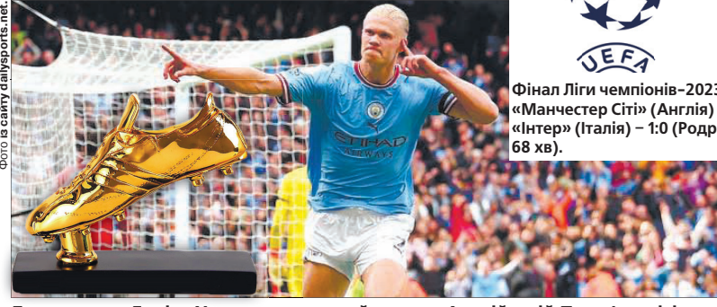
Людина-гол Ерлінг Холанд за перший сезон в Англійській Прем'єр-лізі забив за «Манчестер Сіті» 36 м'ячів і встановив рекорд ліги.

Нагорода «Золота бутса» вручається найкращому бомбардиру сезону за підсумками національних чемпіонатів. За правилами конкурсу, голи, забиті в топ-5 європейських ліг (Іспанія, Англія, Італія, Німеччина, Франція), множаться на 2. Для наступних країн, які посідають у рейтингу УЄФА з 6-го по 21-ше місце (Нідерланди, Португалія, Бельгія, Україна тощо), встановлений коефіцієнт 1,5. А от голи, забиті в лігах, що залишилися (починаючи з 22-ї країни за рейтингом), рахуються за номіналом.