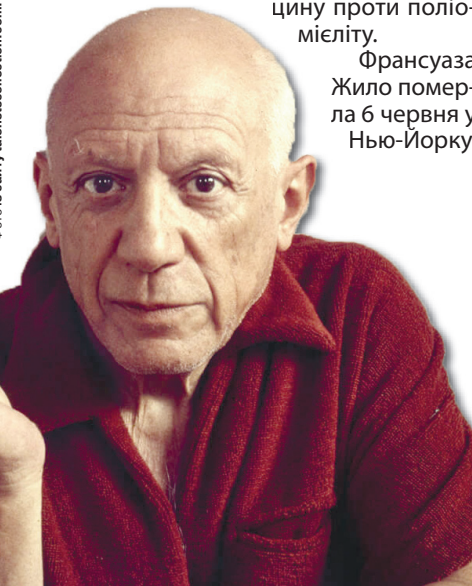
«Мені здається, жодна жінка не зможе бути щасливою з моїм сином. Він належить собі і нікому більше», – казала мати митця і була права.

– незабаром став зраджувавати Жило. У 1953 році Франсуаза забрала дітей