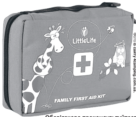
Обов'язково проконсультуйтеся з лікарем!