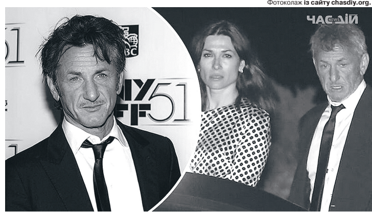
Нічого не скажеш – ефектна краля!

І зірка Голлівуду має на цей роман повне право, адже він – офіційно холостяк. 2022-го