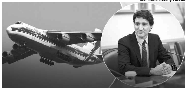
Ан-124 «Руслан» – це один із найбільших серійних вантажних літаків у світі, яких є на планеті лише 55.

Літак відправлять у рамках нового пакету військової допомоги. До нього також увійдуть десять тисяч артилерійських снарядів і 76 бронеавто-