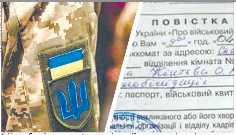
Свій службовий номер телефону працівник військкомату, звісно, міг записати і не на повістці...