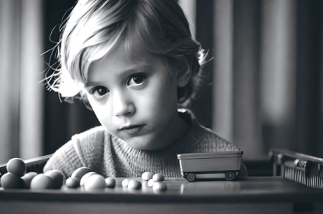
А раптом у цей момент малюк робить відкриття?