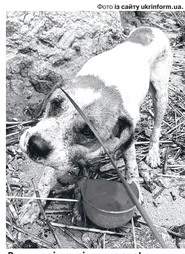
Вжив усім путінам на зло!

Як відомо, на узбережжя Одещини течією принесло фрагменти зруйнованих внаслідок підриву рашистами дам-